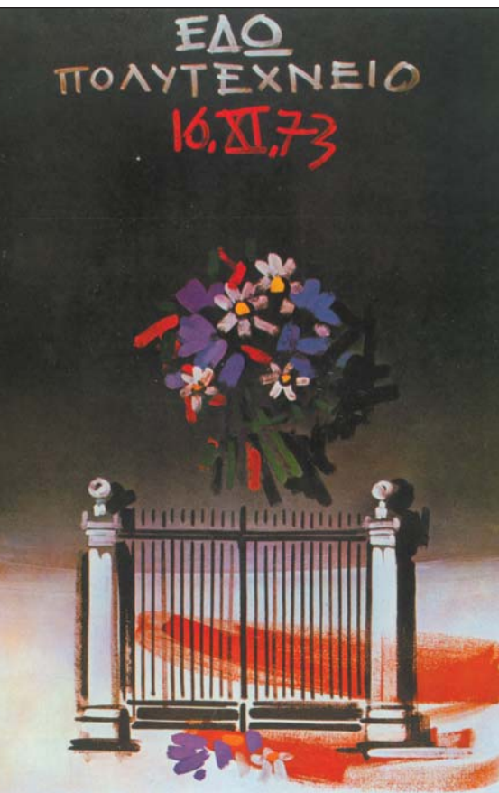
Αφίσα του Γιώργου Βακιρτζή

Το ποίημα δημοσιεύτηκε στον τόμο Αντιφασιστικά '67-'74 (1984) και αναφέρεται στην εξέγερση των φοιτητών στο Πολυτεχνείο, στις 17 Νοεμβρίου 1973, και στην καταστολή της από το δικτατορικό καθεστώς. Μεταφέρει την εικόνα που εμφανίζει ο χώρος γύρω από το Πολυτεχνείο λίγες ώρες ύστερα από την είσοδο των τανκς και την καταστολή της εξέγερσης, αλλά και τα συναισθήματα που γέννησε στους πολίτες η θυσία των νέων παιδιών.