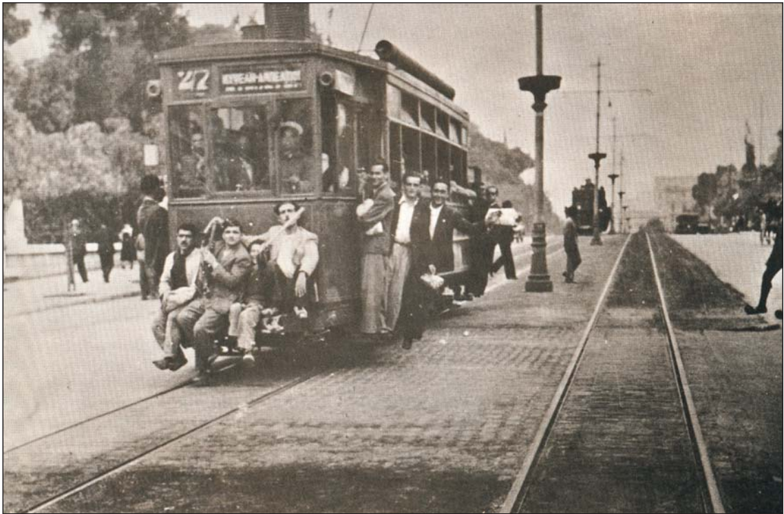
Αθήνα, 28 Οκτωβρίου 1940: Πολίτες σπεύδουν να καταταγούν στις στρατιωτικές μονάδες (φωτογραφία)

Μετά τους Αμπελοκήπους, μπαίνοντας στην Αθήνα, αντικρίζω την πρώτη πολεμική εικόνα και αισθάνομαι την πρώτη συγκίνηση της ημέρας. Μια στρατιωτική μονάδα φεύγει από τα Παραπήγματα. Οι στρατιώτες είναι άοπλοι. Είναι πολύ νέοι και καλά ντυμένοι. Τραγουδούν, γελούν και παίζουν φάπες, κάνουν σαν παιδιά που ξεκινούν για μια ευχάριστη εκδρομή. Μες στο λεωφορείο μου μια γυναίκα ξαφνικά αρχίζει και κλαίει με λυγμούς, μια άλλη κλαίει κρυφά, στρέφει το πρόσωπό της προς τα έξω για να μην τη δουν.