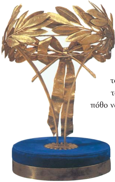
Χρυσό στεφάνι που πρόσφεραν οι δημοτικοί άρχοντες της χώρας στον Ελευθέριο Βενιζέλο μετά τη Συνθήκη των Σεβρών (1920)

Ο Βενιζέλος σηκώθηκε απ' το τραπέζι, έριξε μια γοργή ματιά κι αποχαιρέτησε τον τόπο, και πήρε το δρομάκο που 'βγανε όξω απ' το περβόλι. Ο λαός, που 'χε τρέξει μελίτσι να τότε δει ύστερη φορά, ♦ του άνοιγε πέρασμα ανάμεσα στα δέντρα και τότε φήμιζε ♦ σειώντας τα μαντίλια. Αυτός χαιρετούσε δεξιά ζερβά, με το χαμόγελο στα χείλη, και το γοργό του πάτημα έκανε να τρίζει το λιανοχάλικο ♦ κάτω από τα πόδια του. Οι παλιοί του συντρόφοι, οι συναθήροφοι ♦ κι οι φίλοι του είχανε τον πόθο να του ανοίξουν τις αγκάλες τους για να του πουν το κατευόδιο.