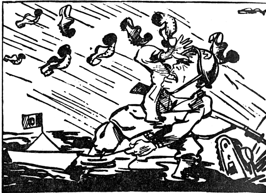
«Ιταλικόν ανακοινωθέν. Η βροχή και η κακοκαιρία μάς ημποδισε την προέλασιν». (Γελοιογραφία Ν. Καστανάκη)

Στο λεωφορείο διαβάζω την εφημερίδα μου και ξεχνιούμαι. Απάθειά μου. Οι επιβάτες μιλούν για τον πόλεμο με πολλή ψυχραιμία και κάποτε με ευθυμία.