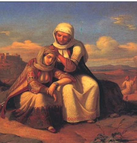
Θεόδωρος Βρυζάκης, Παραμυθία (λεπτομέρεια)

Τραβούν αργά το δρόμο κατά τα προχώματα, ♦ μαζί με τ' άλλο ρέμα του κόσμου που τραβά. Ζυγώνει ♦ η ώρα. Κανένας δε φωνάζει, κι όμως μια σύσμιχτη ♦ βοή ακολουθεί τον ίδιο δρόμο. Η χήρα σκύβει για στερνή φορά, κι άγρια και βραχνερά ♦ την άμοιρη μικρούλα θέλει να ορμηγέψει. ♦