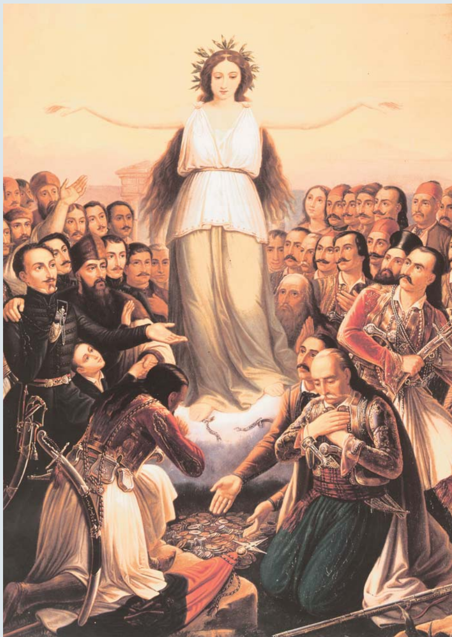
Θεόδωρος Βρυζάκης, Υπέρ πατρίδος το Παν

ΤΑ ΛΟΓΟΤΕΧΝΙΚΑ ΚΕΙΜΕΝΑ της «εθνικής ζωής» αναφέρονται σε γεγονότα και πράξεις που σχετίζονται με την ιστορία της νεότερης Ελλάδας και τους αγώνες του ελληνισμού για την ανεξαρτησία του. Αρχίζουν από τα χρόνια των κλεφτών, εστιάζουν στον Αγώνα του 1821, του κορυφαίου γεγονότος του σύγχρονου ελληνισμού, και αφού σταθούν στον Ελευθέριο Βενιζέλο και την Κατοχή, φτάνουν στο έπος του Πολυτεχνείου, την τελευταία αγωνιστική εκδήλωση του ελληνικού λαού για την υπεράσπιση των ελευθεριών του. Η ποικιλία των κειμένων (κλέφτικο τραγούδι, μυθιστορηματική βιογραφία, χρονικό, αφήγημα, σύγχρονη ποίηση) δείχνει το συνεχές και πολύμορφο ενδιαφέρον της λογοτεχνίας για τους εθνικούς και τους απελευθερωτικούς αγώνες.