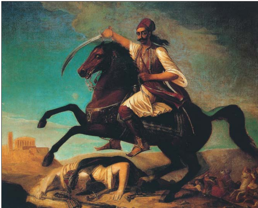
Γεώργιος Μαργαρίτης, Ο Γεώργιος Καραϊσκάκης ορμά έφιππος προς την Ακρόπολη

Συγκεντρώστε στοιχεία από το εγχειρίδιο του μαθήματος της Ιστορίας, αλλά και από άλλα βιβλία (εγκυκλοπαίδειες, ιστορικές μελέτες κ.λπ.), σχετικά με τη ζωή των κλεφτών και το ρόλο που διαδραμάτισαν κατά τη διάρκεια της Τουρκοκρατίας.