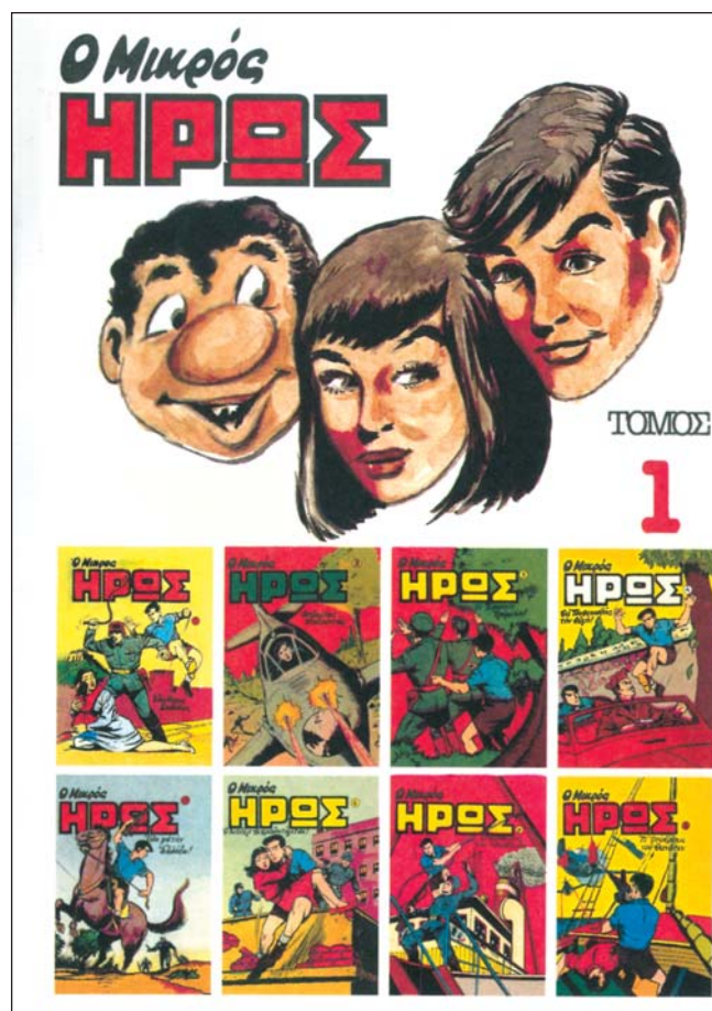
Εξώφυλλα του περιοδικού Ο Μικρός Ηρώς

♦ αν κοιτάς: αν τολμάς ♦ πολύμητις: έξυπνος ♦ καμαράτ: συνάδελφος ♦ για: ναι ♦ νιχτς: όχι