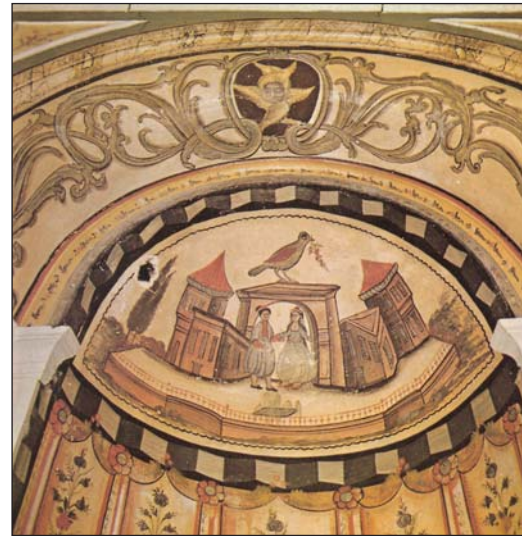
Τοιχογραφία από το αρχοντικό Κράλλη στο Μόλυβο

Χτίζαμε σπίτια όπου κι αν μας καλούσανε. Σπίτια αρχοντικά, σπίτια απλών ανθρώπων, μέχρι και εκκλησίες, αρκεί να εξασφαλιζαμε όσο καλά γινόταν μια δίκαιη αμοιβή και την αποπληρωμή της. Στη συμφωνία πάντα έμπαινε η εξασφάλιση τροφής και στέγης. Αγαπούσαμε τη δουλειά μας κι ας ήτανε σκληρή. Δουλεύαμε καλά την πέτρα, γιατί την ξέραμε. Γνωρίζαμε τα χούγια της, τη φύση της, πώς την πιάνεις, πώς τη χτυπάς και πού ν' ανοίγει, πώς τη λαξεύεις, πώς την τοποθετείς και πώς χαντρώνεις. ♦ Τα καντούνια ♦ τα 'ριχνα πάντα εγώ, το ίδιο και τις βόλτες, ♦ βόλτες μικρές, μεγάλες. Εγώ διάλεγα και έριχνα τις πλάκες πάνω από πόρτες, παράθυρα ή παραθούρες και φυσικά εγώ τα θυρώματα και τα σαχνισινιά, ♦ είτε από πέτρα είτε από δρένιο ♦ ξύλο. Άμα μας άρεσαν τα σχέδια, μας έβγαινε και το μεράκι και παιδευόμασταν χάρη της ομορφιάς, για πράγματα που δεν ήτανε στη συμφωνία. Σχέδια απλά μπορούσα και μόνος μου να φτιάξω, σχέδια ξένων όσο περίπλοκα και να 'ταν