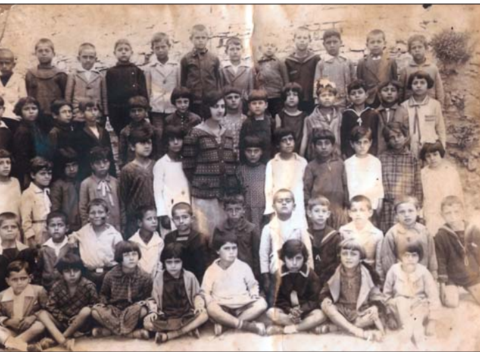
Μαθητές Δημοτικού Σχολείου (αρχές 20ού αι.)

Τινάχτηκε από την έδρα, ξεκρέμασε από τον τοίχο το βούρδουλα.