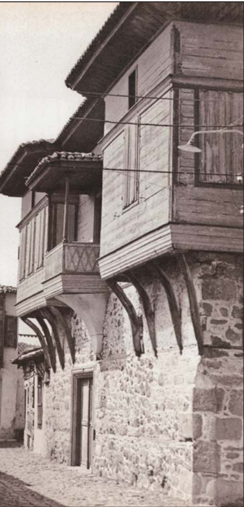
Αρχοντικό στη Λέσβο (φωτογραφία)

λύση που όλοι ποθούσαν. Και το Στρατή τον απασχολούσε ο ατμός και οι ατμομηχανές, πως άκουγε στην αγορά ότι θα άλλαζε τη ζωή πλούσιων και φτωχών. Στο τέλος πήγα κι εγώ και βρήκα έναν μηχανικό να τον ρωτήσω πώς θα μπορούσα να χρησιμοποιήσω τον ατμό και στη δική μας τέχνη, μα σύντομα φάνηκε πως δύσκολα θα μπορούσε να σκεφτεί την όποια χρήση. «Στη γνώση και στη μαστοριά της τέχνης σου ο ατμός δεν έχει θέση», κατέληξε ο Αχιλλέας που είχε γυρίσει μηχανικός από την Αγγλία. «Αλλά να ξέρεις αυτός θα γυρίσει τη ρόδα της ζωής μας, της