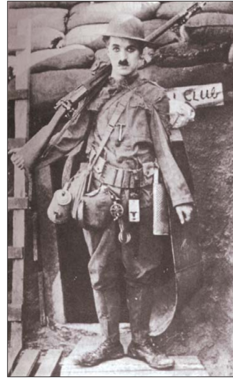
Τσάρλι Τσάπλιν: Ο Σαρλό στρατιώτης (φωτογραφία)

Κι όλοι στον κινηματογράφο βάλαν τα γέλια μόλις τον είδαν. Μόνο ο Πέτρος δε γελούσε. Σκεφτόταν το μωράκι. Τότε ο Σαρλός πήγε κατά τα σκουπίδια. Ο Πέτρος τον έβλεπε να περπατάει έτσι παρτσακλά, ✦ με το καπελάκι του το στρογγυλό, το στενό του το σακάκι, το αστείο του το μουστάκι, τα φαρδιά του τα παντελόνια, τα χοντρά του τρύπια παπούτσια και το μπαστουνάκι του κι ένωσε την καρδιά του να ξαλαφρώνει λίγο. Κι όταν είδε το Σαρλό να σκύβει πάνω στο μωράκι, να το παίρνει στην αγκαλιά του και να του γελάει με κείνα τα όμορφα μάτια του και να του κάνει χίλια δυο χαρούμενα καμώματα, ο Πέτρος δε βαστήχτηκε, γέλασε κι αυτός. Ήταν τόσο γλυκούλης και τόσο καλός ετούτος ο παράξενος αλητάκος.