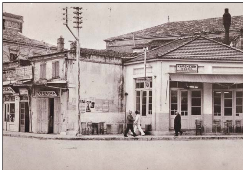
Καφενείο στη Μυτιλήνη (φωτογραφία)

Στην αγορά από το βουητό δεν άκουγες τι έλεγε ο διπλανός σου. Τα καφενεία μακρόστενα, είχανε πρόσωπο και στους δύο δρόμους και αυτό τα ζωντάνευε ακόμη πιο πολύ. Τα διέσχιζες καλημερίζοντας κι έκοβες δρόμο. Στο καφενείο που σταματήσαμε για έναν καφέ, όλοι μιλούσαν μ' όλους, καλημερίζαν κι αντικαλημερίζαν, δύο ειδήσεις πέταγε κάποιος μεγαλόφωνα για όποιον ενδιαφερότανε, κάποιος άλλος έδινε χρωστούμενες απαντήσεις σε κάποιον περαστικό που έμπαινε, στο πόδι κλεινόντουσαν συναντήσεις για πιο ύστερα, η μια πίσω από την άλλη, φιστικοπώλες και γιαουρτζήδες πλανόδιοι με γάλα και γιαούρτι σουρτα φέρτα από μαγαζί σε μαγαζί, παραγγελίες προφορικές δεν ήξερες από ποιον σε ποιον, αλλά πως φαίνεται όλοι συνεννογιόνταν, κι οι καφετζήδες να μπαινοβγάζουνε στη χόβολη τα μπρίκια πιο οβέλτα από τους βιαστικούς πελάτες τους. Ο χρόνος έτρεχε γι' αυτούς και αυτοί τρέχαν μαζί του. Ντυμένοι με ρούχα ευρωπαϊκά, ξεχώριζαν αμέσως απ' τους Τούρκους. Γι' αυτούς δεν υπήρχε χρόνος, δεν υπήρχε ενδιαφέρον,