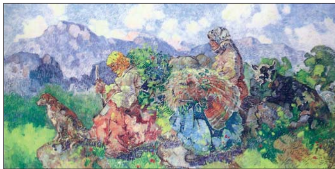
Επαμεινώνδας Θωμόπουλος, Οι θερίστριες

Οργανώστε στην τάξη σας μια ωριαία εκδήλωση με αφορμή το ποίημα του Κρυστάλλη: ζωγραφίστε ένα ηλιοβασίλεμα ή εικόνες γεωργών, με χρώματα και λεπτομέρειες που σας ενέπνευσε το ποίημα· διαλέξτε μουσική που να ταιριάζει με την ελληνική ύπαιθρο και τις ασχολίες των ανθρώπων της (π.χ., με φλογέρα, κλαρίνο) και διαβάστε και άλλα ποιήματα ή πεζά που να έχουν το ίδιο θέμα με το ποίημά μας.