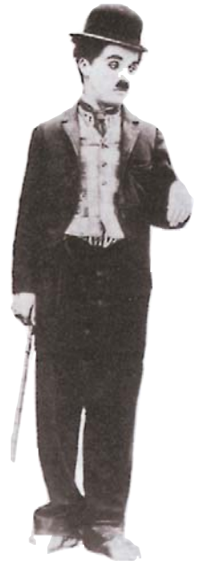
Τσάρλι Τσάπλιν: Σαρλό (φωτογραφία)

Η Ανθούλα φορούσε λουλουδάτο φουστάνι με βολανάκια ♦ και τιράντες που σταυρώνανε πίσω στην πλάτη, παπούτσια μαύρα, λουστρίνια, με λουράκι και κουμπί κι άσπρα καλτσάκια. Μα εκείνο που ήταν μεγαλείο ήταν το καπέλο της. Καπελίνα την έλεγε η κυρία τελώνη κι ήταν ψάθινο με κορδέλα σιέλ και εφτά κατακόκκινα κεράσια στο πλάι. Άσε πια εκείνη η τσάντα της. Την είχε κρεμασμένη από το λαιμό της κι ήταν από χιλιάδες μικρές πολύχρωμες χάντρες καμωμένη, που σχημάτιζαν όμορφα σχέδια από κύκλους, τον ένα μέσα στον άλλο.