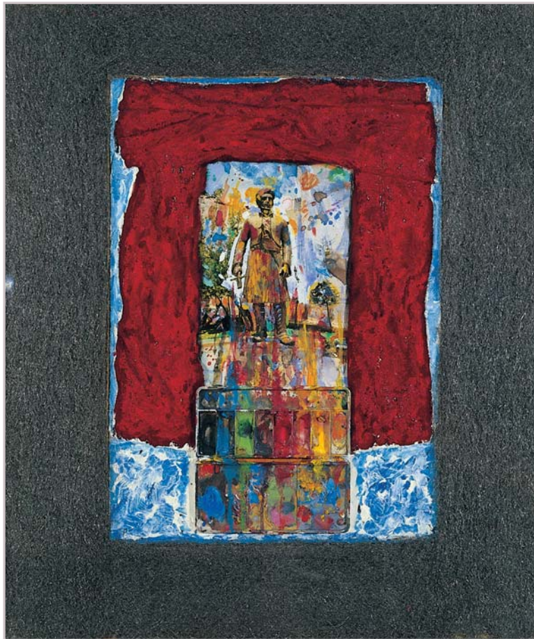
Γιάννης Ψυχοπαίδης, Το σπασμένο σπαθί του Μακρυγιάννη

χρέος πρώτα να 'ρευνήσετε διά την διαγωγή μου, πώς φέρθηκα εις την κοινωνία και Αγώνα, και αν τιμίως φέρθηκα, βάλετε βάση και εις τα γραφόμενά μου· αν ατίμως φέρθηκα, μην πιστεύετε τίποτας. Και αφού μάθετε ότι φέρθηκα τιμίως και ιδείτε σημειωμένα έγγραφα και απόδειξεις, αρχή και τέλος, από διαφόρους, από κυβερνήσες και από αρχές και από άλλους πολλούς, όθεν χρημάτισα* εγώ με τους αδελφούς μου συναγωνιστάς, οπού μ' αξίωσε ο Θεός να έχω εις την οδηγίαν μου, όλο καλύτερούς μου εις τον αγώνα και εις υπηρεσίες, όθεν διατάχτηκα. [...]