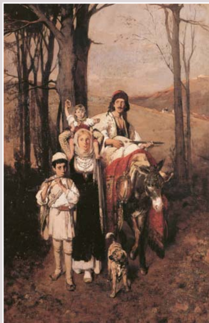
Νικηφόρος Λύτρας, Επιστροφή από το πανηγύρι

Περισσότερες πληροφορίες για τα δημοτικά τραγούδια, όπως και για τις επόμενες ενότητες των Κεμένων Νεοελληνικής Λογοτεχνίας της Γ' Γυμνασίου, θα βρείτε στα αντίστοιχα κεφάλαια του βιβλίου Ιστορία της Νεοελληνικής Λογοτεχνίας του Γυμνασίου.