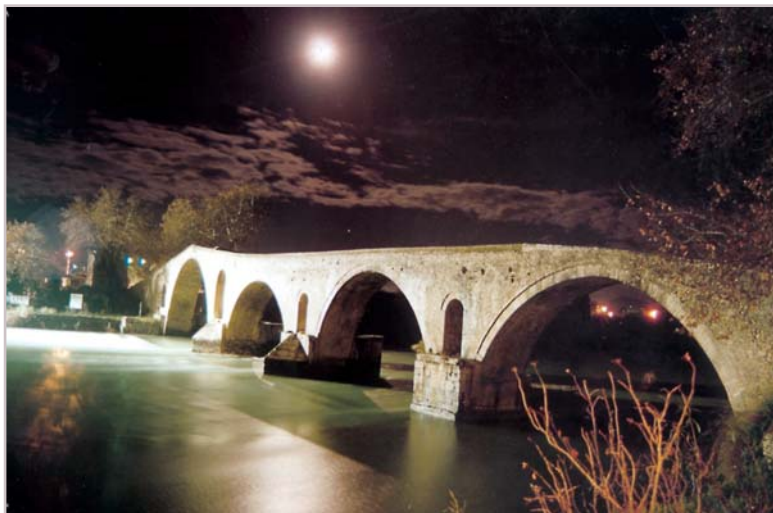
Το γεφύρι της Άρτας