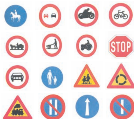
Εικ. 4.17 Τα σήματα με κόκκινο κύκλο είναι απαγορευτικά, ενώ τα σήματα με τριγωνική μορφή αναγγέλλουν κίνδυνο

Στη χώρα μας συμβαίνουν πολλά ατυχήματα σε παιδιά, εφήβους και νέους που οδηγούν μοτοσικλέτες και μοτοποδήλατα (δίκυκλα). Τα δίκυκλα είναι επικίνδυνα, διότι ο οδηγός είναι περισσότερο εκτεθειμένος στον κίνδυνο. Οι νέοι θα πρέπει να είναι ιδιαίτερα προσεκτικοί κατά την οδήγηση δικύκλων και να τηρούν αυστηρά τα σήματα οδικής κυκλοφορίας.