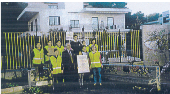
Εικ. 4.16 Πρόγραμμα Αγωγής Υγείας

Σύμφωνα με μελέτες, οι αιτίες που προκαλούν τα τροχαία ατυχήματα είναι: η υπερβολική ταχύτητα, η κατανάλωση αλκοόλ, η κούραση των οδηγών, η απροσεξία των πεζών, η παράβαση του Κώδικα Οδικής Κυκλοφορίας (Κ.Ο.Κ.), οι αφύλακτες διαβάσεις και το κακό οδικό δίκτυο, η κακή σήμανση, η μη χρήση ζώνης, η έλλειψη αερόσακου και η ριψοκίνδυνη συμπεριφορά των νέων.