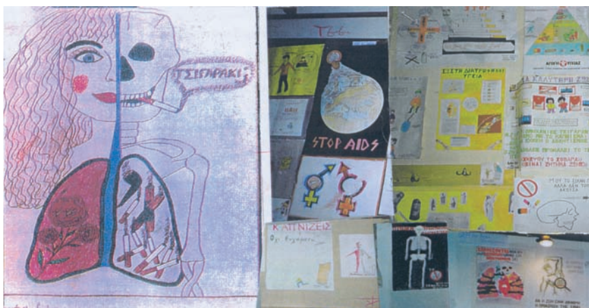
Εικ. 4.7 Το μήνυμα των νέων

Οι σημαντικότεροι παράγοντες που οδηγούν τους νέους στο να αρχίσουν το κάπνισμα είναι: τα αυξημένα οικογενειακά και κοινωνικά προβλήματα, ο σύγχρονος τρόπος ζωής, η περιέργεια και η μίμηση, η διαφήμιση, η έλλειψη ενημέρωσης, η έλλειψη προσωπικών ενδιαφερόντων κ.ά. Η κάλυψη του ελεύθερου χρόνου με τον αθλητισμό, τη ζωγραφική, τη συμμετοχή σε πολιτιστικούς συλλόγους, περιβαλλοντικά προγράμματα, προγράμματα Αγωγής Υγείας κ.ά. μπορούν να βοηθήσουν τον έφηβο να αποκτήσει υγιείς και δημιουργικές συνήθειες. Η καλύτερη πρόληψη είναι η ενημέρωση και η αντικαπνιστική αγωγή των νέων από μικρή ηλικία, τόσο από την οικογένεια, όσο και από το σχολείο, την κοινότητα και τους ειδικούς.