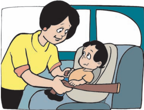
Εικ. 4.15 Ζώνη ασφαλείας εκτός από τον οδηγό θα πρέπει να φορούν και οι συνεπιβάτες στα πίσω καθίσματα

Τα ατυχήματα είναι η κυριότερη αιτία θανάτου, συνήθως σε άτομα ηλικίας έως 45 ετών. Καθημερινά διαπιστώνεται ότι πολλοί άνθρωποι χάνουν τη ζωή τους σε κάποιο ατύχημα, είτε τροχαίο, είτε αεροπορικό, είτε σιδηροδρομικό, είτε θαλάσσιο.