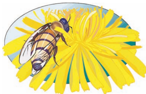
Εικ. 4.14 Τους καλοκαιρινούς κυρίως μήνες παρατηρείται αύξηση τσιμπημάτων από έντομα

Στη χώρα μας δηλητηριώδη φίδια είναι συνήθως η οχιά και ο αστρίτης. Το δάγκωμα της οχιάς προκαλεί έντονο πόνο, πρήξιμο και μπορεί να αποβεί θανατηφόρο.