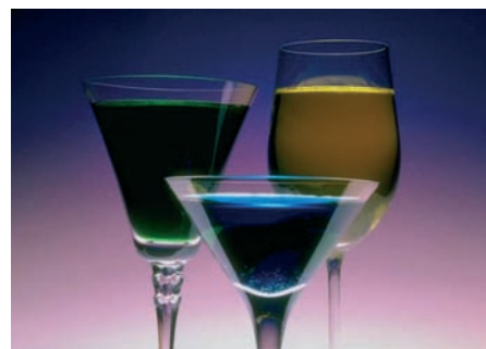
Εικ. 4.8 Προσοχή στο αλκοόλ, σκοτώνει – πάντα με μέτρο

Τα μέρη του σώματος που διατρέχουν κίνδυνο από την υπερβολική κατανάλωση αλκοόλ είναι: