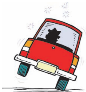
Εικ. 4.9 Η υπερβολική κατανάλωση αλκοόλ είναι αιτία των περισσότερων αυτοκινητιστικών ατυχημάτων

Το αλκοόλ συντελεί, επίσης, στην παχυσαρκία -ένα γραμμαρίο αλκοόλ δίνει 7 θερμίδες- προκαλεί διάφορες μορφές καρκίνου και νευρικές διαταραχές. Επίσης, αποτελεί αιτία των περισσότερων αυτοκινητιστικών ατυχημάτων .