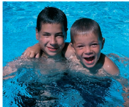
Εικ. 4.13 Το κολύμπι στην πισίνα, όπως και στη θάλασσα, απαιτεί προσοχή