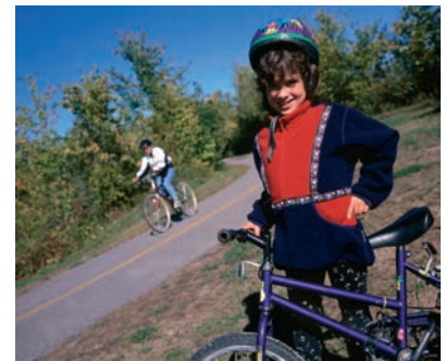
Εικ. 4.19 Για να χαιρόμαστε τα οφέλη της ποδηλασίας πρέπει να είμαστε κατάλληλα εξοπλισμένοι