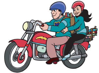
Εικ. 4.18 Απαραίτητο εφόδιο για την οδήγηση μοτοσικλέτας είναι το κράνος