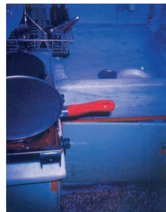
Εικ. 4.12 Οι χειρολαβές στα διάφορα σκεύη της κουζίνας πρέπει να είναι πάντοτε προς τα μέσα