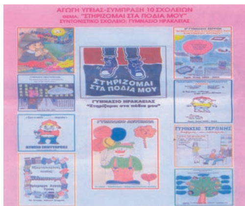
Εικ. 4.10 Δραστηριότητες Αγωγής Υγείας – «Στηρίζομαι στα Πόδια μου» (άμυνα για το κάπνισμα και το αλκοόλ)

Το αλκοόλ πρέπει να καταναλώνεται με μέτρο γιατί η υπερβολική κατανάλωση οδηγεί σε εθισμό και εξάρτηση.