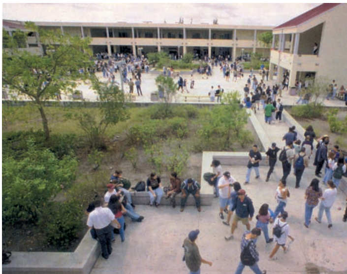
Εικ. 1.12 Το σχολείο χαρακτηρίζεται ως «μικρογραφία της κοινωνίας»

Για την καλύτερη οργάνωση και λειτουργία του σχολείου είναι απαραίτητη η τήρηση ορισμένων κανόνων και συγκεκριμένης συμπεριφοράς απ' όλα τα μέλη του σχολείου.