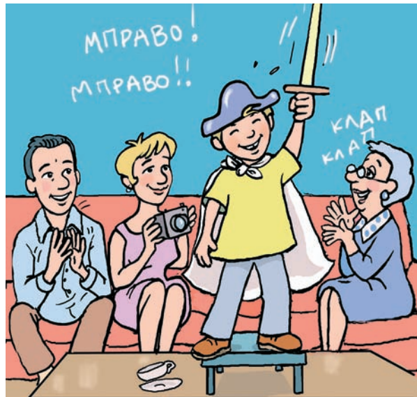
Εικ. 1.4 Η συγγένεια καλύπτει την ανάγκη του ανθρώπου για αγάπη, συντροφικότητα, συμπαράσταση και επικοινωνία