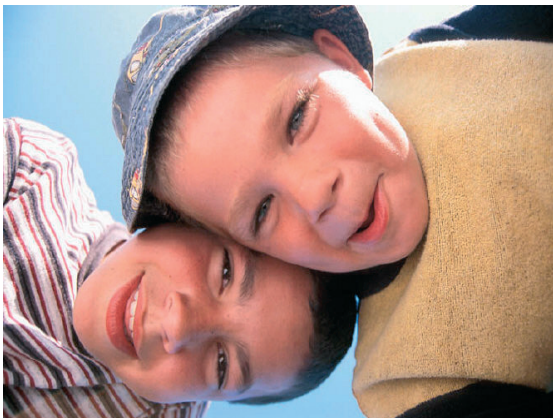
Εικ. 1.10 Τα αδέρφια από τις μεταξύ τους σχέσεις μαθαίνουν να βοηθούν και να προστατεύουν, μαθαίνουν την αφοσίωση και το συναγωνισμό

Εκτός από τους γονείς, μέσα στην οικογένεια υπάρχουν και τα αδέρφια. Από τις μεταξύ τους σχέσεις τα αδέρφια μαθαίνουν την αλληλεγγύη και το ενδιαφέρον για το συνάνθρωπο, την αφοσίωση και το συναγωνισμό.