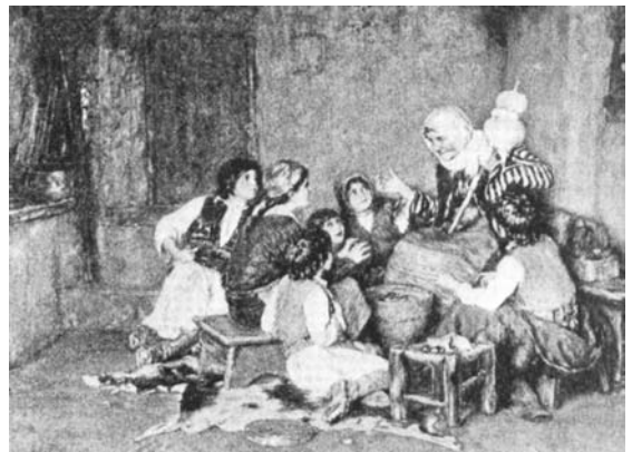
Εικ. 1.11 Το παραμύθι της γιαγιάς (έργο του Ν. Γύζη)

Για να υπάρξει ειρηνική ατμόσφαιρα μέσα στο οικογενειακό περιβάλλον, καλό είναι τα αδέρφια να συνεργάζονται, να δείχνουν κατανόηση, να βοηθούν και να παρηγορούν το ένα το άλλο σε δύσκολες στιγμές. Ειδικότερα, τα μεγαλύτερα αδέρφια θα πρέπει να δείχνουν υπομονή και ευαισθησία στα μικρότερα και να αποτελούν το καλό παράδειγμα γι' αυτά.