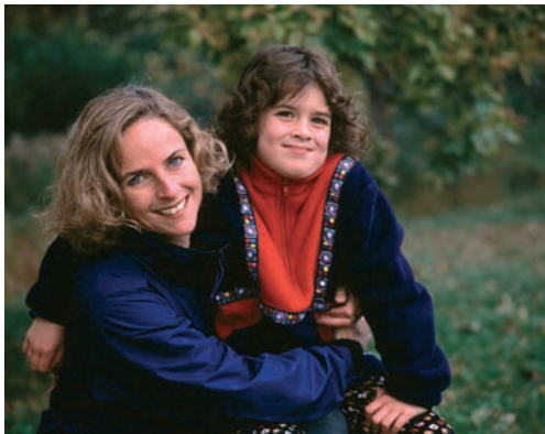
Εικ. 1.8 Η καλή και σταθερή συμπεριφορά των γονέων επιδρά θετικά στο παιδί

Η οικογενειακή αγωγή θα πρέπει να εμπνέεται από το σεβασμό στην προσωπικότητα του παιδιού και να συντελεί στην ελευθερία και στην αυτονομία του και κυρίως στην αγάπη του για το συνάνθρωπο. Τα κύρια χαρακτηριστικά της οικογενειακής αγωγής θα πρέπει να είναι: