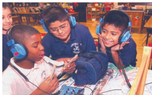
Εικ. 1.13 Η επικοινωνία κάνει τις ανθρώπινες σχέσεις πιο ευχάριστες και πιο φιλικές

Για να έχει, όμως, η επικοινωνία θετικές επιδράσεις στη ζωή του ανθρώπου πρέπει να τηρούνται ορισμένες προϋποθέσεις. Το ήπιο κλίμα , η ελευθερία έκφρασης , η ειλικρίνεια , η σαφήνεια και η καλοπροαίρετη διάθεση είναι τα βασικά στοιχεία που κάνουν την επικοινωνία αποτελεσματική.