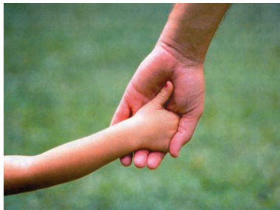
Εικ. 1.6 Καθήκον των γονέων είναι να εξασφαλίσουν στο παιδί ασφάλεια και σταθερότητα

Στις μέρες μας, όμως, ο χρόνος που αφιερώνουν οι γονείς στα παιδιά τους είναι περιορισμένος, ειδικά όταν και οι δύο γονείς εργάζονται. Αυτό είναι κάτι που δεν θα πρέπει να απογοητεύει το παιδί. Σημασία δεν έχει η ποσότητα του χρόνου που αφιερώνουν οι γονείς στα παιδιά, αλλά το πόσο δημιουργικά ασχολούνται μαζί τους.