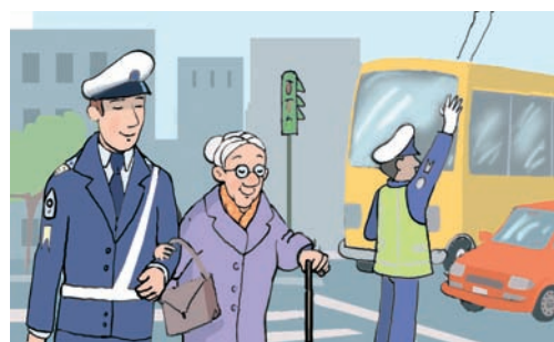
Εικ. 1.9 Η κοινότητα προσπαθεί να προσφέρει στους πολίτες της μια ήρεμη και ασφαλή ζωή