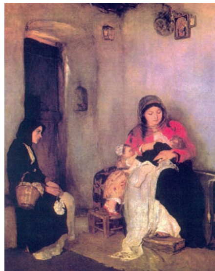
Εικ. 1.5 Η καλομάνα (έργο του Ν. Γούζη)

Κοινωνικοποίηση είναι η διαδικασία ένταξης του ατόμου στην κοινωνία.