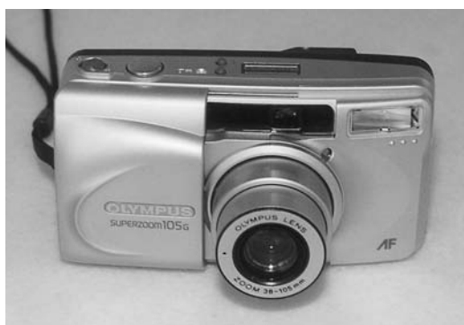
Εικόνα 8.10: Φωτογραφική μηχανή

Φωτογραφική μηχανή. Παράγει ασπρόμαυρες ή έγχρωμες φωτογραφίες. Οι μαθητές μπορούν να την αξιοποιήσουν για να δημιουργήσουν φωτογραφίες της κατασκευής τους στα διάφορα στάδια κατασκευής. Με τις φωτογραφίες αυτές μπορούν να παρουσιάσουν την εξέλιξη της κατασκευής τους. Μπορούν επίσης να δημιουργήσουν φωτογραφίες σχετικές με