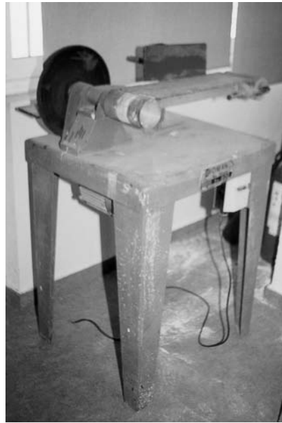
Εικόνα 9.4: Τριβείο με βάση