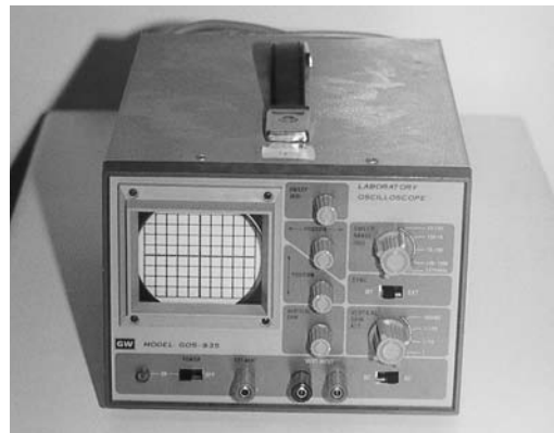
Εικόνα 9.11: Παλμογράφος

Παλμογράφος. Παρουσιάζει τη μορφή ενός ηλεκτρικού σήματος (συναρτήσεως του χρόνου). Έχει βαθμονομημένους άξονες με τη βοήθεια των οποίων μπορεί κανείς να υπολογίσει το πλάτος του σήματος και την περίοδό του.