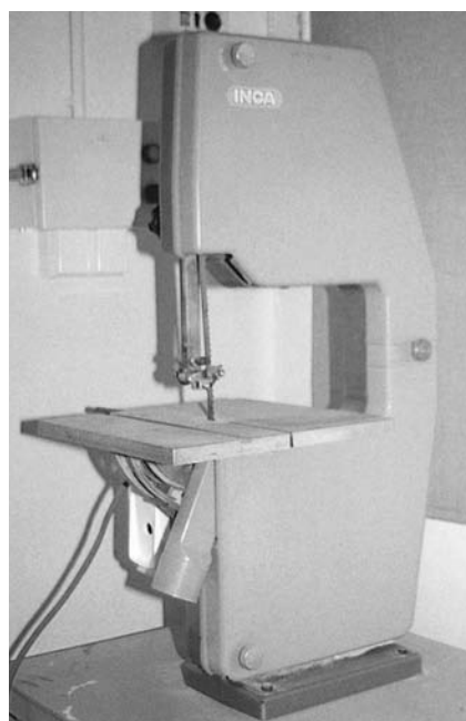
Εικόνα 9.1: Πριονοκορδέλα