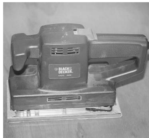
Εικόνα 9.5: Ηλεκτρικό φορητό τριβείο.