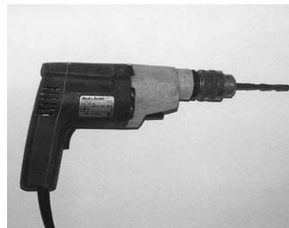
Εικόνα 9.6: Ηλεκτρικό φορητό δράπανο.