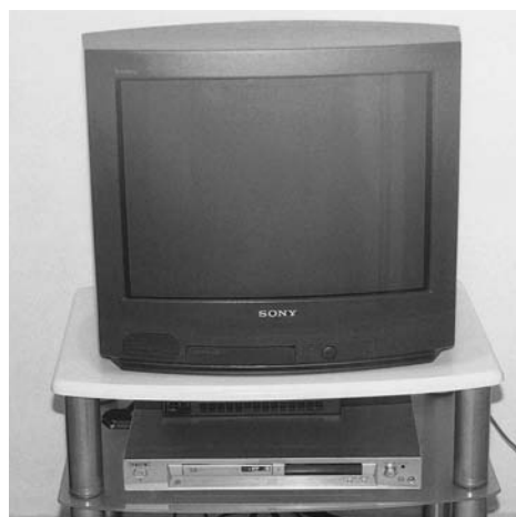
Εικόνα 8.8: Τηλεόραση και βίντεο.

Για να είναι ευκρινείς οι διαφάνειες χρησιμοποιείται σκούρο φόντο με χαρακτηρισές ανοικτού χρώματος, ή αντίστροφα. Επίσης ισχύουν οι παρατηρήσεις για τη δημιουργία των απλών διαφανειών.