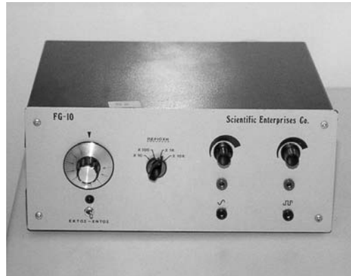
Εικόνα 9.10: Γεννήτρια σήματος.

Γεννήτρια σήματος. Είναι συσκευή που δημιουργεί μεταβαλλόμενο σήμα. Συνήθως έχει δυνατότητα επιλογής ημιτονικού, τετραγωνικού ή τριγωνικού σήματος. Επίσης ρυθμίζεται το πλάτος και η συχνότητα του σήματος.