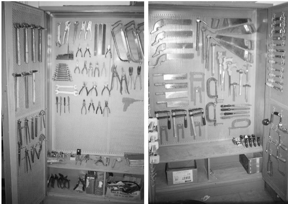
Εικόνα 8.4: Η τοποθέτηση των εργαλείων γίνεται σε ντουλάπες, όπου σημειώνεται το περίγραμμά τους.