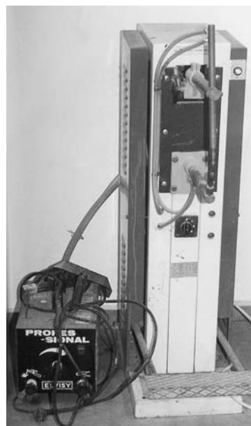
Εικόνα 9.8: Ηλεκτροπόντα και φορητή ηλεκτροσυγκόλληση.

Ηλεκτροπόντα. Χρησιμοποιείται για τη συγκόλληση δύο μεταλλικών τμημάτων. Τα δύο τμήματα πιέζονται και τα ηλεκτρόδια δημιουργούν ένα ηλεκτρικό τόξο λιώνοντας τοπικά τις δύο επιφάνειες. Στη συσκευή υπάρχουν τα κυκλώματα ηλεκτρικού ρεύματος (που προκαλεί τη τήξη και τη συγκόλληση), το κύκλωμα πεπιεσμένου αέρα (που εξασφαλίζει τη πίεση των επιφανειών) και το κύκλωμα του νερού ψύξης (που ψύχει τη συσκευή). Τα τρία αυτά κυκλώματα πρέπει να λειτουργούν καλά, ώστε να μη δημιουργούνται προβλήματα. Σε περίπτωση που θέλουμε να κολλήσουμε μικρότερες επιφάνειες μπορούμε να χρησιμοποιήσουμε μια φορητή ηλεκτροσυγκόλληση.