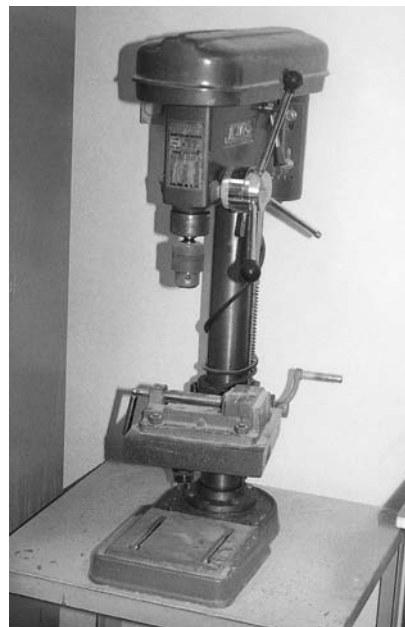
Εικόνα 9.3: Επιτραπέζιο δρόπανο.