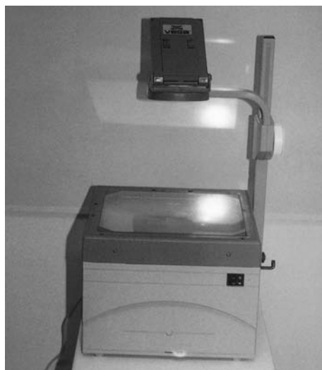
Εικόνα 8.5: Ανακλαστικός προβολέας.

Διασκόπιο. Χρησιμοποιείται για την προβολή εικόνων συνήθως έγχρωμων, όπως slides. Έχει ισχυρή λάμπα και για το λόγο αυτό συνήθως δε χρειάζεται απόλυτη συσκότιση. Τοποθετείται συνήθως μπροστά από την οθόνη προβολής πάνω σε ειδικό βάθρο και σε ύψος λίγο μεγαλύτερο από αυτό του θρανίου. Θα πρέπει να σχηματίζει μικρή γωνία με το οριζόντιο επίπεδο, ώστε η προβολή να γίνεται πάνω από τα κεφάλια των μαθητών. Η εστίαση της συσκευής γίνεται με περιστροφή του φακού προβολής. Τα slides δημιουργούνται με φωτογράφιση, χρησιμοποιώντας ειδικό φιλμ και ειδική εκτύπωση. Με αυτά μπορεί ο μαθητής να παρουσιάσει την εξέλιξη της κατασκευής του. μπορεί επίσης να παρουσιάσει εφαρμογές του θέματος που μελετά.