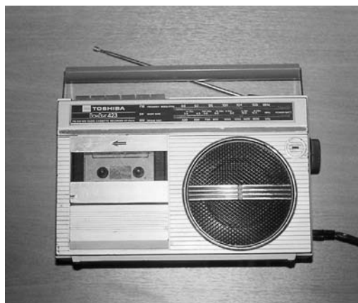
Εικόνα 8.9: Μαγνητόφωνο.

που μελετά. Μπορεί επίσης να παρουσιάσει ομιλίες, ραδιοφωνικές εκπομπές, κ.ά., σχετικά με το θέμα του. Επίσης ο καθηγητής μπορεί να καταγράφει τις παρουσιάσεις, ώστε στο τέλος των εργασιών μέσα από τις ταινίες αυτές να φαίνεται η εξέλιξη των εργασιών, αλλά και η διαφοροποίηση των μαθητών ως προς την αντιμετώπιση των προβλημάτων που τους παρουσιάστηκαν. Στο εργαστήριο θα πρέπει να υπάρχει και ένα μικρό (δημοσιογραφικό) κασετόφωνο που θα το χρησιμοποιούν οι μαθητές στις συζητήσεις με ειδικούς.