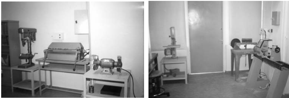
Εικόνα 8.2: Στο γενικό εργαστήριο της Τεχνολογίας οι επιμέρους εργαστηριακοί χώροι θα πρέπει να είναι διακριτοί.

Κατά τη δημιουργία ενός εργαστηρίου πρέπει τα μηχανήματα να τοποθετούνται με τέτοιο τρόπο, ώστε οι χώροι των επιμέρους εργαστηρίων να είναι διακριτοί. Έτσι π.χ. τα μηχανήματα κατεργασίας ξύλου θα πρέπει να είναι συγκεντρωμένα μαζί, ενώ δίπλα θα πρέπει να βρίσκεται και η ντουλάπα που θα περιέχει τα σχετικά εργαλεία. Με τον τρόπο αυτό ελαχιστοποιούνται οι μετακινήσεις των μαθητών μέσα