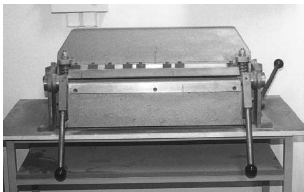
Εικόνα 9.7: Στράντζα χειρός.

4 Ανασηκώνουμε το μοχλό κάμψης, πετυχαίνουμε να διπλώσει η λαμαρίνα στη γωνία που θέλουμε.