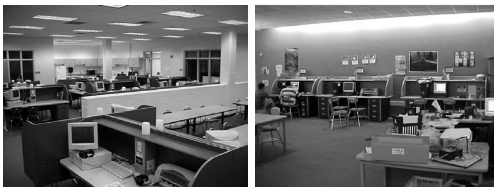
Εικόνα 8.1: Σύγχρονα εργαστήρια τεχνολογίας

Είναι το εργαστήριο που δίνει στους μαθητές τη δυνατότητα να ασχοληθούν με πολλούς τομείς της σύγχρονης τεχνολογίας. Μπορούμε να πούμε ότι είναι σύνθεση πολλών εργαστηρίων μιας μονάδας. Στο εργαστήριο αυτό οι μαθητές μπορούν να υλοποιήσουν τις κατασκευές που επιθυμούν αναπτύσσοντας έτσι τις δεξιότητες και τις κλίσεις τους. Μπορούν επίσης να δημιουργήσουν κατασκευές που να αποτελούνται από διάφορα υλικά. Με τον τρόπο αυτό η μέθοδος της Ατομικής Εργασίας μπορεί να υλοποιείται με όσο γίνεται καλύτερα αποτελέσματα. Ένα γενικό εργαστήριο εκπληρώνει τους σκοπούς που τέθηκαν στην αρχή του κεφαλαίου.