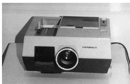
Εικόνα 8.6: Διασκόπιο