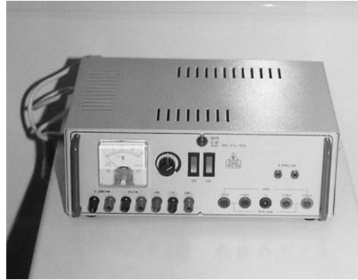
Εικόνα 9.9: Τροφοδοτικό.

Τροφοδοτικό. Δημιουργεί συνεχή τάση μεταβλητής τιμής. Χρειάζεται προσοχή κατά τη χρήση να μην ακουμπήσουν οι δύο ακροδέκτες. Αυτό έχει σαν αποτέλεσμα να βραχυκυκλώνεται η συσκευή και να καίγεται η ασφάλειά της. Η αλλαγή ασφάλειας είναι εύκολη, αφού η ασφαλειοθήκη είναι εξωτερική (στη πρόσοψη ή στο πίσω μέρος της συσκευής). Ο κόκκινος ακροδέκτης να συνδέεται στο θετικό πόλο της εξόδου και το μαύρο στον αρνητικό.