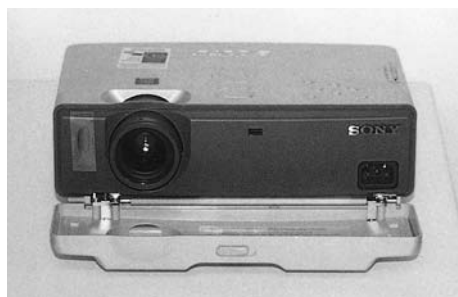
Εικόνα 8.7: Ηλεκτρονικός προβολέας πολυμέσων.

Ηλεκτρονικός προβολέας πολυμέσων. Συνδέεται σε Η/Υ και προβάλλει την εικόνα της οθόνης σε οθόνη προβολής (ή σε μια λευκή επίπεδη επιφάνεια του εργαστηρίου). Η σύνδεση της συσκευής γίνεται στη θύρα του υπολογιστή που συνδέεται η οθόνη. Η εστίαση γίνεται με περιστροφή του φακού. Όπως και ο απλός προβολέας δεν πρέπει να μετακινείται όσο είναι σε λειτουργία ή δεν έχει κρυώσει αρκετά (το καταλαβαίνουμε από το γεγονός ότι δουλεύει ο ανεμιστήρας) γιατί μπορεί να καεί η λάμπα προβολής.