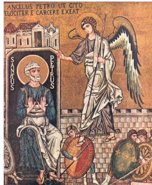
Θαυματουργική απελευθέρωση του Αποστόλου Πέτρου από τη φυλακή του Ηρώδη. Μωσαικό, Καπέλα Παλατίνα, Σικελία, 12ος αι.

Αυτό δεν φόβισε τους Αποστόλους που συνέχισαν το κήρυγμά τους και τα θαύματα, με αποτέλεσμα να οδηγηθούν πάλι στη φυλακή. Με θαυματουργό, όμως, τρόπο οι Απόστολοι απελευθερώθηκαν και συνέχισαν το έργο τους. Την επόμενη μέρα η φρουρά τους έφερε ξανά στο Συνέδριο. Οι Απόστολοι με παρηρησία διακήρυξαν την Ανάσταση του Χριστού και τόνισαν: «Πιο πολύ πρέπει να υπακούμε στο Θεό παρά στους ανθρώπους» (Πράξ. 5,29). Τα μέλη του Συνεδρίου, όταν τα άκουσαν αυτά, έγιναν έξαλλα και θα θανάτωναν τους Αποστόλους, αν δεν παρενέβαινε ένας νομοδιδάσκαλος, ο Γαμαλιήλ, λέγοντας για τους Αποστόλους: «Αν αυτό που σκέπτονται ή αυτό που κάνουν προέρχεται από ανθρώπινη δύναμη, θα διαλυθεί μόνο του. Αν όμως προέρχεται από το Θεό, δε θα μπορέσετε να το διαλύσετε, για να μην πω ότι μπορεί να βρεθείτε τελικά και θεομάχοι» (Πράξ. 5,38-39). Μετά από αυτά τα λόγια οι Απόστολοι, αφού μαστιγώθηκαν και απειλήθηκαν, αφέθηκαν ελεύθεροι.