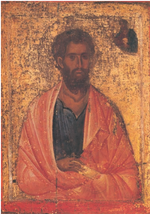
Ο άγιος Ιάκωβος ο Αδελφόθεος. Μονή Αγίου Ιωάννου, Πάτμος.

«Αλήθεια, τώρα καταλαβαίνω ότι ο Θεός δεν κάνει διακρίσεις, αλλά δέχεται τον καθένα, σ' όποιον λαό κι αν ανήκει, αρκεί να τον σέβεται και να ζει σύμφωνα με το θέλημά του».