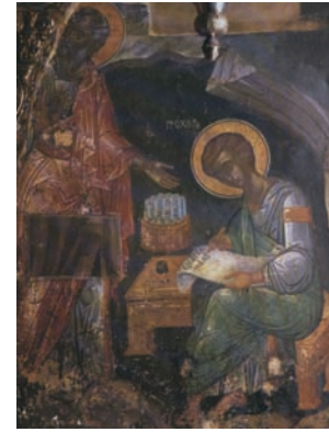
Ιερά Μονή της Πάτμου. Ο άγιος Ιωάννης υπαγορεύει την Αποκάλυψη στο διάκονο Πρόχορο.

θούν αυτοί με τη διακονία των τραπεζών της αγάπης, ώστε εκείνοι να αφοσιωθούν απερίσπαστοι στο κήρυγμα. Πράγματι, η Εκκλησία εξέλεξε επτά άνδρες και οι Απόστολοι τούς χορήγησαν το Άγιο Πνεύμα. Αυτοί οι επτά ονομάστηκαν Διάκονοι, γιατί το έργο τους ήταν η ανιδιοτελής προσφορά υπηρεσιών στην Εκκλησία. Όλοι είχαν ελληνικά ονόματα (Στέφανος, Φίλιππος, Πρόχορος, Νικάνορας, Τίμωνας, Παρμενίωνας, Νικόλαος). Το γεγονός αυτό αποδεικνύει την όλο και μεγαλύτερη επιρροή του ελληνορωμαϊκού πολιτισμού μέσα στην Εκκλησία και διευκόλυνε, όπως θα δούμε στη συνέχεια, το άνοιγμά της στον εθνικό κόσμο. Οι Διάκονοι, στη συνέχεια, ανέλαβαν τη σημαντική υπηρεσία που τους είχε ανατεθεί. Γρήγορα όμως, επειδή η ανάγκη ήταν μεγάλη, συνέδραμαν τους Αποστόλους στο κήρυγμα σε περιοχές έξω από το στενό πλαίσιο της Παλαιστίνης. Έτσι, με κόπο, θυσίες και μαρτύρια ο λόγος του Θεού διαδόθηκε, όπως θα δούμε στις επόμενες ενότητες, σε όλους τους λαούς.