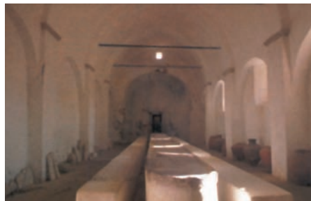
Τράπεζα στη Νέα Μονή της Χίου. Μπορούμε να φανταστούμε ότι σε ανάλογους χώρους τελούσαν οι πρώτοι χριστιανοί τις «Αγάπες».

Από μέρους των ελληνιστών έγιναν παράπονα ότι κατά την καθημερινή διανομή των τροφίμων παραμελούνταν οι χήρες τους. Οι Απόστολοι, αφού συγκέντρωσαν όλους τους μαθητές, τους παρότρυναν να εκλέξουν επτά άνδρες με καλή φήμη και γεμάτους σοφία, για να ασχολη-