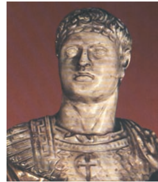
Μ. Κωνσταντίνος Προτομή των αρχών του 4ου αι. Παρίσι. Εθν. Βιβλιοθήκη.