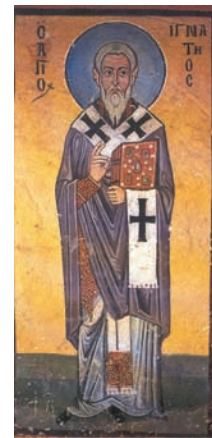
Αγ. Ιγνάτιος, Όσιος Λουκάς Βοιωτίας.

Βρισκόμαστε στα πρώτα 100 χρόνια μετά το Χριστό και ήδη έχουν αρχίσει οι διωγμοί των χριστιανών. Το αυταρχικό ρωμαϊκό κράτος θανατώνει τους χριστιανούς που αρνούνται να λατρεύουν τον αυτοκράτορα ως θεό. Στο διωγμό του αυτοκράτορα Τραϊανού ο Ιγνάτιος συλλαμβάνεται και καταδικάζεται να θανατωθεί στο Κολοσσαίο της Ρώμης. Οδηγείται δεσμιος μαζί με άλλους χριστιανούς στη Ρώμη. Στη μαρτυρική του πορεία από την Αντιόχεια προς τη Ρώμη, ένα μακρύ δρόμο από την Ασία στην καρδιά της Ευρώπης, διέρχεται από πολλές πόλεις. Στην πορεία προς τη θυσία γράφει επιστολές προς τους χριστιανούς αυτών των πόλεων, νοθετώντας τους σε θέματα πίστης. Καταλήγει το 107 μ.Χ. στο Κολοσσαίο, όπου γίνεται βορά των άγριων θηρίων. Τα οστά του μεταφέρθηκαν στην Αντιόχεια και εναποτέθηκαν σε κοιμητήριο κοντά στο προάστιο της Δάφνης. Τη μνήμη του αγίου Ιγνατίου του Θεοφόρου τιμά η Ορθόδοξη Εκκλησία στις 20 Δεκεμβρίου και η Ρωμαιοκαθολική την 1η Φεβρουαρίου.