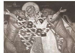
Μαρτύριο αγίου Ιγνατίου του Θεοφόρου, I.M. Ξενοφάντος Αγ. Όρος.

Στις επιστολές του, ακόμη, ο άγιος Ιγνάτιος νουθετεί και τονίζει τη σημασία της πίστης, της αγάπης και των καλών έργων. Ο αληθινός πιστός, κατά τον άγιο Ιγνάτιο, διακατέχεται από το αίσθημα της δικαιοσύνης και της ισότητας απέναντι σε κάθε άνθρωπο. Όλοι οι άνθρωποι είναι αδέρφια και συναθλητές στον αγώνα της ζωής. Ο άγιος Ιγνάτιος θεμελιώνει τη χριστιανική κοινωνικότητα πάνω στην αγάπη, στην υπομονή, στην πραότητα και στην αλληλεγγύη. Σημειώνει: « Ο χριστιανός δεν έχει διάλειμμα για τον εαυτό του, αλλά είναι πάντα στην υπηρεσία του Θεού » (Πολυκ. VI, 3).