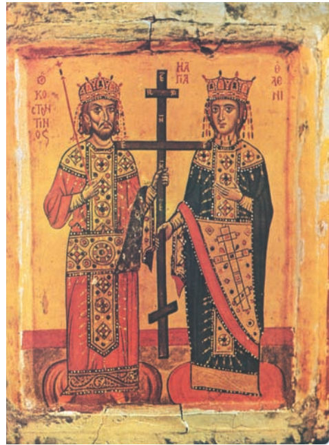
Οι άγιοι Κωνσταντίνος και Ελένη 12ος-13ος αι. Ι.Μ. Αγ. Αικατερίνης Σινά.