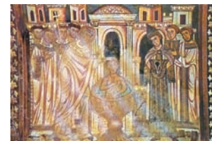
Νωπογραφία του 13ου αι. Ο αγ. Σιλβέστρος βαπτίζει τον Μ. Κωνσταντίνο.