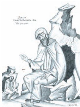
Μοναχός επισκέπτεται τον άγ. Αντώνιο. Έργο του Γ. Κόρδη

Οι πρώτοι χριστιανοί που απομακρύνθηκαν από τον κόσμο τον 3ο μ.Χ. αιώνα και αναζήτησαν την ησυχία , δηλαδή την αφιέρωση στο Θεό μέσα στη μοναχική ζωή και τη γαλήνη της αδιάλειπτης (συνεχούς) προσευχής στην ερημιά, ονομάζονται αναχωρητές . Κύριος εκπρόσωπος και σύμβολο του αναχωρητισμού στην έρημο της Αιγύπτου είναι ο Μέγας Αντώνιος (251-355 μ.Χ.). Οι αναχωρητές μοναχοί ζούσαν απομονωμένοι ο ένας από τον άλλο, εργάζονταν ατομικά και συγκεντρώνονταν όλοι μαζί μόνο για τη Θεία Λατρεία και για την κοινή προσευχή. Αρνούνταν την κοσμική ζωή, τα υλικά αγαθά και τις απολαύσεις.