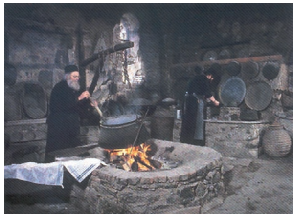
Μαγειρείο του Μεγάλου Μετεώρου.

Αλλά και ο λαϊκός χριστιανός, ο ασκητής στην καθημερινή κοινωνική δράση, έχει να αντιμετωπίσει όλες τις δυσκολίες και τις ευθύνες της σύγχρονης ζωής. Οικογένεια, εργασία, κοινωνικές σχέσεις απαιτούν ετοιμότητα και σταθερότητα στις αρχές της χριστιανικής ζωής. Ο αγώνας είναι αδιάκοπος και γι' αυτό πρέπει να είναι συνεχής και η αμοιβαία συμπαράσταση μεταξύ των χριστιανών, είτε αυτοί είναι σύζυγοι είτε είναι φίλοι είτε συνεργάτες.