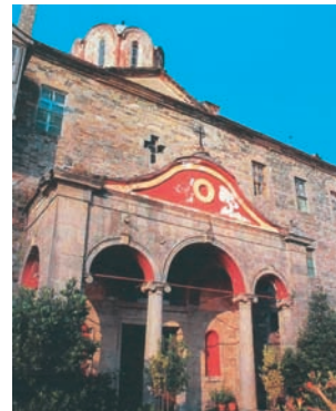
Καθολικό Ιεράς Μονής Κουτλουμουσίου, Αγίου Όρους.

Στο μοναχισμό, αν και έχουμε μια απομάκρυνση από τα εγκόσμια, το ενδιαφέρον για τον άνθρωπο παραμένει ζωντανό και μάλιστα παρουσιάζεται ενδυναμωμένο. Ο μοναχισμός αγωνίζεται εναντίον της πλεονεξίας, του ατομικισμού και της ιδιοτέλειας. Ο ασκητής στηρίζει πνευματικά και ηθικά τον άνθρωπο που ζει μέσα στον κόσμο, προκειμένου να αντέξει τις δυσκολίες και να διατηρήσει ακμαίο το χριστιανικό του φρόνημα. Γι' αυτό και τα μοναστήρια είναι τόποι πνευματικής ζωής για τους ανθρώπους και οι μοναχοί πνευματικοί πατέρες των ανθρώπων που καταφεύγουν σε αυτούς. Σε πολλά μοναστήρια στο παρελθόν υπήρχαν νοσοκομεία, γηροκομεία, σχολεία και καταλύματα για τους ανθρώπους που βίωναν τον πόνο, την εγκατάλειψη ή την ορφάνια. Οι μονές αποτελούσαν το άσυλο των καταδιωγμένων, το σπίτι των φτωχών, το καταφύγιο των επαναστατημένων απέναντι στον κατακτητή, το εργαστήριο