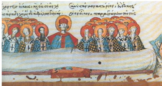
Η Δ' Οικουμενική Σύνοδος, από χειρόγραφο της Ιεράς Μονής Βατοπεδίου Αγίου Όρους.

Οι σύνοδοι που αντιμετωπίζουν τρέχοντα ζητήματα των τοπικών Εκκλησιών συγκροτούνται από τους επισκόπους των Εκκλησιών αυτών και ονομάζονται τοπικές . Όταν τα προβλήματα που αντιμετωπίζει η Εκκλησία αφορούν μια ολόκληρη επαρχία, τότε συγκροτείται σύνοδος των επισκόπων της επαρχίας αυτής και η σύνοδος ονομάζεται επαρχιακή .