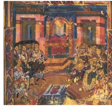
Παράσταση από τη Β' Οικουμενική Σύνοδο, χειρόγραφο Εθνικής Βιβλιοθήκης, Παρίσι.

Τον 5ο μ.Χ. αιώνα οι Σύνοδοι είχαν ήδη αναγνωριστεί ως θεσμός από το εκκλησιαστικό σώμα. Έτσι η Εκκλησία, για να αντιμετωπίσει τις αιρέσεις του Νεστοριανισμού και του Μονοφυσιτισμού, συγκάλεσε δύο Οικουμενικές Συνόδους: την Γ' στην Έφεσο της Μικράς Ασίας (431 μ.Χ.) για το Νεστοριανισμό και τη Δ' στη Χαλκηδόνα, προάστιο της Κωνσταντινούπολης στην ασιατική ακτή της Προποντίδας (451 μ.Χ.), για το Μονοφυσιτισμό.