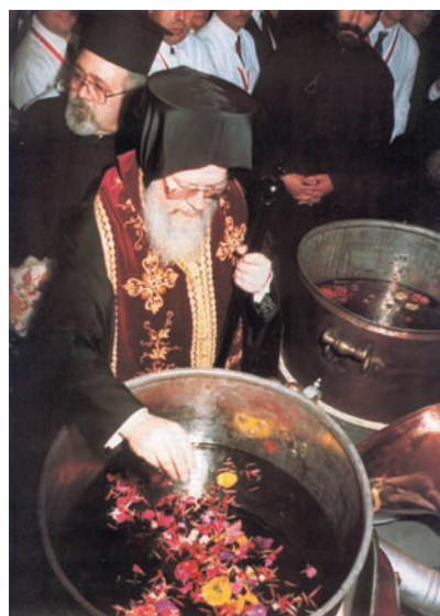
Παρασκευή αγίου Μύρον από τον Πατριάρχη Κωνσταντινουπόλεως.