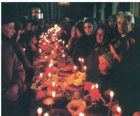
Πασχαλινό τραπέζι στη Ρωσία.