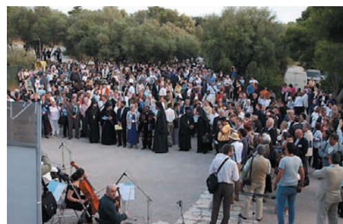
Από το ιεραποστολικό συνέδριο του Π.Σ.Ε. που έγινε στην Αθήνα το 2005.