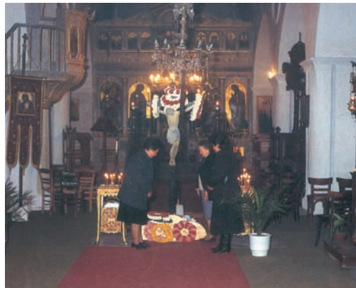
Εσταυρωμένος (Μ. Πέμπτη).

Όλοι οι ορθόδοξοι αισθάνονται την ανάγκη να επικοινωνήσουν μεταξύ τους, να αλληλοβοηθηθούν και να ανταλλάξουν απόψεις για την παρουσία της Ορθοδοξίας στο σύγχρονο κόσμο. Υπάρχουν, επίσης, θέματα για τα οποία θα πρέπει να ληφθούν κάποιες απο-