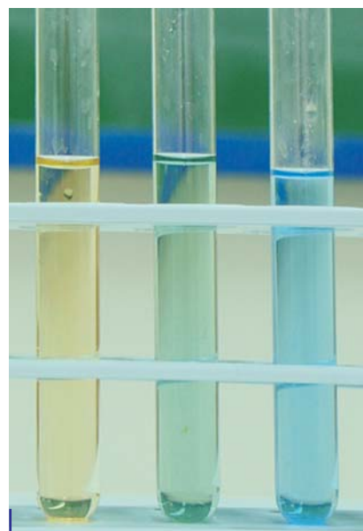
Το χρώμα του δείκτη μπλε της βρομοθυμόλης σε όξινο, ουδέτερο και αλκαλικό περιβάλλον αντίστοιχα

Πρακτικά η τιμή του pH ενός βασικού διαλύματος είναι μεταξύ του 7 και του 14.