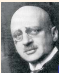
Ο Haber, μετά τη βιομηχανική εφαρμογή της μεθόδου του, έγινε πάμπλουτος, του απονεμήθηκε τίτλος ευγενείας και το 1918 πήρε το βραβείο Nobel.

Η διατροφή του ανθρώπινου πληθυσμού εξασφαλίστηκε χάρη στην «πράσινη επανάσταση», δηλαδή χάρη στη μεγάλη αύξηση της φυτικής παραγωγής. Το δρόμο για την «πράσινη επανάσταση» άνοιξε η βιομηχανική σύνθεση της αμμωνίας, αφού αυτή είναι απαραίτητη για την παραγωγή των αζωτούχων λιπασμάτων.