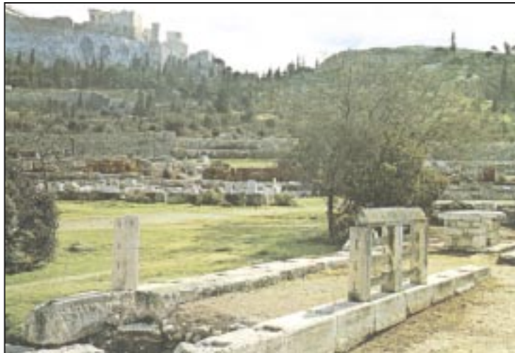
Το μνημείο των επωνύμων ηρώων στην Αρχαία Αγορά. Βλ. Όρν. 486 και σχόλιο. [Εκδοτική Αθ.]