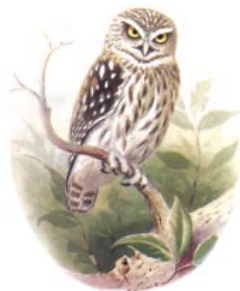
Κουκουδάγια, Athene noctua (Όρν. 331-2). [EOE]

297 τοροτίξ τοροτίξ: Ξαναπροσπαθεί ο Τσα.· τούτη τη φορά έχει θετικό αποτέλεσμα η προσπάθειά του. Εμφανίζονται τέσσερα πουλιά. Αυτά όμως θα αποδειχθεί μετά από λίγο ότι δεν ανήκουν στο χορό. Ίσως μάλιστα, για να αυξήσει ο ποιητής την απορία των θεατών του διαψεύδοντας αυτό που προσδοκούσαν, να μη παρουσιάστηκαν από 'κει που κατά πάγια συνήθεια εισερχόταν ο χορός, από τις δύο παρόδους, αλλά να εμφανίστηκαν στην οροφή του σκηνικού οικοδομήματος.