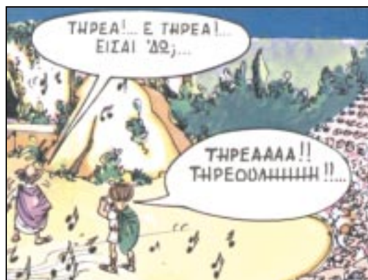
«Πηγαίνουμε να δρούμε τον Τηρέα» (Ορν. 49). [Κώμος]

83-6 τρέχω... τρέχω... τρεχαντήρι: Στο πρωτότυπο υπάρχει το ίδιο λογοπαίγνιο· κι εκεί γίνεται χρήση τού ίδιου ρήματος (τρέχω), το πουλί λεγόταν τροχίλος , κάποιο είδος υδρόδιου. Τον ποιητή δεν ενδιαφέρει εδώ το είδος, αλλά το όνομα για χάρη του λογοπαιγνίου.