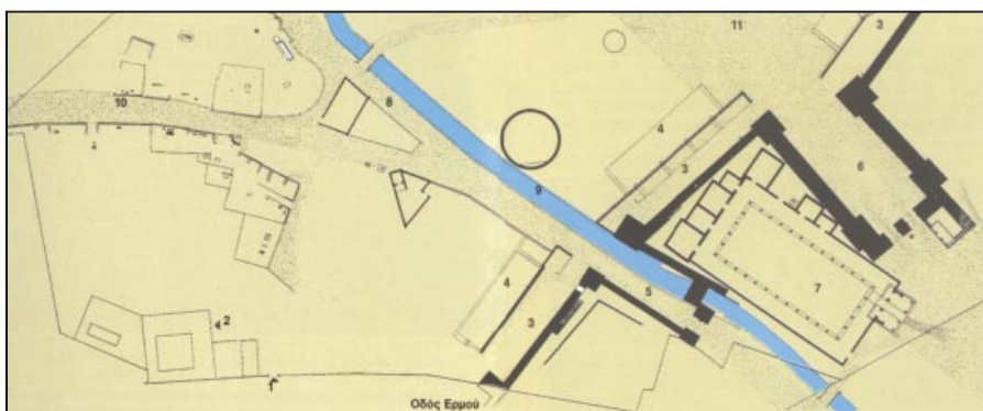
Κάτοψη του αρχαιολογικού χώρου του Κεραμεικού. (Ὀρν. 428) [Κέδρος]

434-8 τραδηχτείτε... σκοπός τους: Όσο ήταν έκδηλη η επιθετική διάθεση των πουλιών προς τους δύο ανθρώπους-επισκέπτες τους, δεν επικρατούσε τάξη στις τάξεις τους. Τώρα ο κορυφαίος τα προτρέπει να συνταχθούν, να αποθέσουν τα ...όπλα τους. Οι δύο αντιτιθέμενοι οδηγούνται σε ηρεμότερη αντιπαράθεση. Ο αγώνας των έργων, η εριστική σκηνή, έχει ήδη ολοκληρωθεί (στ. 355-433).