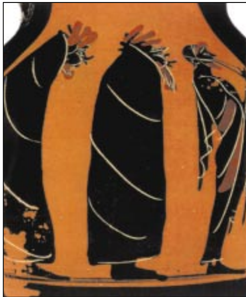
Χορός μεταμφιεσμένων σε πετεινούς (6ος π.Χ. αι., Βερολίνο). [Εκδοτική Αθ.]