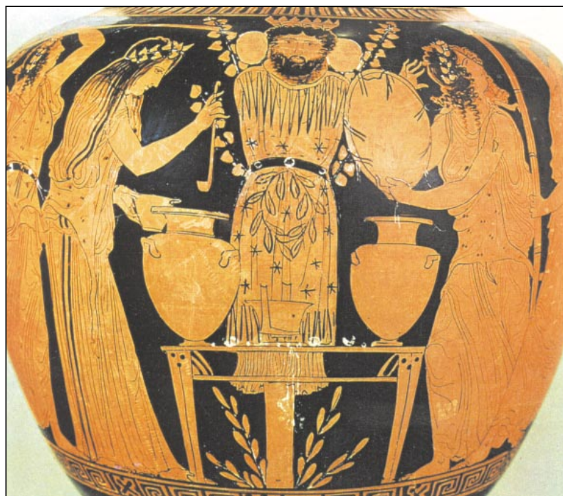
Σκηνή από τα Λήναια. Μαινάδες σε κατάσταση έκστασης χορεύουν μπροστά σε ομοίωμα του θεού Διονύσου. Μπροστά από το ομοίωμα τράπεζα προσφορών (5ος π.Χ. αι., Νεάπολη). [Εκδοτική Αθ.]

211-13 [μέσ' απ' το χάος... γι αυτούς]: περιεχόμενο στίχου που δεν ανήκει στον Αριστοφάνη, αλλά μας παραδόθηκε μαζί με το υπόλοιπο κείμενο της κωμωδίας.