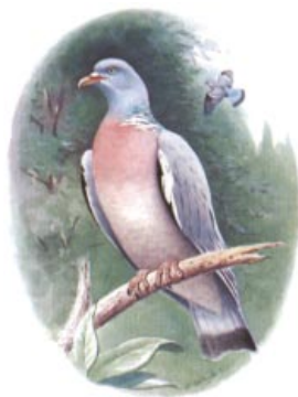
Φάσσα (Όρν. 336). [ΕΟΕ]

137-43 μια που οι μεγάλες μου έγνοιες...δε θέλω να πατήσεις: Πρόκειται για επιθυμίες που δεν έχουν σχέση με την πραγματικότητα, που είναι αντίθετες από την πραγματικότητα. σε καλώ · η φράση θύμιζε πρόσκληση σε δικαστήριο· μόνο με την αμέσως επόμενη φράση καταλαβαίνουν οι θεατές ότι πρόκειται για εντελώς άλλου είδους πρόσκληση.