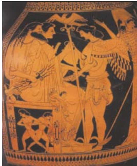
Ο Δίας με την Ήρα στο θρόνο του, κρατώντας σκήπτρο με αετό και τον κεραυνό. Μπροστά τους η θεά Ίρις, δεξιά η Αθηνά· περ. 500 π.Χ., Μόναχο ( Ορν. 546-51). [Εκδοτική Αθ.]

625 και σε πουν Κρόνο, Γη, Ποσειδών: Μπορεί ο Κρόνος να είχε εκθρονιστεί από το Δία, το όνομά του όμως ήταν στην αρχαιότητα συνδεδεμένο με τα παλιά καλά χρόνια, τη χρυσή εποχή, την ευτυχία, την αντάρχεια. Δες στο συνοδευτικό κείμενο 13 πώς περιγράφει ο Ησίοδος στα Έργα την εποχή της βασιλείας του Κρόνου.