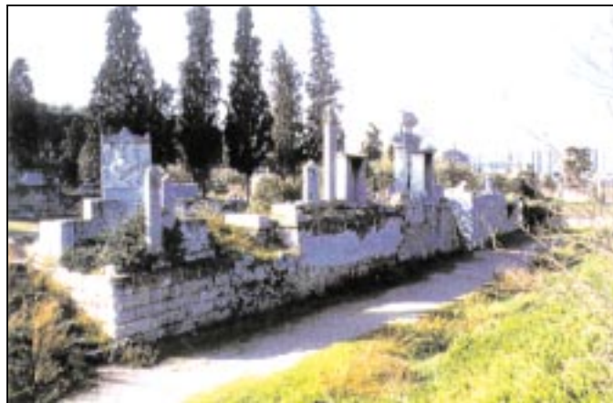
Κεραμεικός. Ταφική οδός, (Ορν. 428). [Κέδρος]