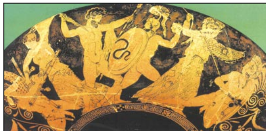
Σκηνή Γιγαντομαχίας. Δεξιά η Αθηνά μάχεται στο πλευρό του πατέρα της. Στη μέση ο Δίας κραδαίνει τον κεραυνό κατά του Πορφυρίωνα. Αριστερά η Άρτεμις. 5ος π.Χ. αι., Βερολίνο (Όρν. 592 και σχόλιο). [Εκδοτική Αθ.]

607-8 κι αν στο Δία... κούνουπας πρώτα: Το βαρδάκι είναι είδος γερακιού· το χρησιμοποιεί ο μεταφραστής για να δημιουργήσει λογοπαίγνιο με το επίθετο βαρδάτος (=αρρενωπός), ανάλογο με αυτό που υπάρχει στο αρχαίο κείμενο.