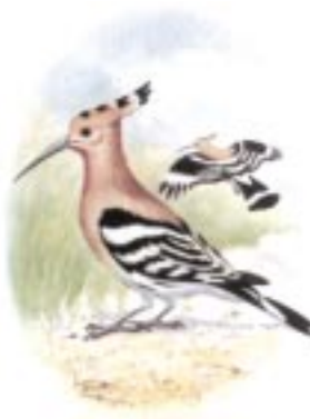
«Κοίτα φτερούγες· κοίτα τρίδιπλο λοφίο» (Όρν. 101-2). Τσαλαπετεινός. [ΕΟΕ]

112 πού είναι τα φτερά σου; Το ερώτημα είναι σχόλιο στη σκηνική εικόνα του Τσα. Πρέπει να μην είχε φτερούγες ή αυτές να υποδηλώνονταν ζωγραφιστές στο χιτώνα του· ίσως μια υπόμνηση διαρκείας προς τους θεατές για τη ανθρώπινη καταγωγή του.