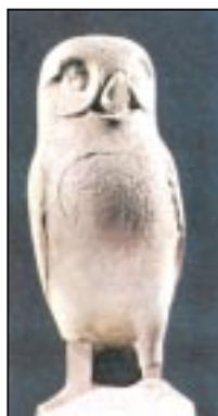
Μαρμάρινη κουκουδάγια, 5ος π.Χ. αι. (Όρν. 331-2). [Πάπυρος]

349 ριζιμίο: με δυνατές και βαθιές ρίζες.