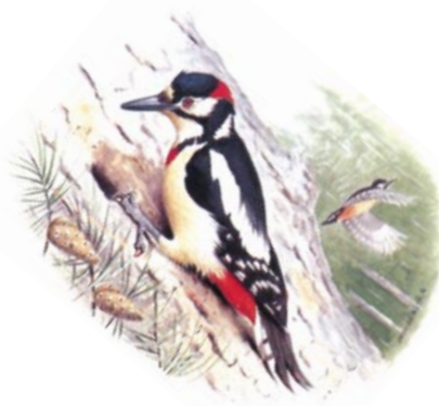
Τσιγκλιτάρα (Ορν. 518). [ΕΟΕ]

646-8 τριακόσια χρονάκια...η κουρούνα: Ο Πει. επιλέγει ό,τι πιο εντυπωσιακό, έστω κι αν δεν έχει πάντα σχέση με την πραγματικότητα. Ο στόχος είναι άλλος· να πεισθούν τα πουλιά!