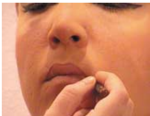
77. Περίγραμμα χειλιών