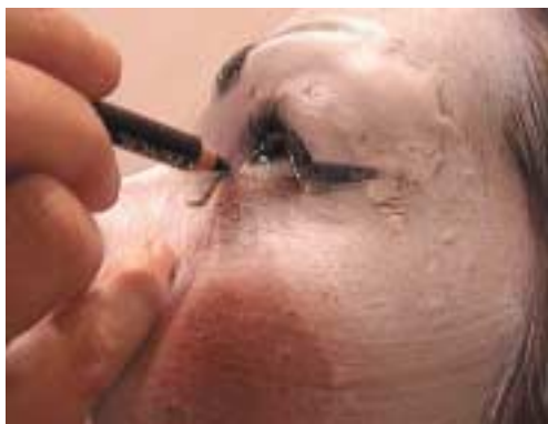
89. Περίγραμμα κάτω βλεφάρου