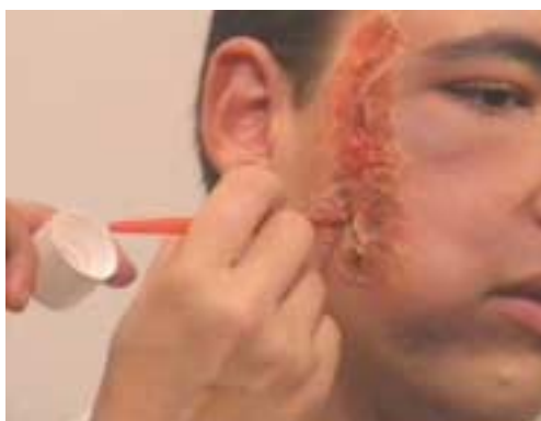
128. Τοποθέτηση αίματος