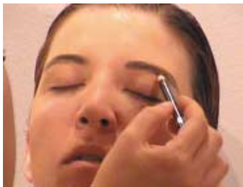
116. Μακιγιάζ φρυδιών