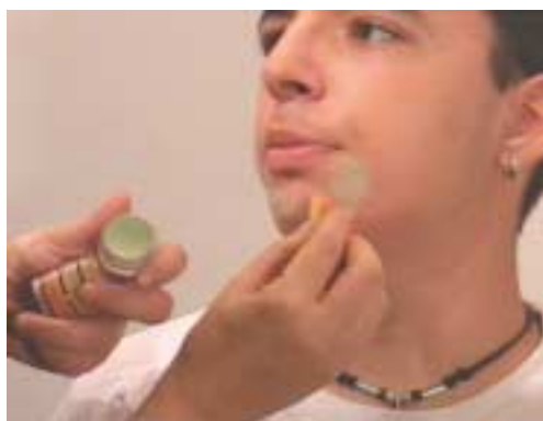
122. Τοποθέτηση διορθωτικών