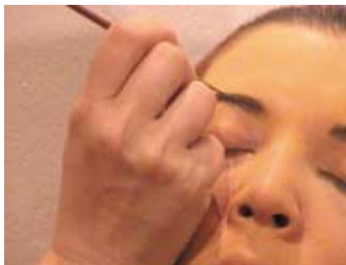
71. Μακιγιάζ φρυδιών