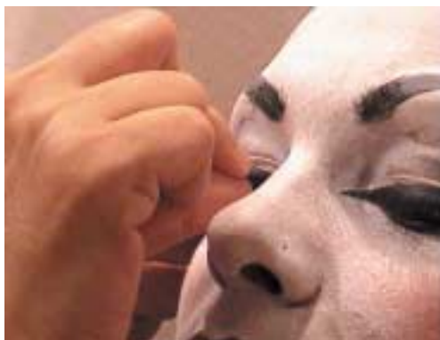
91. Τοποθέτηση ψεύτικων βλεφαρίδων