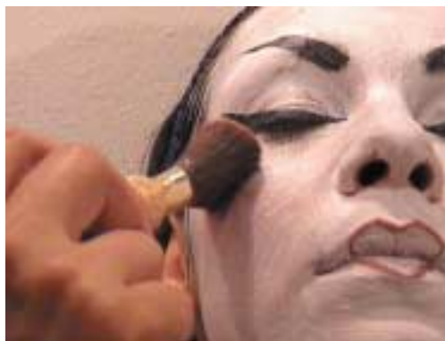
88. Τοποθέτηση ρουζ