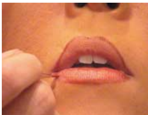
78. Μακιγιάζ χειλιών