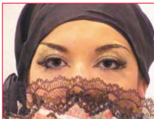
80. Τελικό αποτέλεσμα