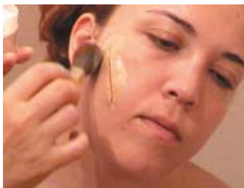
19. Τοποθέτηση διορθωτικών