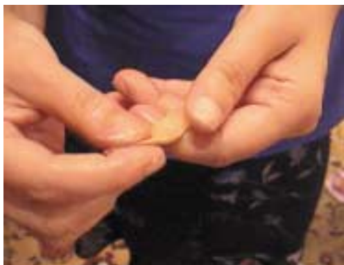
83. Πλάσιμο κεριού