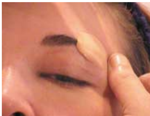
64. Σβήσιμο τών φρυδιών με κερι