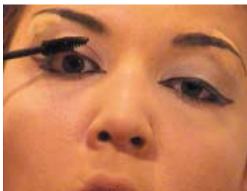
75. Βαφή βλεφαρίδων