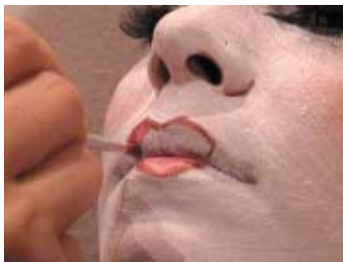
92. Τοποθέτηση κραγιόν