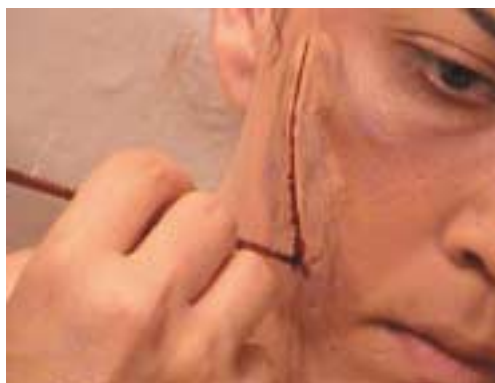
139. Τοποθέτηση αίματος