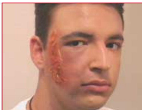
130. Τελικό αποτέλεσμα