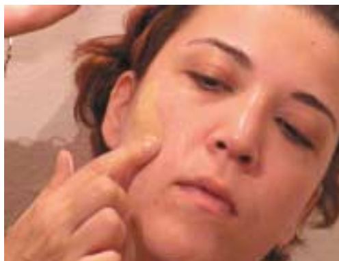
134. Τοποθέτηση κεριού