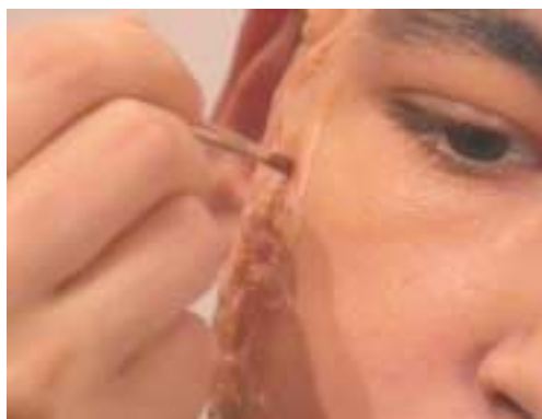
125. Μακιγιάζ εγκαύματος