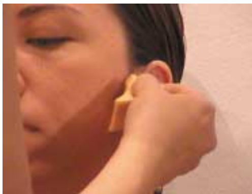
115. Σκίαση παρειών