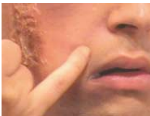
126. Δημιουργία ερεθισμού