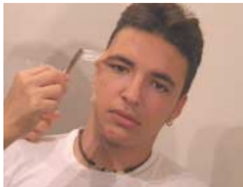
120. Τοποθέτηση ζελατίνης