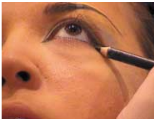
74. Τοποθέτηση περιγράμματος κάτω βλέφαρου