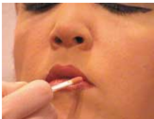
79. Τοποθέτηση γυαλιστικού χειλιών