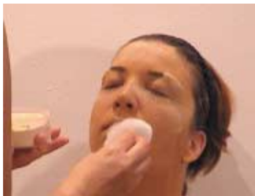
69. Τοποθέτηση πούδρας