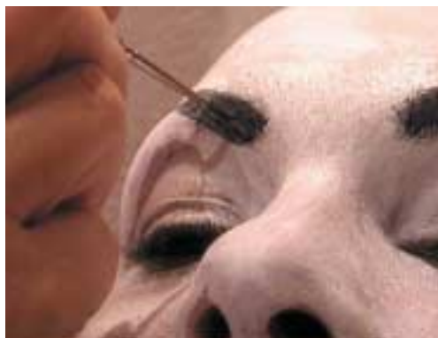
86. Μακιγιάζ φρυδιών