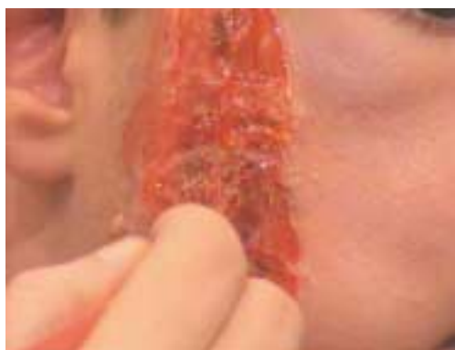
129. Τοποθέτηση αίματος