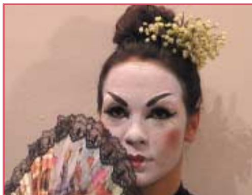
93. Τελικό αποτέλεσμα