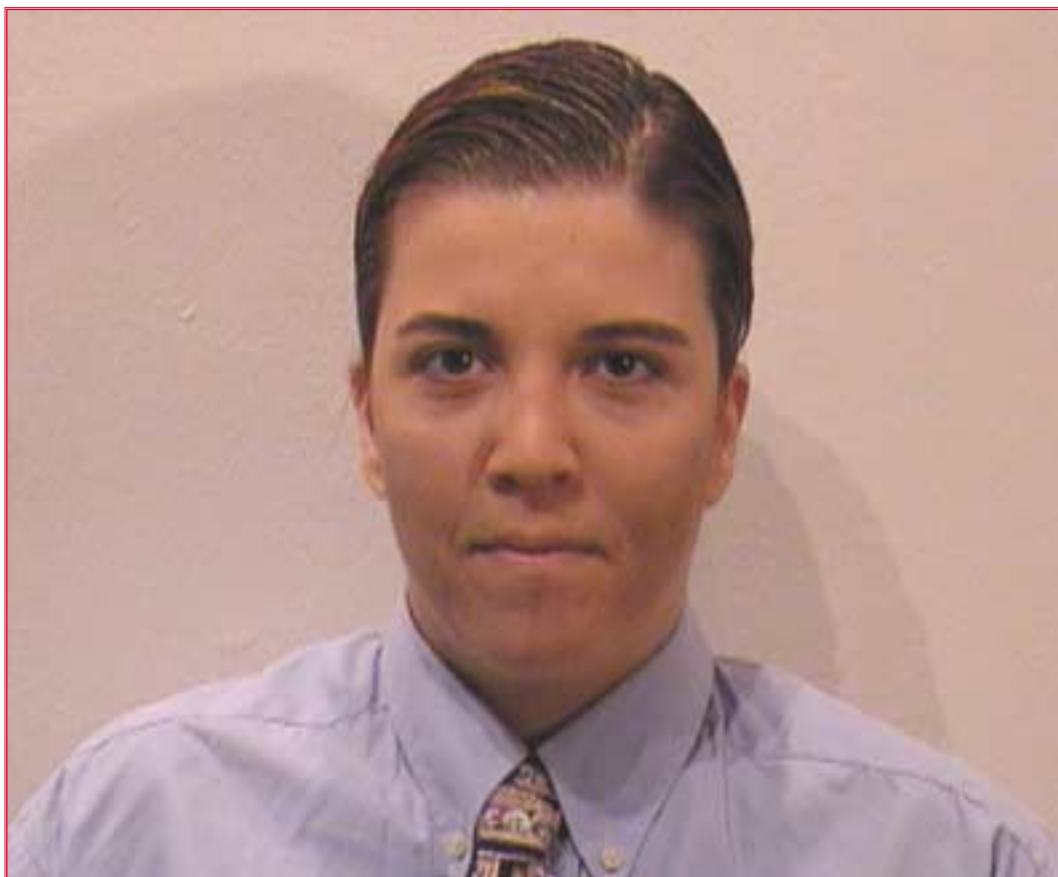
51. Τελικό αποτέλεσμα