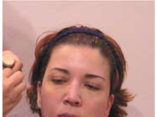
4. Τοποθέτηση καλυπτικού