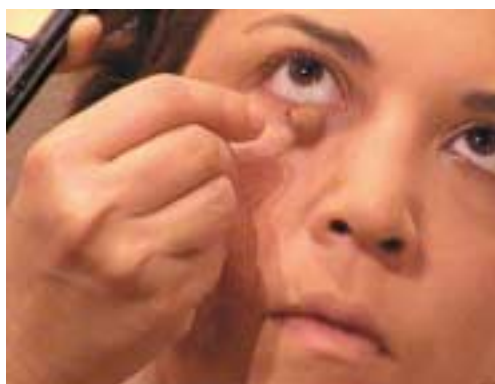
137. Τοποθέτηση καλυπτικού