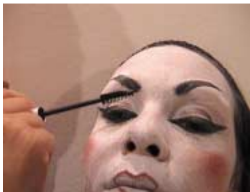
90. Τοποθέτηση βαφής βλεφαρίδων