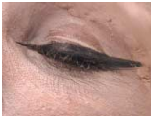
87. Τοποθέτηση περιγράμματος ματιών