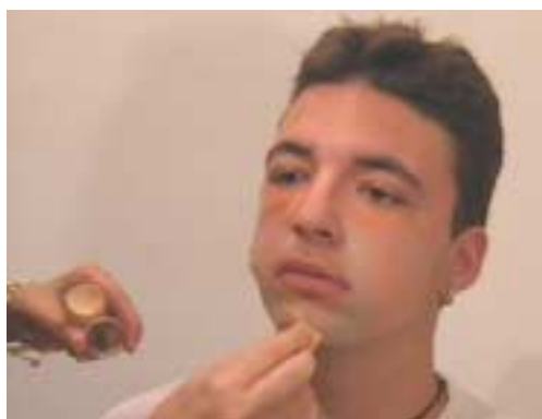
123. Τοποθέτηση διορθωτικών