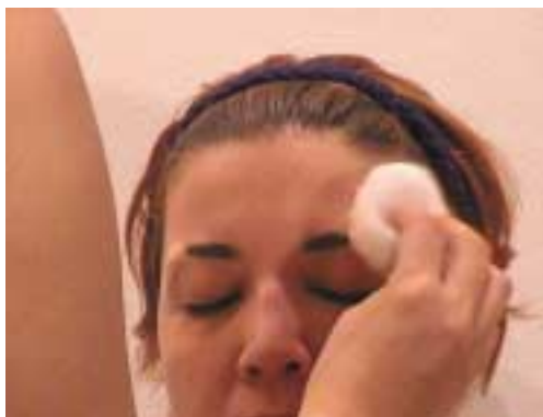
67. Τοποθέτηση πούδρας επάνω στο κερι