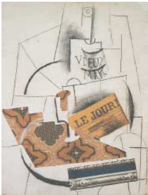
Έργο με κολάζ και ζωγραφική του Πικάσο.