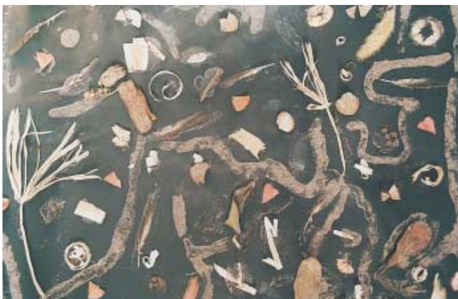
Φωτ.2 Ομαδική σύνθεση με ανάγλυφο κολάζ από υλικά της φύσης.