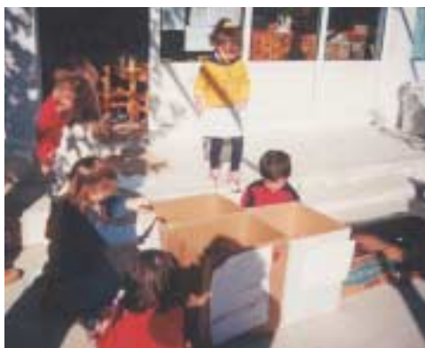
«Ετοιμαζόμαστε να ταξινομήσουμε το άχρηστο υλικό μας»

Θα μπορούσαμε να οργανώσουμε στον παιδικό σταθμό μια γωνιά θησαυρών ή «το τραπέζι της ζωής» (Abbadie M., 1978, σελ. 135), όπου κάθε παιδί θα μπορεί να ακουμπήσει οποιοδήποτε υλικό φέρει και θέλει να το δείξει στα υπόλοιπα παιδιά. Σ' αυτό το χώρο τα παιδιά μπορούν να περιεργαστούν το κάθε υλικό, να προβληματιστούν και να πουν τις ιδέες τους για τον τρόπο χρήσης του, να το αγγίξουν, να το μυρίσουν. Σ' αυτό το χώρο τα υλικά ταξινομούνται από τα παιδιά, τοποθετούνται σε κούτες και αποθηκεύονται, έτσι ώστε να είναι έτοιμα για χρήση. Εάν κάποια υλικά χρειάζονται ορισμένη κατεργασία πριν από τη χρήση, όπως ξύσιμο, καθάρισμα, αφήνουμε τα παιδιά να την κάνουν μόνα τους και βοηθάμε, όπου χρειάζεται.