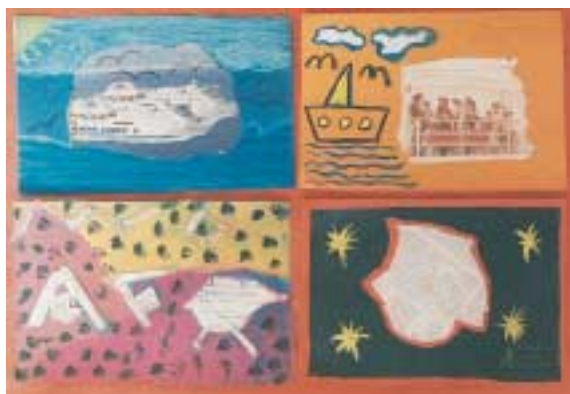
Συνθέσεις με κολλάζ και ζωγραφική.