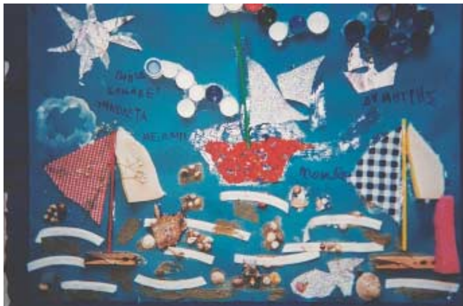
Φωτ.1 Ομαδική σύνθεση με ανάγλυφο κολάζ από άχρηστο υλικό.