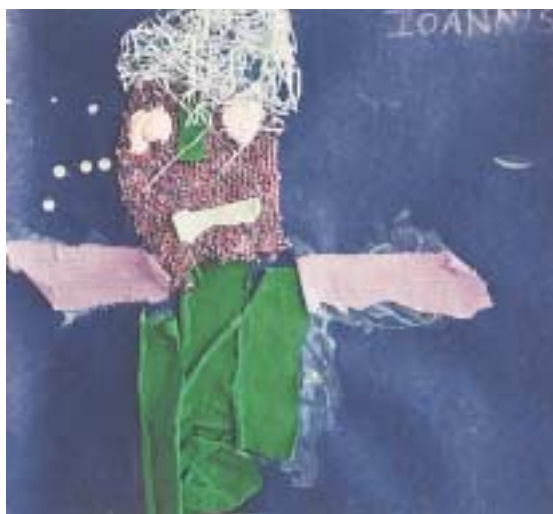
Παιδική σύνθεση με κολάζ.

Το κολάζ είναι μια σύνθεση, ένας πρωτότυπος τρόπος έκφρασης που προσφέρει ένα τελικό αποτέλεσμα, το οποίο προκύπτει από την επικόλληση διαφόρων ομογενών ή ετερογενών στοιχείων πάνω σε μια επιφάνεια. Αποτελεί πρόκληση για το δημιουργό του, γιατί του δίνει τη δυνατότητα να χρησιμοποιήσει τα πιο παράξενα και αταίριαστα υλικά, επιτρέποντας μια τολμηρή και πρωτότυπη έκφραση.