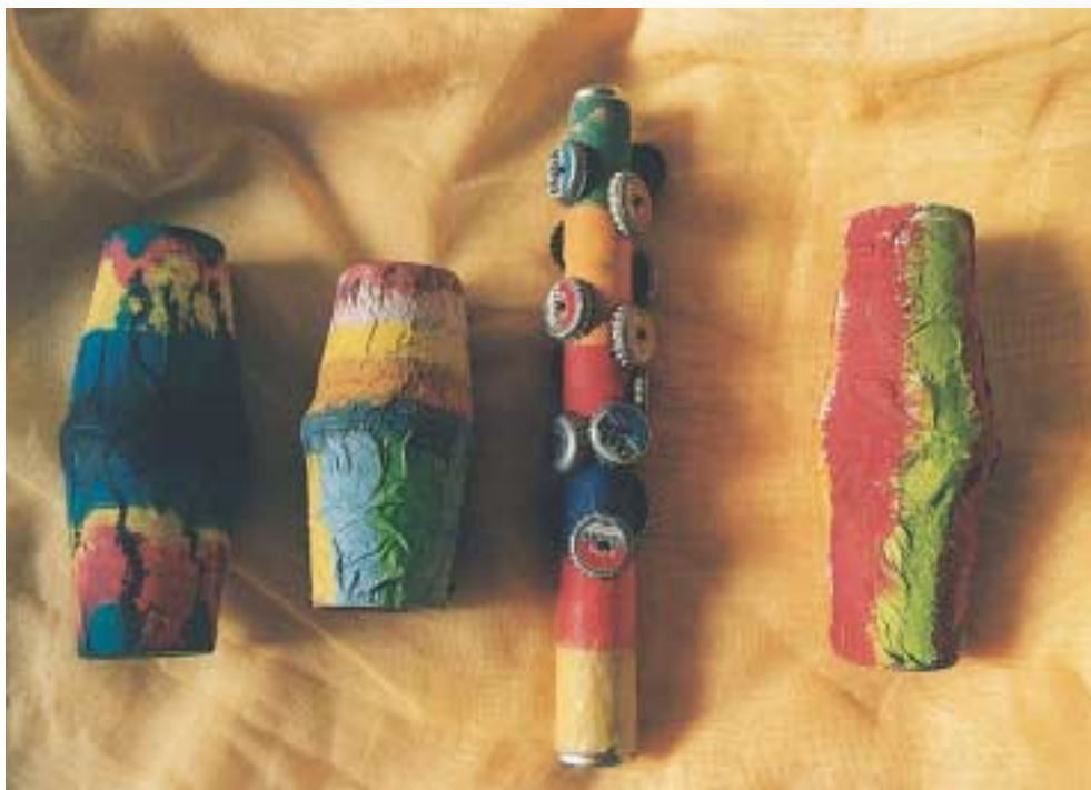
Μουσικά όργανα από άχρηστο υλικό: Μαράκες από πλαστικά ποτήρια. Σείστρο από μπομπίνα και καπάκια αναψυκτικών.

φελιζόλ ή αφρολέξ, κομμάτια από αλουμινόχαρτο, παλιά εισιτήρια, κουδουνάκια και ό,τι άλλο μπορεί να κάνει το κολιέ μας πιο όμορφο. Σ' όσα υλικά δεν έχουν τρύπα, κάνουμε μια τρύπα και περνάμε όλα τα υλικά με τη σειρά που θέλουμε σ' ένα σπάγγο, κάνουμε δύο κόμπους στις άκρες τους και το κολιέ μας είναι έτοιμο για να το φορέσουμε. Κατά τον ίδιο τρόπο μπορούμε να φτιάξουμε γιρλάντες ή κολιέ με υλικά από τη φύση, όπως κουκουνάκια, φτερά, ξυλαράκια, κλαδιά κ.ά., αν τα δέσουμε σ' ένα σπάγγο ή κορδέλα.