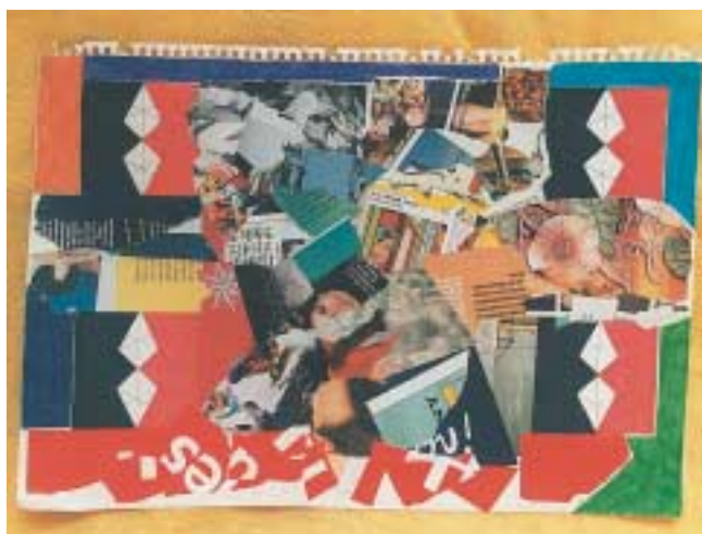
Μεικτή τεχνική: Επίπεδο κολάζ και ζωγραφική.

Το επίπεδο κολάζ γίνεται πάνω σε χαρτί ή χαρτόνι λευκό ή χρωματιστό, διαφανές πλεξιγκλάς, χοντρό πλαστικό φύλλο. Απαραίτητα υλικά είναι το ψαλίδι και η κόλλα. Μπορούμε να κολλήσουμε χαρτιά από καραμέλες, χρωματιστά χαρτιά, σελοφάν, εικόνες από διάφορα περιοδικά ή εφημερίδες, γραμματόσημα, χαρτοπετσέτες, χαρτί ταπετσαρίας κ.ά.