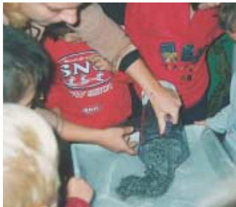
«Ρίχνουμε τον πολτό του χαρτιού στη σήτα.»