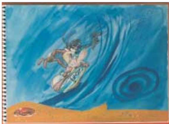
Σύνθεση με μεικτή τεχνική. Κολάζ και ζωγραφική σε βρεγμένο χαρτί