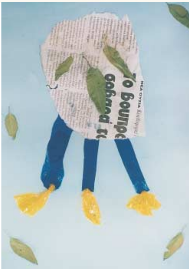
Σύνθεση με επίπεδο κολάζ.