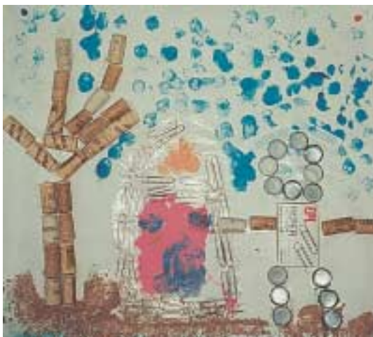
Ομαδική σύνθεση από παιδιά. Μεικτή τεχνική: Κολάζ από άχρηστο υλικό, ζωγραφική και τυπώματα.

Κολάζ μπορεί να γίνει και για διακοσμητικούς λόγους, όπως για να φτιάξουμε το δικό μας χαρτί περιτυλίγματος, για να τυλίγουμε τα δώρα μας ή για να διακοσμήσουμε μια κατασκευή μας (μάσκα, κορνίζα) ή για να φτιάξουμε κάρτες Χριστουγεννιάτικες, γενεθλίων ή προσκλήσεις.