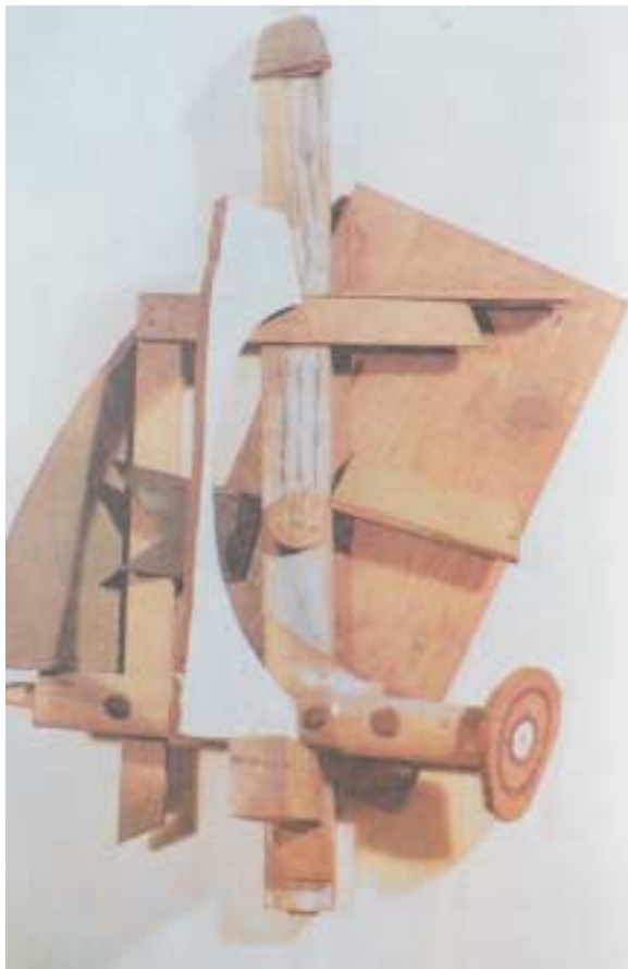
«Μαντολίνο». Γλυπτή κατασκευή από άχρηστο υλικό. Πικάσο 1914.