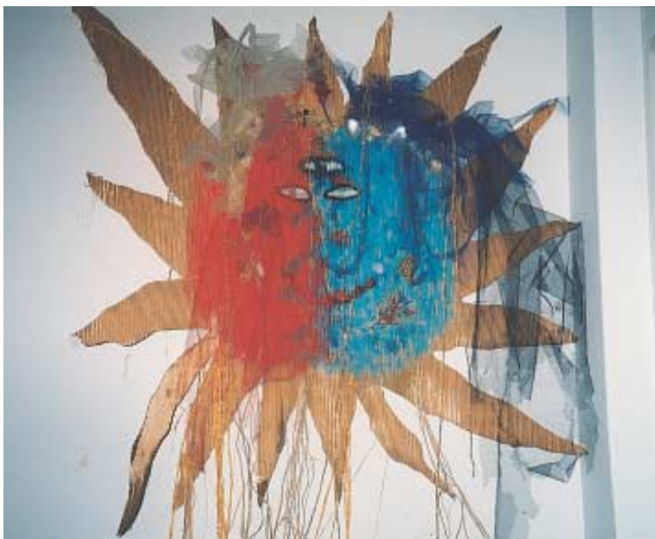
Κατασκευή με άχρηστο υλικό. Μεικτή τεχνική: κολάζ, ζωγραφική.

Αν ως παιδαγωγοί λειτουργούμε μ' αυτό τον τρόπο, τότε θα έχουμε πετύχει τους στόχους της αγωγής ως προς τη δημιουργία πολιτών που αγαπούν την τέχνη και τον πολιτισμό.