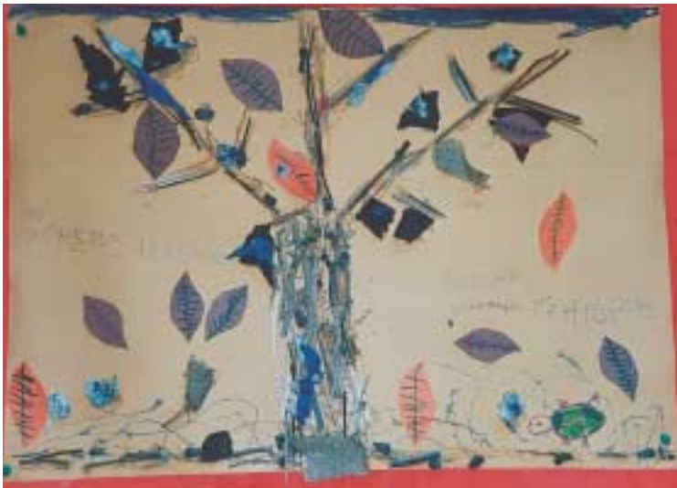
Ομαδική σύνθεση με κολάζ και ζωγραφική.

Το ανάγλυφο κολάζ γίνεται σε χαρτί ή κόντρα πλακέ, ανάλογα με το βάρος των υλικών και χρησιμοποιούμε, συνήθως, κόλλα υγρή. Μπορούμε να κολλήσουμε ξυλαράκια, οδοντογλυφίδες, σπέρτα, ζυμαρικά, όσπρια, κουμπιά, καπάκια, κουτάκια, υφάσματα όλων των ειδών, φλούδες δένδρων, ξερά φύλλα ή λουλούδια, βαμβάκι, μαλλί, όστρακα, φελλούς, τσόφλια αβγών, πριονίδια φτερά, πουλίες, κορδέλες, δημητριακά, χαλίκια, άμμο κ.ά.