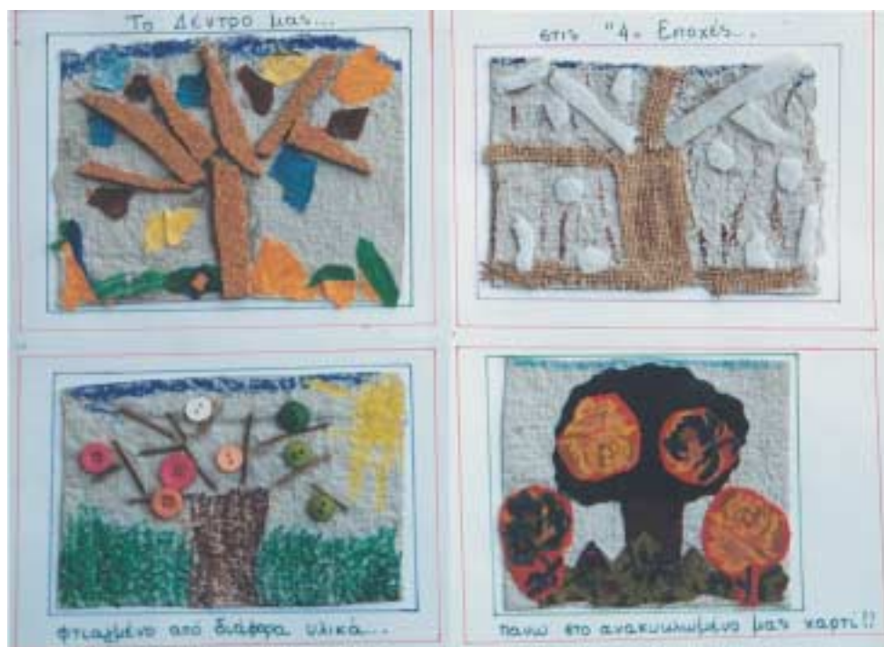
«Τέσσερις εποχές» κολάζ και ζωγραφική σε ανακυκλωμένο χαρτί.

Ο ενθουσιασμός των παιδιών θα είναι μεγάλος, αν ζωγραφίσουν, φτιάξουν κολάζ, χρωματιστές κάρτες, δημιουργήσουν ένα βιβλίο πάνω σε ανακυκλωμένο χαρτί, που έφτιαξαν τα ίδια.