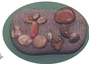
Ανάγλυφο κολλάζ με βοτσαλάκια πάνω σε μεγάλο βότσαλο.