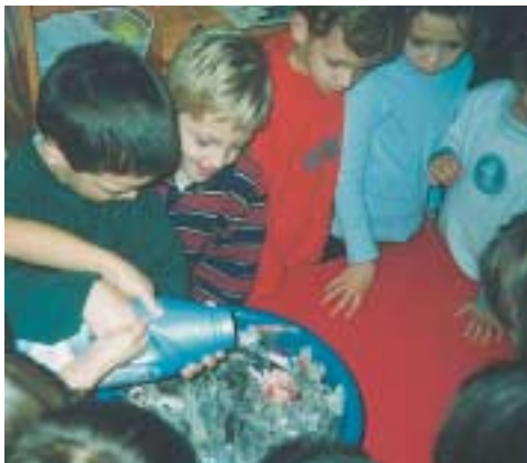
«Βρέχουμε το χαρτί.»