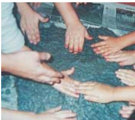
«Τον ακουμπάμε μαζί με τη σήτα πάνω σε εφημερίδα και τον απλώνουμε για να στραγγίξει το νερό.»