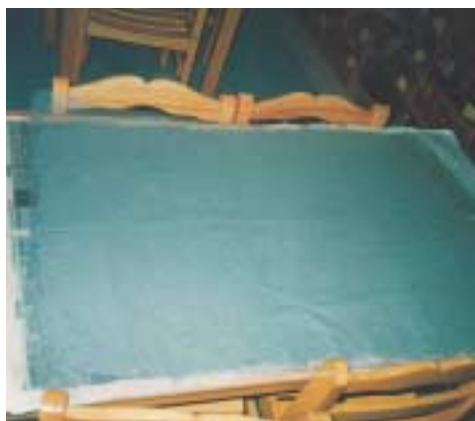
«Περιμένουμε να στεγνώσει.»

Η ανακύκλωση του χαρτιού, είναι μια διαδικασία, που μπορούμε εύκολα να την εφαρμόσουμε στον παιδικό σταθμό.