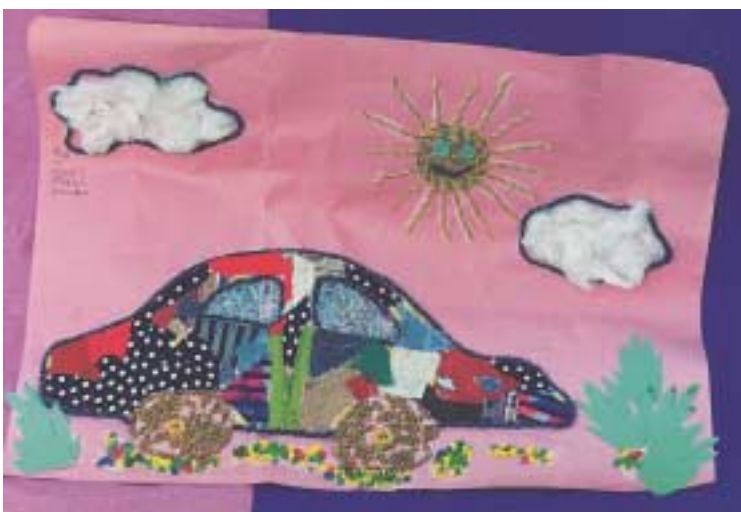
Ανάγλυφο κολάζ από άχρηστο υλικό. Έργο μαθητριών.