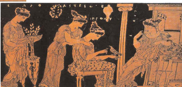
Προετοιμασία γάμου στο γυναικονίτη