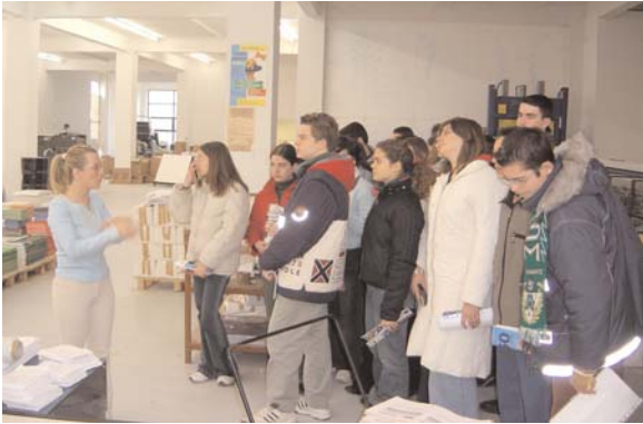
Ενημέρωση από υπεύθυνη στις εγκαταστάσεις του ΠΑΡΑΤΗΡΗΤΗ της Θράκης