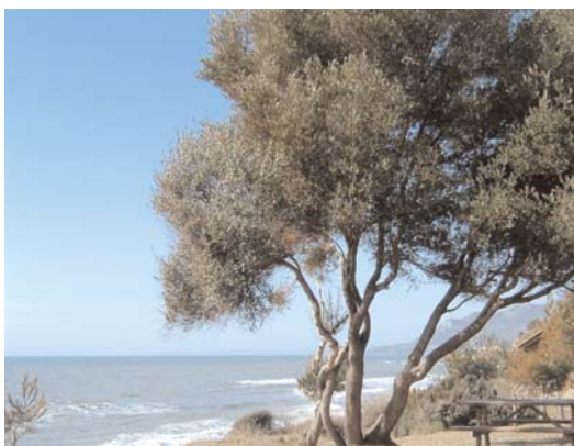
Ο πρωταγωνιστής του θέματος...