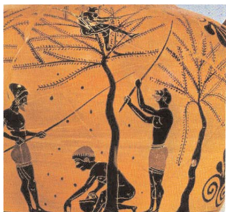
Ελαιοσυγκομιδή Αμφορέας, 6ος αι. πΧ. Λονδίνο < Βρετανικό Μουσείο