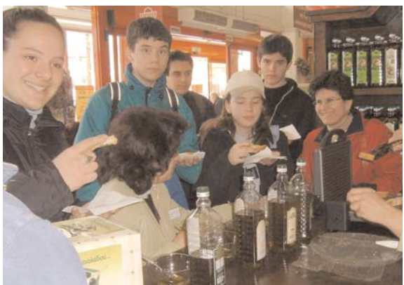
Επίσκεψη σε πολυκατάστημα.