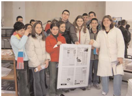
Τα παιδιά παρουσιάζουν την εργασία τους στους συμμαθητές τους