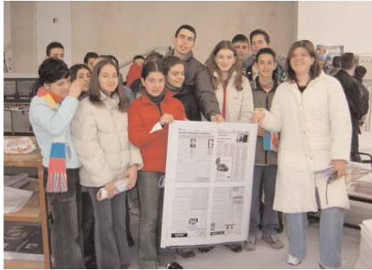
Ο «τοίγκος» από τον οποίο θα τυπωθούν τέσσερις σελίδες μιας εφημερίδας...