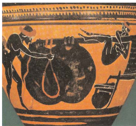
Παράσταση από ελαιοτριβείο Σκύφος, 6ος αι. πΧ. Βοστώνη, Μουσείο Καλών Τεχνών