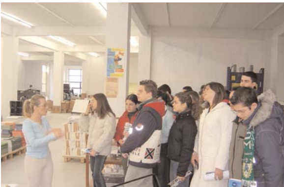
Έτσι γίνεται το στήσιμο ενός περιοδικού