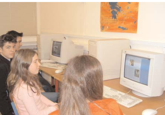
Αναζήτηση υλικού στο διαδίκτυο