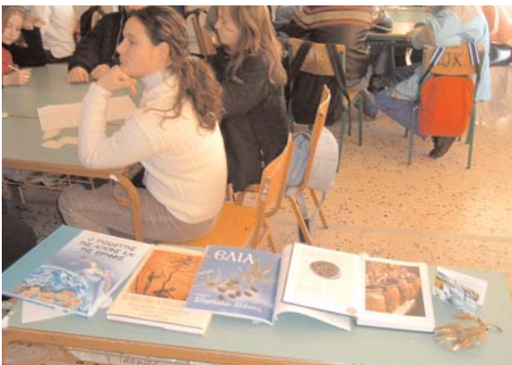
Μέρος της βιβλιογραφίας που χρησιμοποιήθηκε