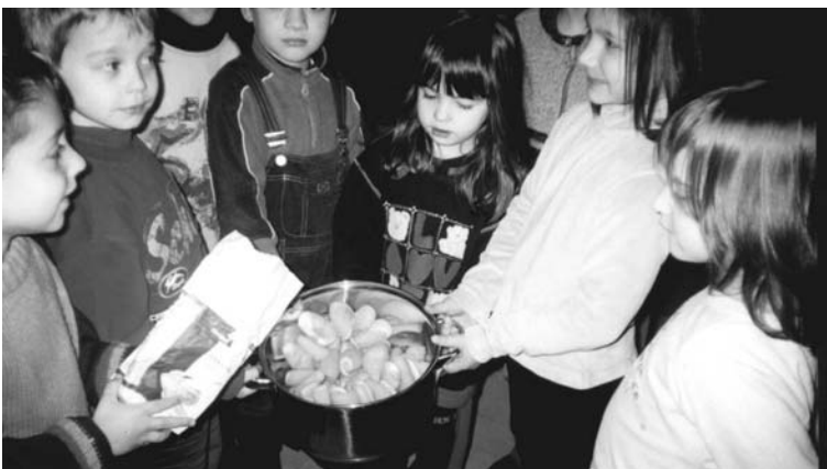
«Δέσαμε» το γλυκό...