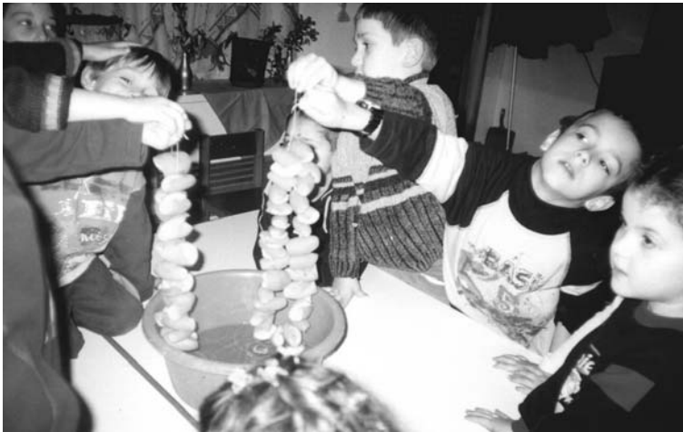
Περάσαμε τα νεράτζια σε «αρμάθες» με χοντρή βελόνα και κλωστή