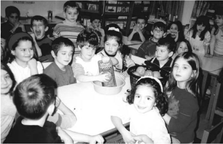
Εύσαμε τη φλούδα των νερατζιών στο τρίφτη