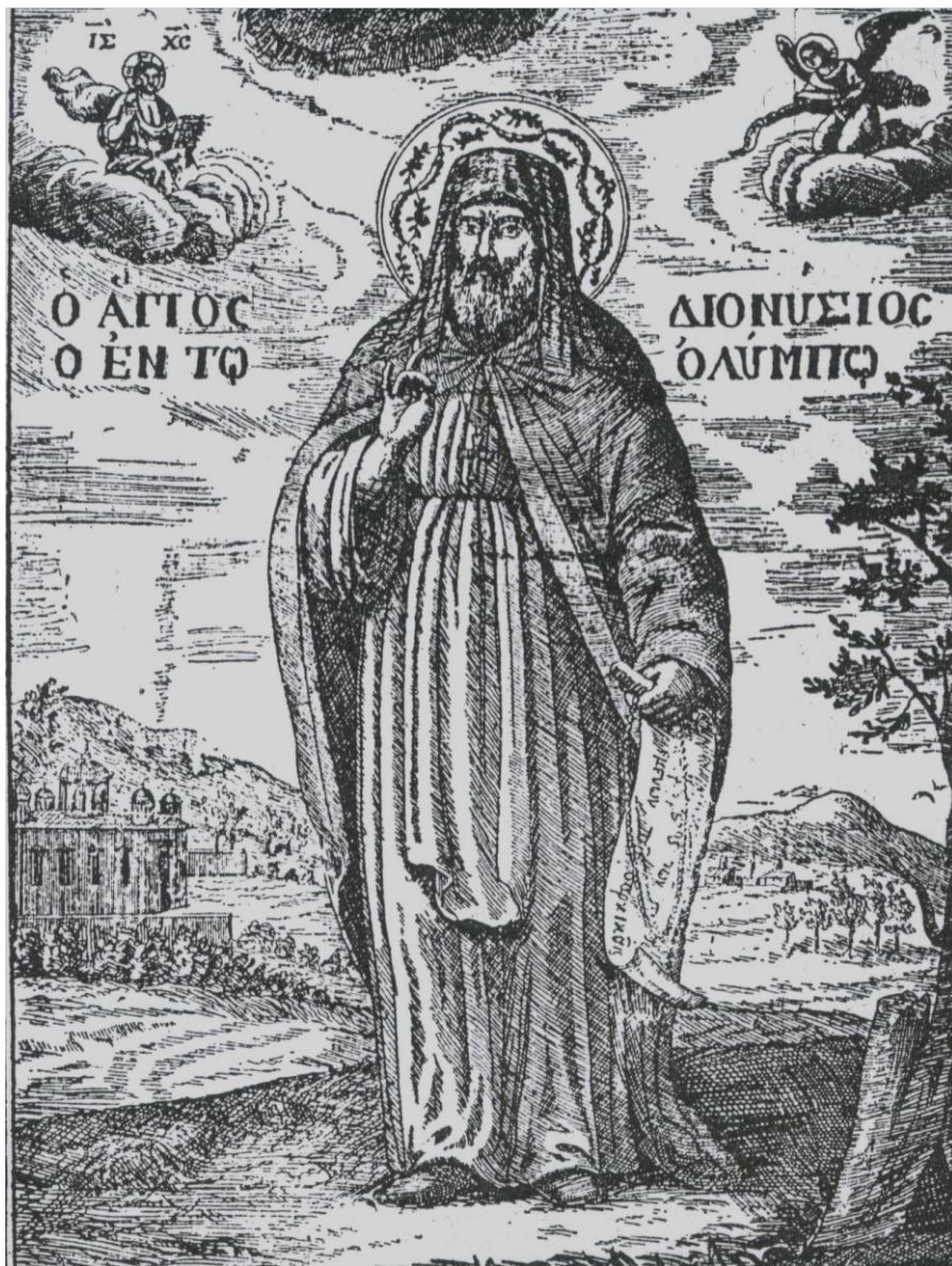
Ο Άγιος Διονύσιος του Ολύμπου