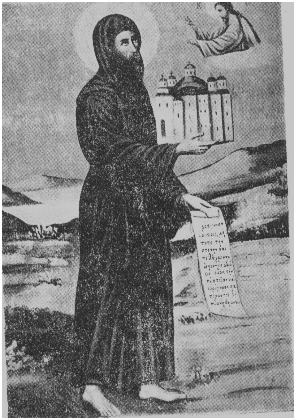
Ο Όσιος Συμεών ο μονοχίτων και ανυπόδητος