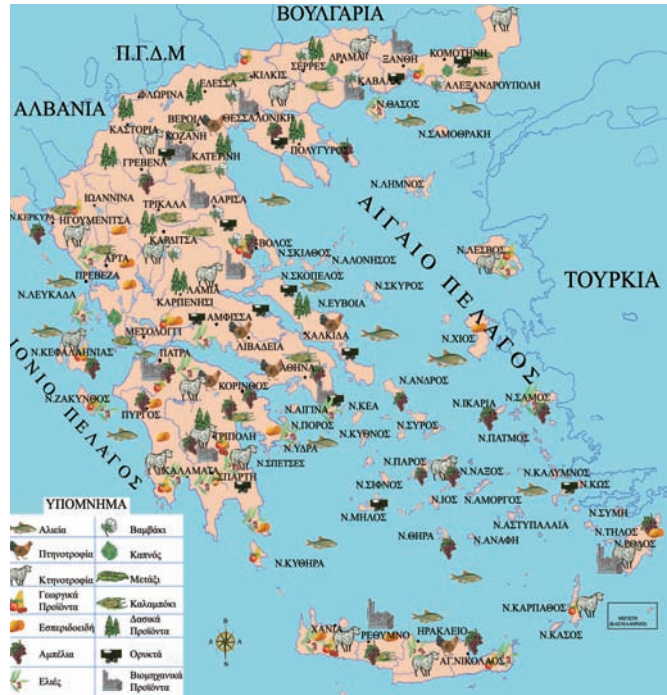
Εικόνα 2.1: Χάρτης παραγωγής προϊόντων

2. Δίνονται τα εξής είδη χαρτών: οδικός, παραγωγής προϊόντων, γεωμορφολογικός, πολιτικός, ακτοπολιτικός, αρχαιολογικός. Σκέψου και απάντησε ποιον χάρτη θα χρησιμοποιήσεις, για να: