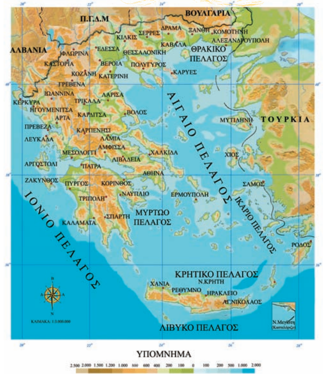
11ο Φύλλο αξιολόγησης: Γεωμορφολογικός χάρτης της Ελλάδας