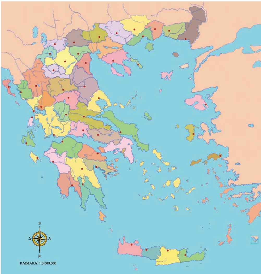
10ο Φύλλο αξιολόγησης: Πολιτικός χάρτης της Ελλάδας