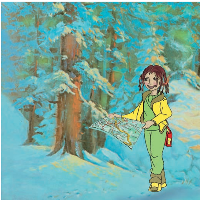
Εικόνα 1.1: Παιδιά εκδρομείς