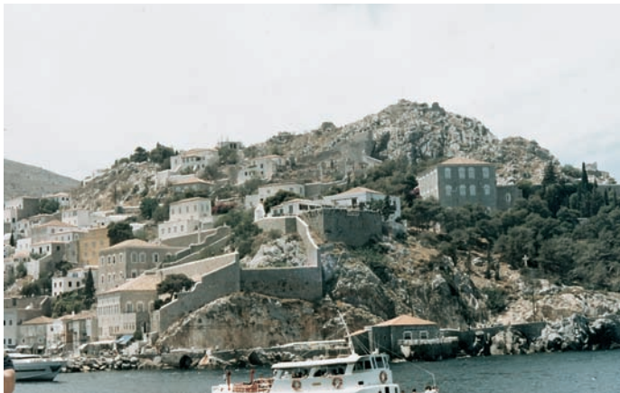
Εικόνα 10.1: Ύδρα