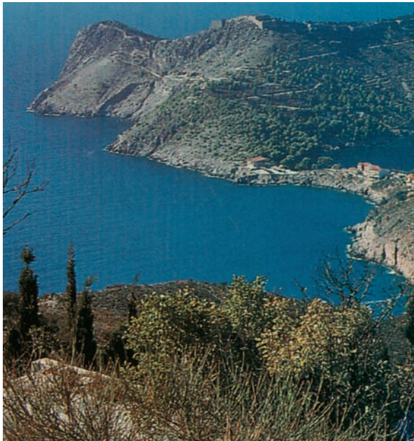
Εικόνα 8.1: Κεφαλλονιά, Άσσος

«να ταξιδεύουν στον αγέρα τα νησιάκια, οι κάβοι, τ' ακρογιάλια σαν μεταξένιοι αχνοί και με τους γλάρους συνοδιά κάποτ' ένα καράβι ν' ανοίγουν να το πάρουν οι ουρανοί...»