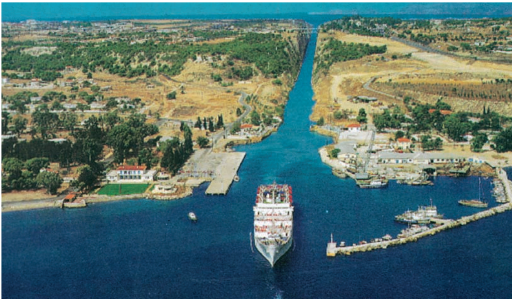
Εικόνα 8. 4: Η Διώρυγα της Κορίνθου

Από την αρχαιότητα ο τύραννος της Κορίνθου Περίανδρος είχε σκεφτεί να «κόψει» το κομμάτι γης (τον ισθμό ) που εμπόδιζε την πλεύση των πλοίων από τον Κορινθιακό στο Σαρωνικό Κόλπο.