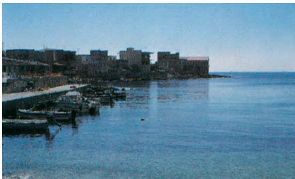
Εικόνα 8.2: Σάμος, Βαθύ