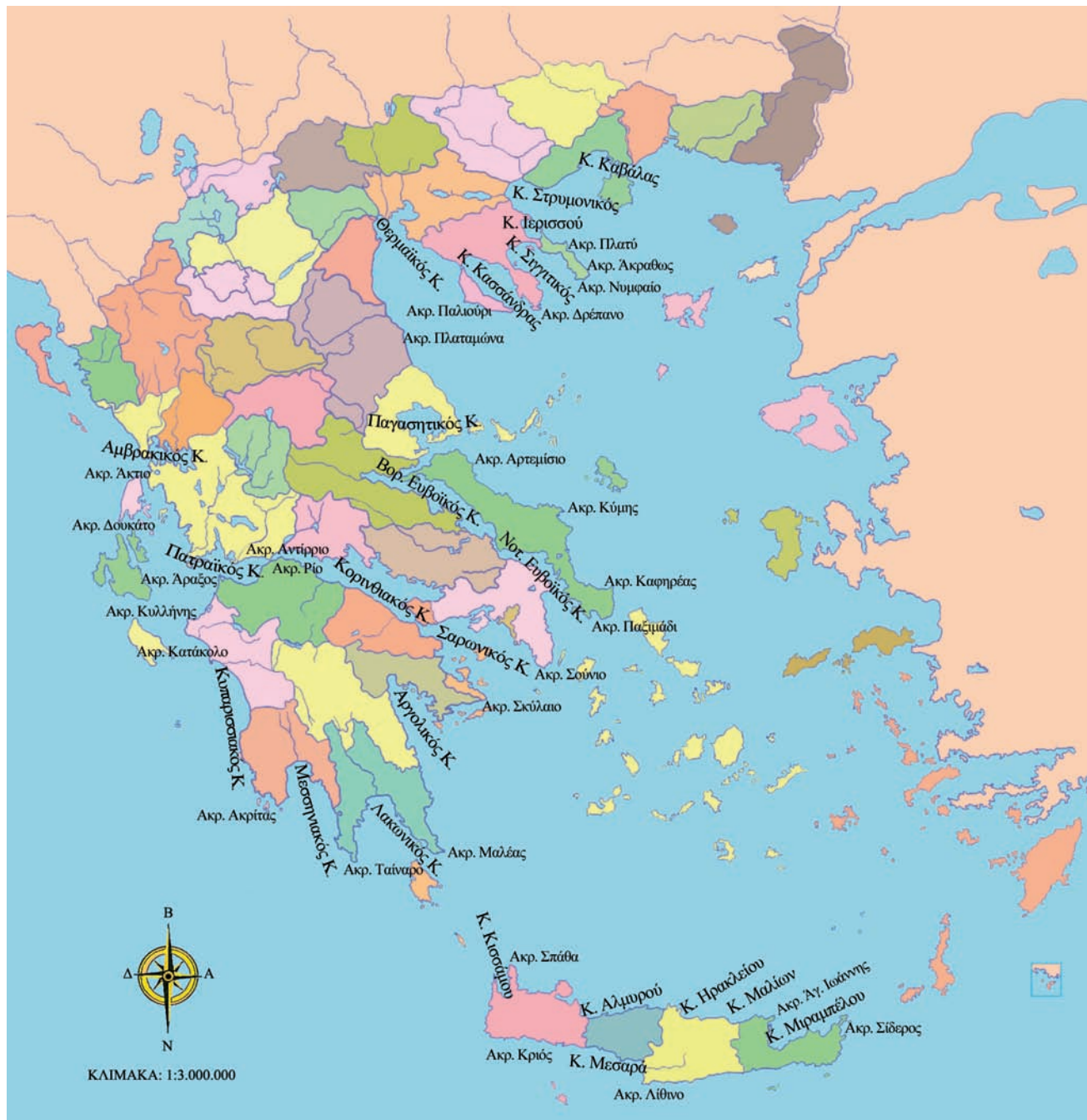
Εικόνα 9.2: Πολιτικός χάρτης της Ελλάδας

Παρατηρήστε τον παραπάνω πολιτικό χάρτη της Ελλάδας και βρείτε ποιοι κόλποι βρίσκονται στο Αιγαίο και ποιοι στο Ιόνιο πέλαγος.