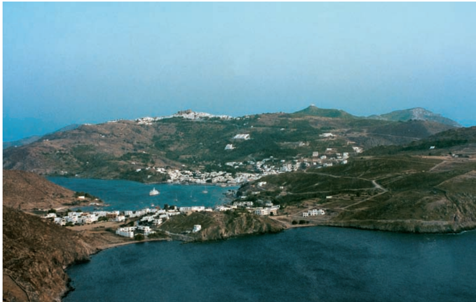
Εικόνα 9.1: Νησιωτικό τοπίο