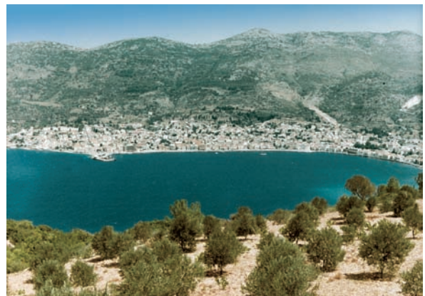
Εικόνα 8.3: Γερολιμένας, παραθαλάσσιος οικισμός της Λακωνίας