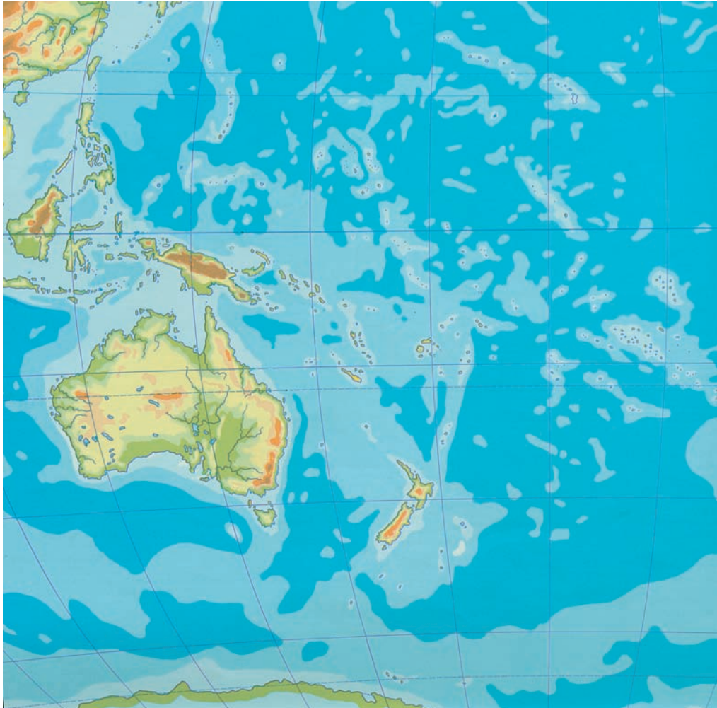
Εικόνα 44.1: Γεωμορφολογικός χάρτης της Ωκεανίας