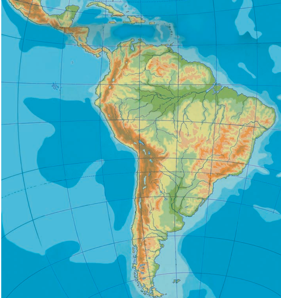
Εικόνα 42.1: Γεωμορφολογικός χάρτης της Ν. Αμερικής