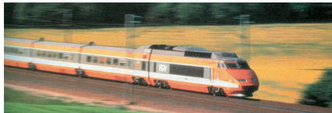
Εικόνα 23.4: Ο γαλλικός Σιδηρόδρομος Μεγάλης Ταχύτητας

Ας συζητήσουμε τις συνέπειες που επιφέρουν στο περιβάλλον οι ανθρώπινες επεμβάσεις με την ανάπτυξη της τεχνολογίας.