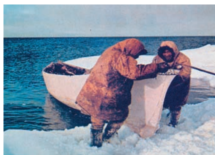
Εικόνα 23.6: Από τη ζωή των Εσκιμώων