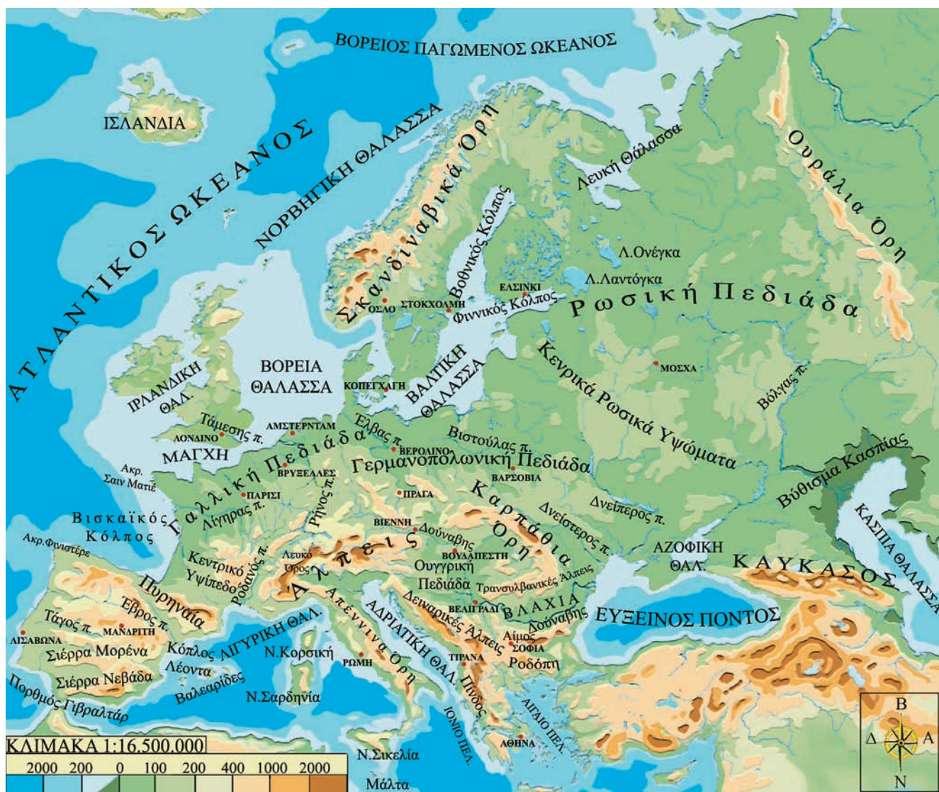
Εικόνα 26.1: Γεωμορφολογικός χάρτης της Ευρώπης