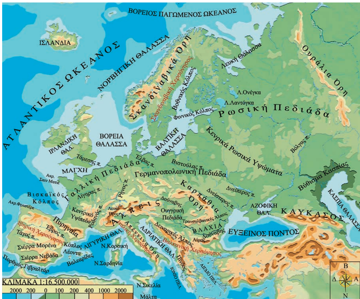
Εικόνα 25.1: Οι μεγάλες χερσόνησοι της Ευρώπης