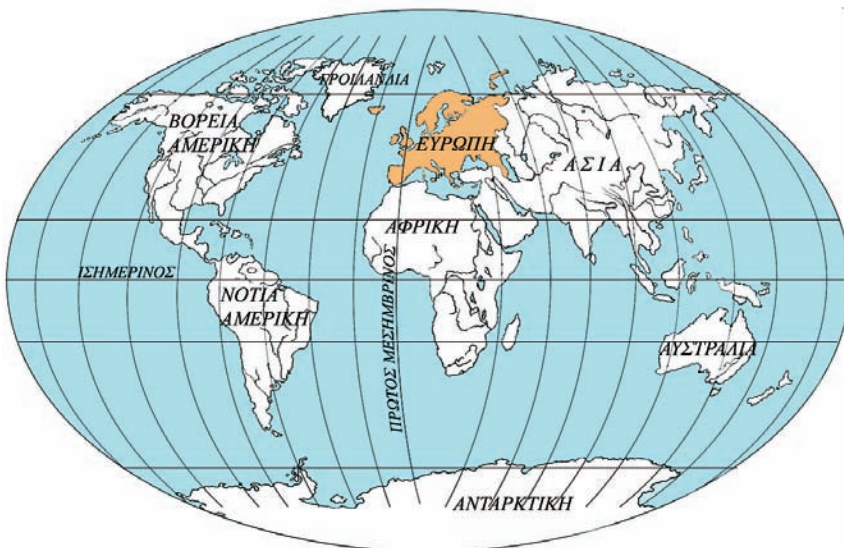
Εικόνα 24.1: Η θέση της Ευρώπης στη Γη

Και η Ευρώπη, η ήπειρος, του Αγίνωρα η κόρη, του Κάδμου η μικρή αδελφή, του Βασιλιά της Θήβας, η Ευρώπη, που αγάπησε ο Δίας του Ολύμπου, συγκέντρωσε τα τέκνα της και με σοφία λέγει: «Δεν πρέπει πια ποτέ ξανά να αποχωριστείτε. Βοήθεια να δίνετε ο ένας προς τον άλλον κι όλα της γης τα αγαθά δίκαια να μοιραστείτε».