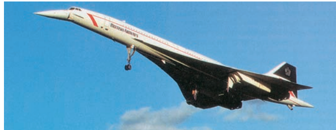
Εικόνα 23.3: Υπερηχητικό αεροσκάφος ΚΟΝΚΟΡΤ