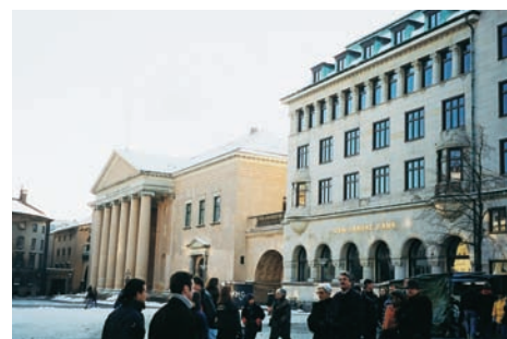
Εικόνα 23.7: Από τη ζωή των Ευρωπαίων, Κοπεγχάγη

Ας συγκρίνουμε τον τρόπο ζωής των φυλών των τροπικών δασών και των πολικών περιοχών με τον τρόπο ζωής των ανθρώπων στις εύκρατες περιοχές της Γης. Πώς συμπεριφέρονται στη φύση οι πρώτοι και πώς οι δεύτεροι;