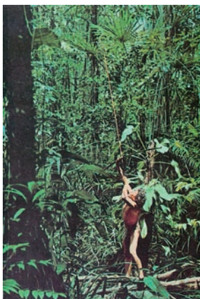
Εικόνα 23.5: Από τη ζωή στα τροπικά δάση

Η ζωή του ανθρώπου είναι συνυφασμένη με το περιβάλλον, στο οποίο ζει. Άλλοτε ο άνθρωπος προσαρμόζεται σύμφωνα με τις συνθήκες που αντιμετωπίζει και άλλοτε προσαρμόζει τη φύση στις ανάγκες και στις απαιτήσεις του.