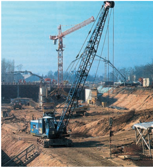
Εικόνα 23.2: Κατασκευή δρόμου στη Γερμανία

τις Καλές Τέχνες. Παράγουν διαρκώς όλο και περισσότερα αγαθά, κάνουν νέες εφευρέσεις για την καλύτερη διαβίωσή τους και επικοινωνούν εύκολα μεταξύ τους σε όποιο σημείο του πλανήτη κι αν βρίσκονται. Ταξιδεύουν με ασφάλεια και ταχύτητα με αυτοκίνητα, τρένα, πλοία και αεροπλάνα.