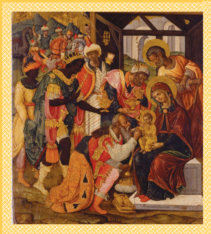
Εμμανουήλ Τζάνες, Η προσκύνηση των Μάγων