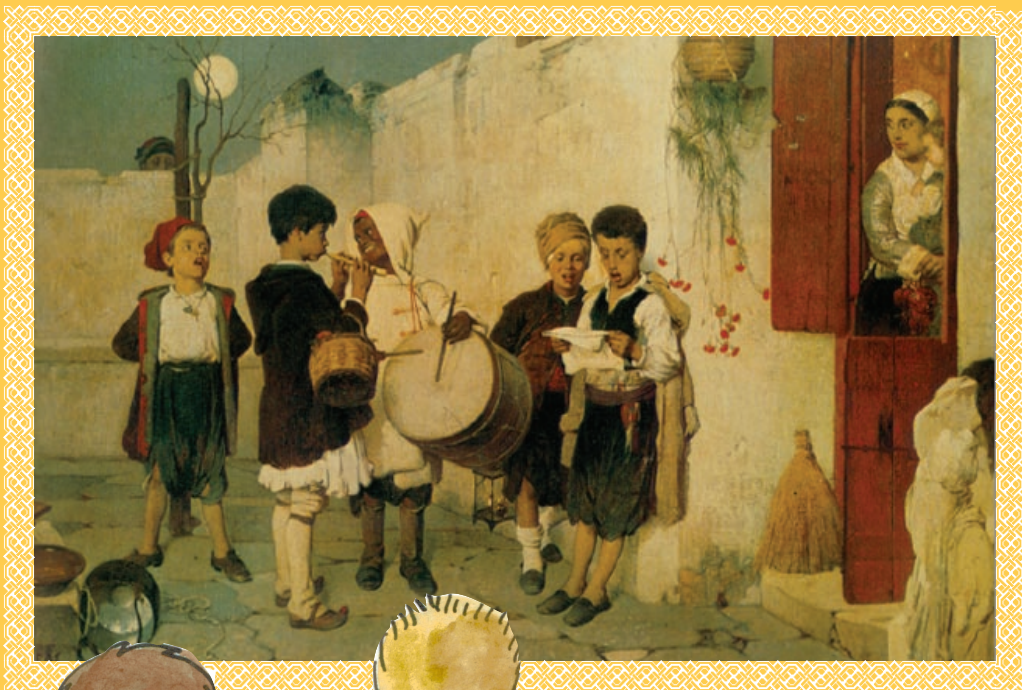
Νικηφόρος Λύτρας, Τα κάλαντα