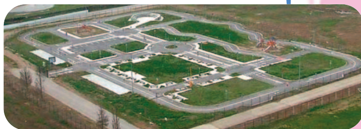
Πάρκο Κυκλοφοριακής Αγωγής Σερρών, www.e-view.gr/.../parko_kuklof_agogis.jpg

Πάρκο Κυκλοφοριακής Αγωγής ΥΜΕ, Αριστοτέλειο Πανεπιστήμιο Θεσσαλονίκης, Τμήμα Αγρονόμων και Τοπογράφων Μηχανικών, Ιούλιος 2002 (διασκευή)