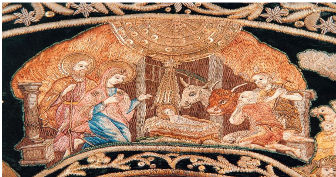
ΛΕΠΤΟΜΕΡΕΙΑ ΕΠΙΤΡΑΧΗΛΙΟΥ, Δώρο του Γρηγορίου Βελλά εκ Μελενίκου, στην ιερή Μεγίστη Μονή Βατοπεδίου, Άγιο Όρος, 2 Μαρτίου 1813

Γεώργιος Δροσίνης, ΑΠΑΝΤΑ 3ος τόμος, εκδ. ΣΥΛΛΟΓΟΣ ΠΡΟΣ ΔΙΑΔΟΣΙΝ ΩΦΕΛΙΜΩΝ ΒΙΒΛΙΩΝ, Αθήνα, 1996