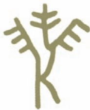
Το δέντρο της ελιάς

Ιδεογράμματα του δέντρου της ελιάς, του ελαιόλαδου και του καρπού της ελιάς σε πινακίδες της Γραμμικής Α και Β γραφής.