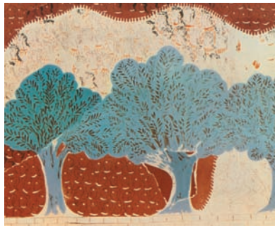
Ο περίφημος ελαιώνας από τοιχογραφία του περίφημου ανακτόρου της Κνωσού, Νίκος & Μαρία Ψιλάκη - Ηλιάς Καστανάς, Ο πολιτισμός της ελιάς, εκδ. Καρμάνωρ, Ηράκλειο, 1999.

Η ελιά κυριαρχεί στο ελληνικό τοπίο, το φωτίζει με το χαρακτηριστικό γκριζοπράσινο χρώμα της και εμπνέει τους καλλιτέχνες από την αρχαιότητα μέχρι σήμερα. Τα κλαδιά της, τα φύλλα της, σκηνές από το μάζεμα του καρπού της, στόλισαν τοίχους αρχαίων παλατιών αλλά και αρχαίους αμφορείς και αγγεία. Έγιναν το θέμα γνωστών έργων ζωγραφικής νεότερων Ελλήνων και ξένων καλλιτεχνών.