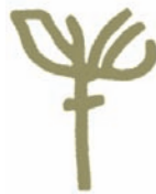
Ο καρπός της ελιάς