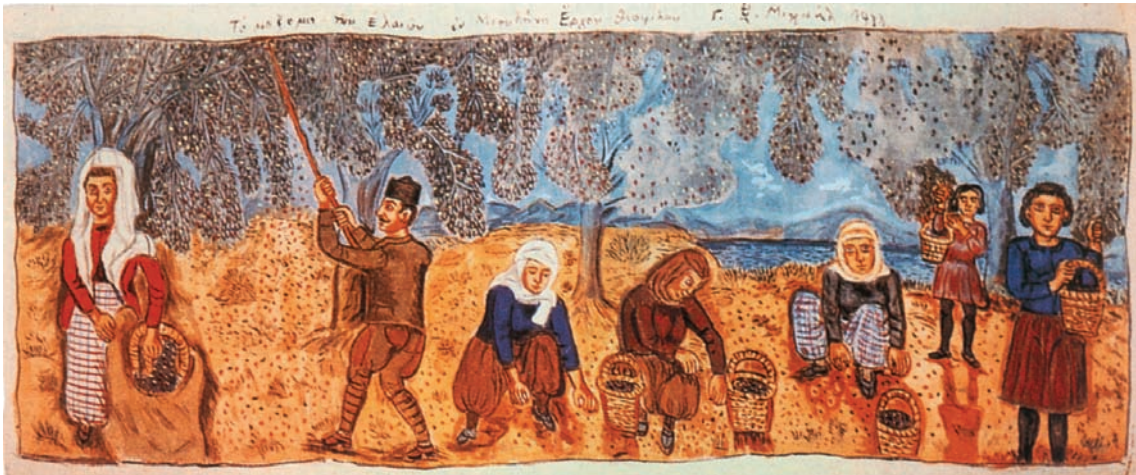
Λιομάζωμα στη Λέσβο, σε πίνακα του Θεόφιλου, Νίκος & Μαρία Ψιλάκη - Ηλίας Καστανάς, Ο πολιτισμός της ελιάς, εκδ. Καρμάνωρ, Ηράκλειο, 1999.

Ιδεογράμματα του δέντρου της ελιάς, του ελαιόλαδου και του καρπού της ελιάς σε πινακίδες της Γραμμικής Α και Β γραφής.