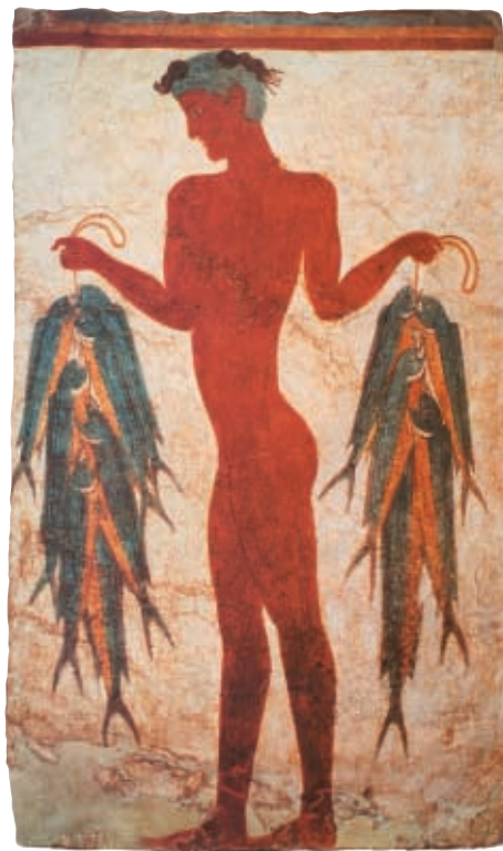
Ο ψαράς, τοιχογραφία 16ου αι. π.Χ. σε σπήλι στο Ακρωτήριο της Θήρας. Αρχαία Ελλάδα, εκδ. Ι. Καρακωτσόγλου, Αθήνα, 1998