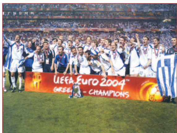
δίνει σε όλους μεγάλη χαρά!!