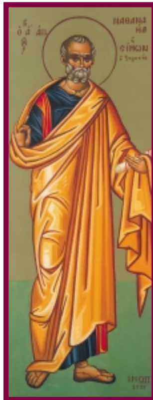
Εικ. 4 η : Ο Ναθαναήλ.

4. Γιατί ο Ναθαναήλ θεώρησε ότι τίποτα καλό δεν μπορεί να προέλθει από τη Ναζαρέτ; Υπάρχουν και άλλες τέτοιες περιπτώσεις, όπου κρίνουμε τους συνανθρώπους μας με βάση την καταγωγή τους; (Μπορείτε ν' αναπτύξετε τη συγκεκριμένη ερώτηση και ως σχέδιο εργασίας, με θέμα «το κοινωνικό πρόβλημα της ξενοφοβίας»).