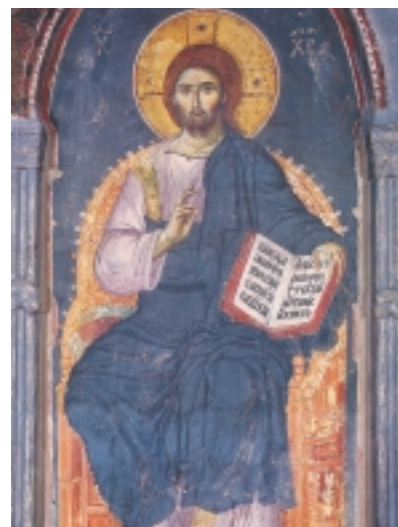
Εικ. 3 η : Ο Χριστός ένθρονος. Τοιχογραφία 13ου αι. μ.Χ., Πρωτάτο, Άγιον Όρος.

Αυτή η αποκάλυψη με είχε συναρπάσει. Τίποτα από όσα είχα ακούσει δεν μπορούσε να συγκριθεί με την αληθινή ζωή που πρόσφερε ο Χριστός. Αισθανόμουν ότι τώρα άρχιζε για μένα η πιο βαθιά γνωριμία με την Αλήθεια».