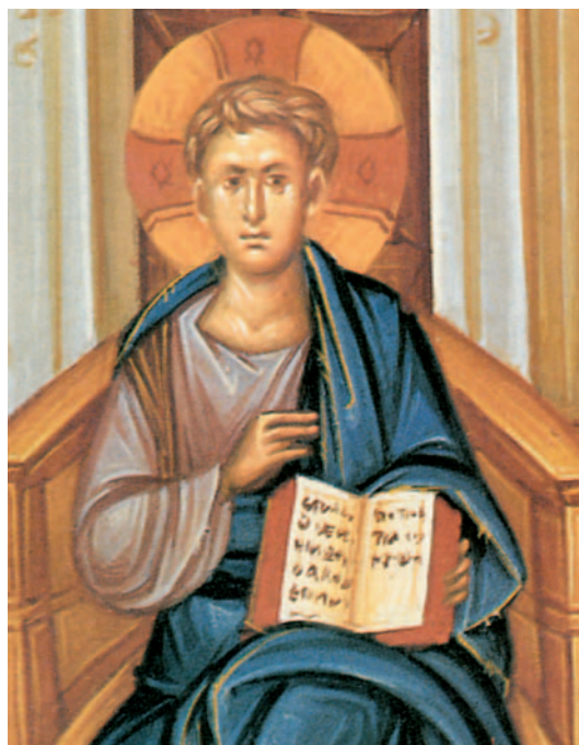
Εικ.6 η : Ο Χριστός διδάσκει (φορητή εικόνα), Ιερά Μονή του Αγίου Γεωργίου «Κοντού», Λάρνακα, Κύπρος.