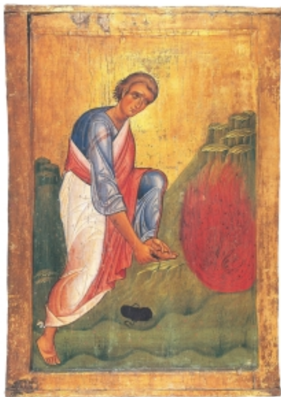
Εικ. 2 η : Ο Μωυσής και η φλεγόμενη Βάτος, 13ος αι. μ.Χ., Μονή Αγίας Αικατερίνης, Σινά.

3. Στην αρχαία Αθήνα υπήρχε ένας βωμός αφιερωμένος στον «άγνωστο Θεό». Ποιος είναι ο λόγος που οδήγησε τους Αθηναίους να χτίσουν έναν τέτοιο βωμό; Μπορείτε να βρείτε περισσότερες πληροφορίες για το βωμό αυτό;