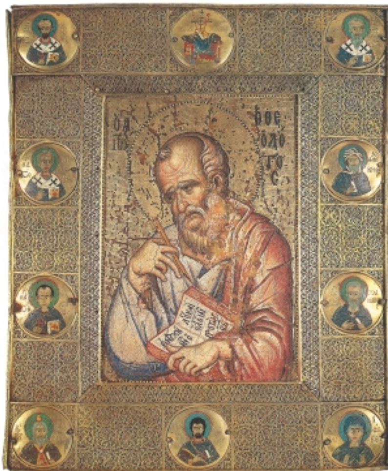
Εικ. 5 η : Ο Ιωάννης ο Θεολόγος (ψηφιδωτή εικόνα), περίπου 1300 μ.Χ., Μονή Μεγίστης Λαύρας, Άγιον Όρος.