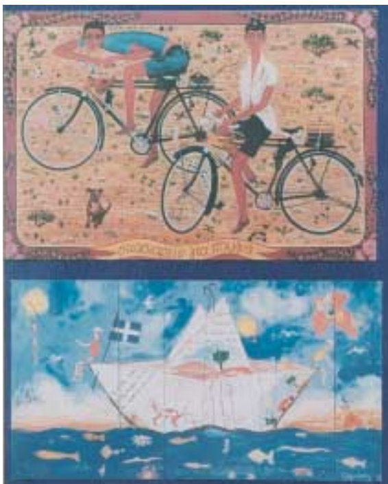
Τσιρώνης Θέμης. Κάρτες, ζωγραφικής σε ξύλο, α) «Σκασιαρχείο για πουλιά» β) «Το καραβάκι»,. 1977 – 78.