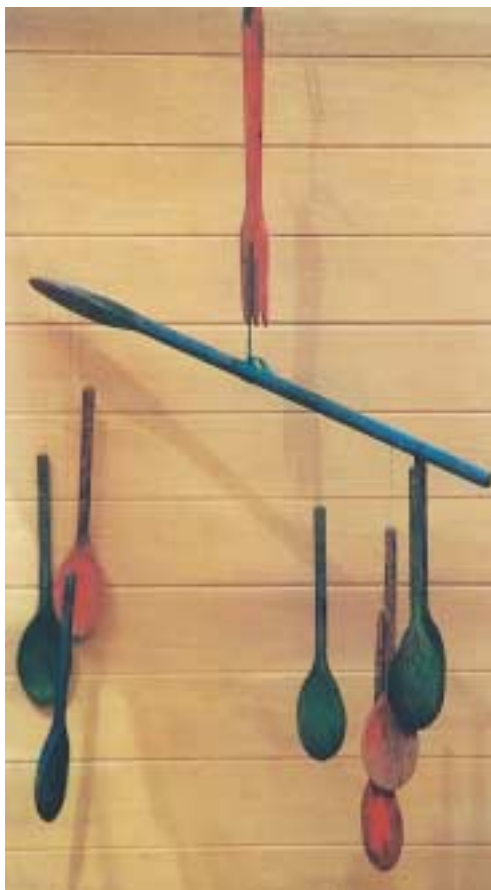
Αιωρούμενη κατασκευή από ξύλινες κουτάλες.