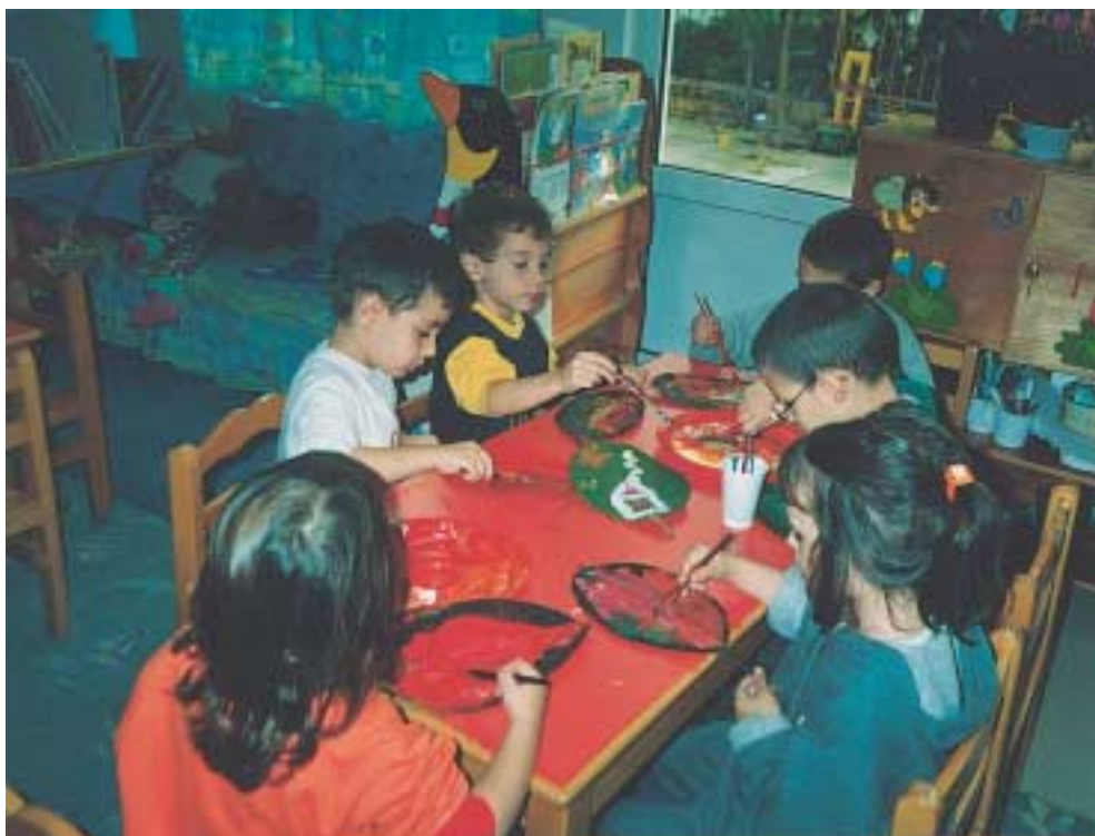
«Ζωγραφίζουμε πάνω σε φύλλα φίκου. Σ' αρέσει το φικόσπιτό μου;»

Οι επιφάνειες πάνω στις οποίες θα ζωγραφίσουν μπορεί να είναι πολυποίκιλες ως προς το είδος, το μέγεθος, το χρώμα και το σχήμα. Έτσι μπορούμε να έχουμε χαρτόνια και χαρτιά διαφόρων χρωμάτων (λευκά και χρωματιστά), μεγεθών (μεγάλα και μικρά), σχημάτων (τρίγωνα, τετράγωνα, κυκλικά, αφηρημένα), ειδών (χαρτιά περιτυλίγματος, του μέτρου, κραφτ, μπρίστολ, χαρτόνια οντουλέ, αλλά και πέτρες, κόκαλα σουπιάς, ξύλα, υφάσματα, χαρτοκιβώτια κ.ά.)