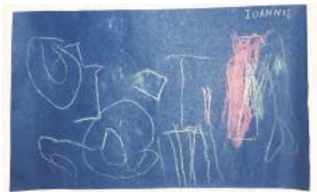
Ζωγραφική με παστέλ (κιμωλίες) σε μπλε χαρτί του μέτρου.