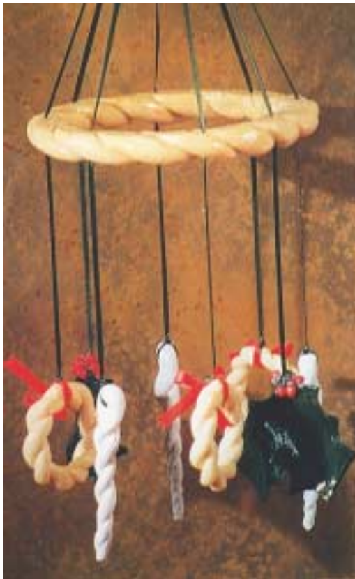
Χριστουγεννιάτικη αιωρούμενη κατασκευή από ζυμάρι περασμένη με βερνίκι.

χειριού του. (Μόρις Ντ., 1996, σελ. 161 – 162 ).