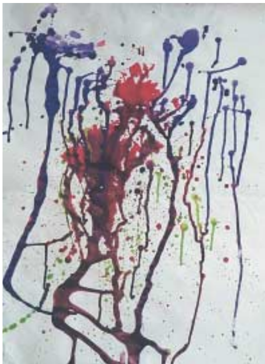
Δημιουργία υφής με κηλίδες.