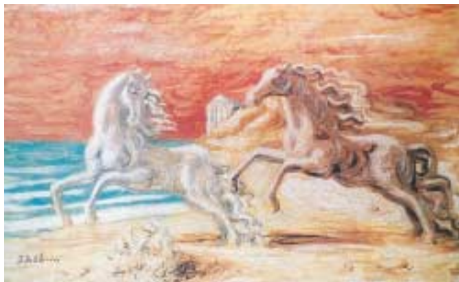
«Άλογα στην ακροθαλασσιά», Ντε Κίρικο Τζόρτζιο, 1930.