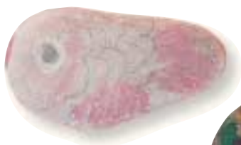
Βότσαλα ζωγραφισμένο με λαδοπαστέλ και τέμπερες.