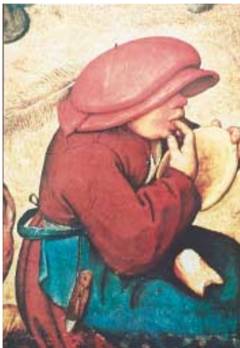
Λεπτομέρεια από το «Χωριάτικο γάμο», Μπρέγκελ Π., 1567.