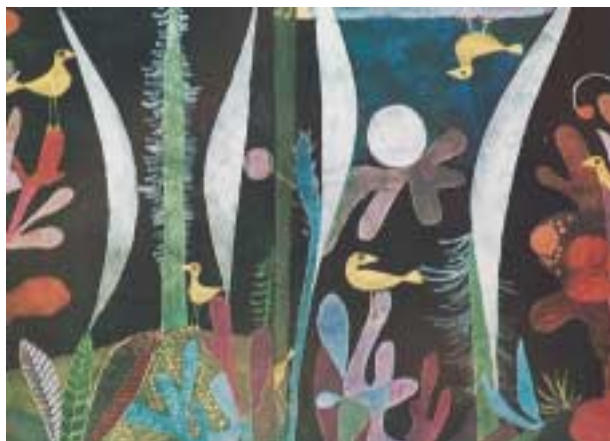
«Τοπίο με κίτρινα πουλιά», Κλέε Π., 1923.