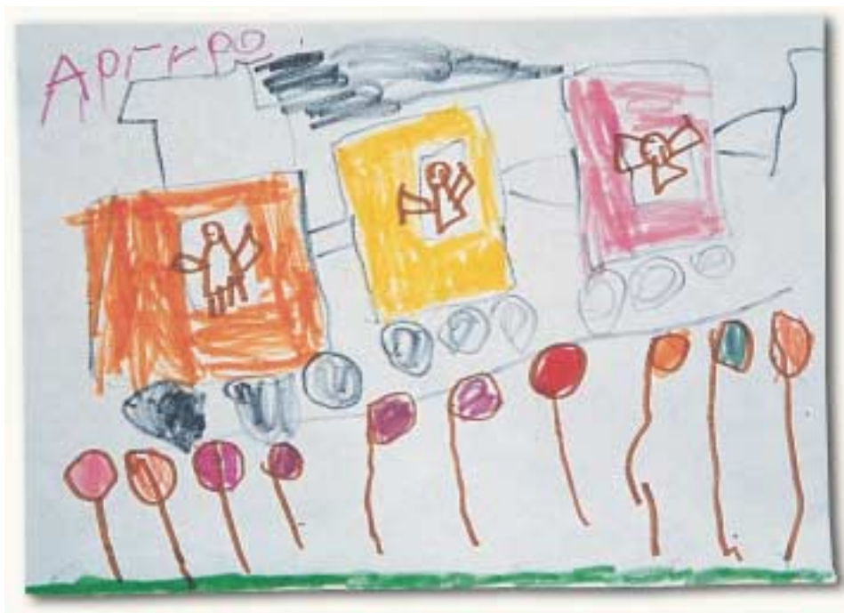
«Τι ωραία που τσουλάμε στην κατηφόρα!»

Πολλές φορές – εν γνώσει τους – δε χρησιμοποιούν τα συμβατικά χρώματα, π.χ. το μπλε για τη θάλασσα και τον ουρανό. Μεγαλώνοντας, τα χρησιμοποιούν περισσότερο, όχι τόσο για να αποδώσουν την πραγματικότητα, όσο για ικανοποιήσουν τους ενήλικες.