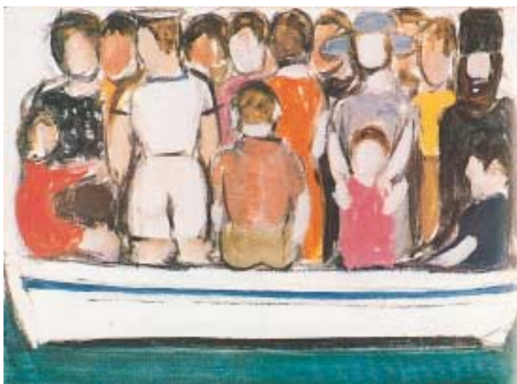
«Η βάρκα», Διαμαντόπουλος Δ.