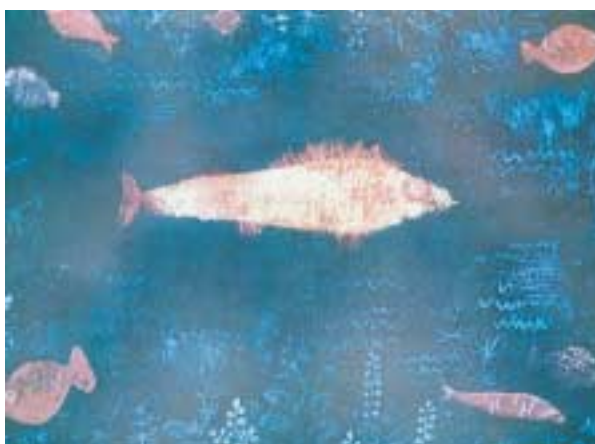
«Το κόκκινο Ψάρι», Κλέε Π., 1925.