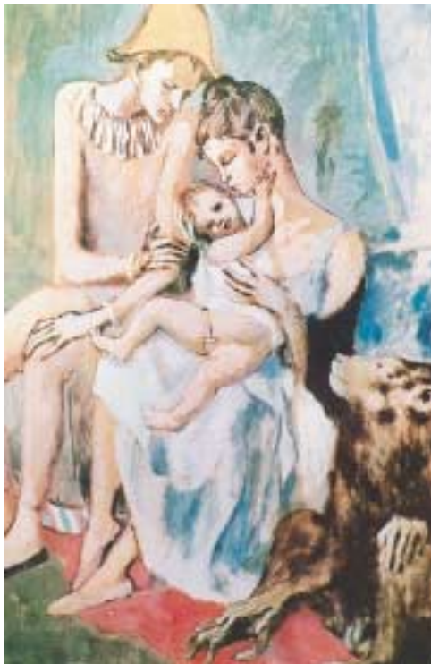
«Η οικογένεια του ακροβάτη» από τη Ροζ περίοδο, Πικάσο Π., 1881.