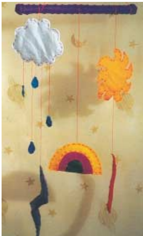
Βρεφική αιωρούμενη κατασκευή από ύφασμα.

Σκοπός της τοποθέτησης του mobile στην κούνια – χώρο του βρέφους είναι να το προκαλέσει να παρατηρήσει και να διαφοροποιήσει τα κινητά σε σχέση με τα ακίνητα μέρη του περιβάλλοντός του. Η τοποθέτηση του mobile αποτελεί ένα οπτικό ερέθισμα, που το βοηθά να κάνει πιο συγκεκριμένο το χαοτικό περιβάλλον μέσα στο οποίο ζει μετά τη γέν-