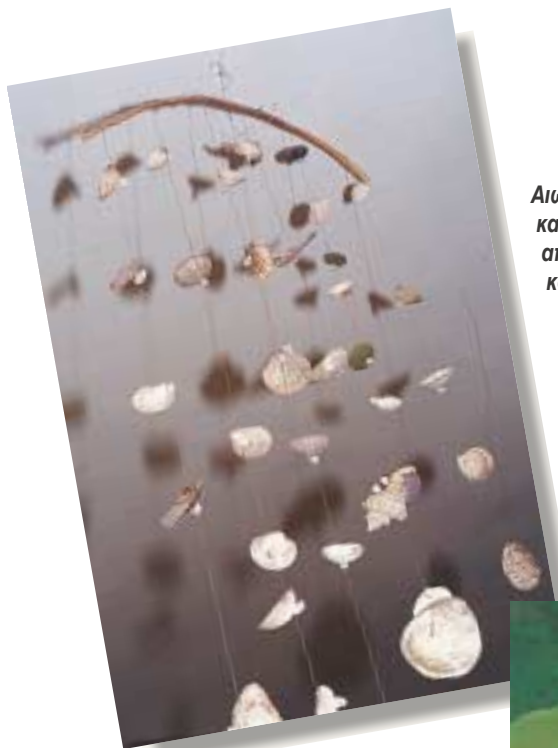
Αιωρούμενη κατασκευή από κοχύλια.