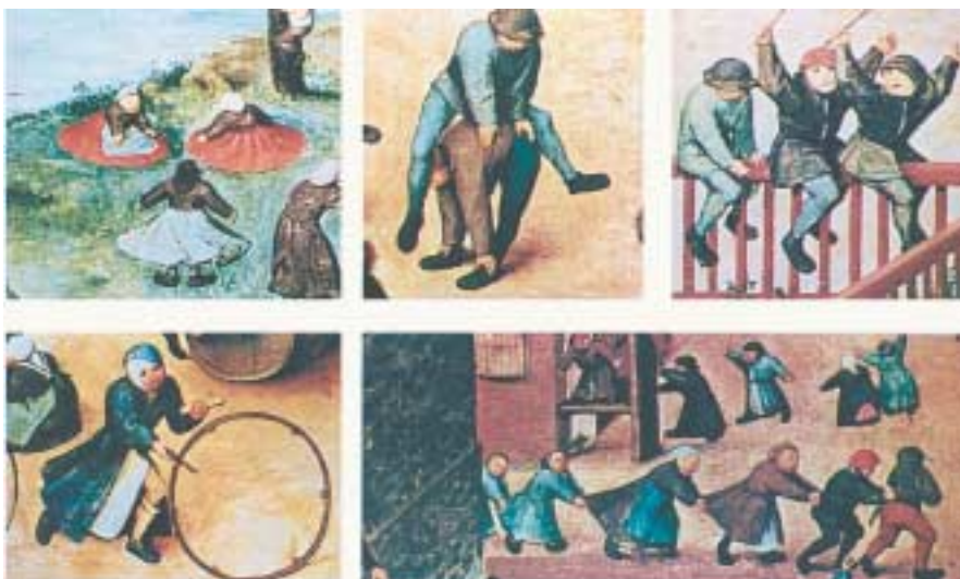
Λεπτομέρειες από τα «Παιδικά Παιχνίδια», Μπρέγκελ Π., 1560.