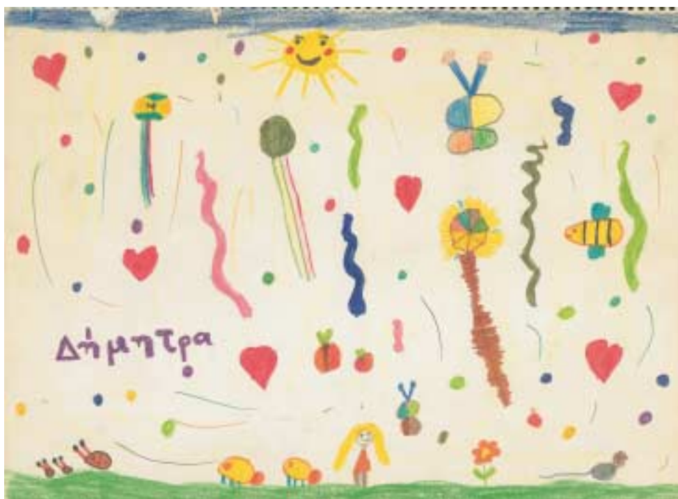
«Όλα πετούν, κινούνται και παίζουν με το χρώμα.» Παιδική ζωγραφιά με μαρκαδόρους.