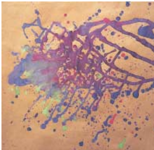
Δημιουργία υφής με «πιτσιλισμα» σε χαρτί.