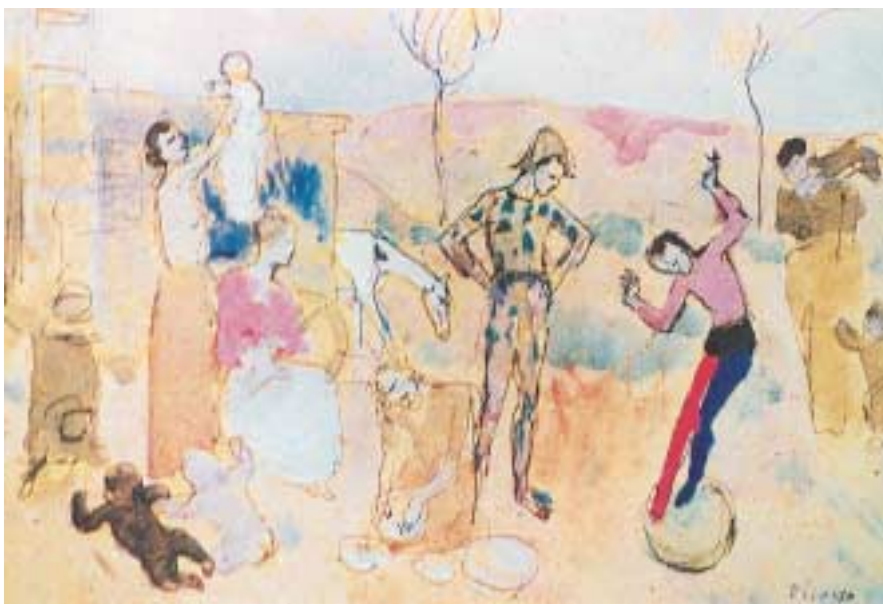
Έργο από τη Ροζ περίοδο, Πικάσο Π.