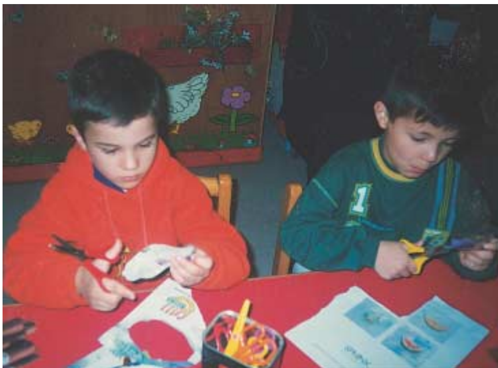
«Κοίτα τι ωραία που πιάνω το ψαλίδι.»

χαρτόνια και χαρτί χοντρό, γιατί το λεπτό χαρτί τσαλακώνει και δυσκολεύει τα παιδιά. Ο/η βρεφονηπιοκόμος δείχνει στα παιδιά το πιάσιμο του ψαλιδιού και τα βοηθάει, έτσι ώστε το καθένα να βρει το πιάσιμο που του ταιριάζει, αφήνοντας τα παιδιά να πειραματιστούν με το να κόψουν τα χαρτιά σε μικρότερα κομματάκια.