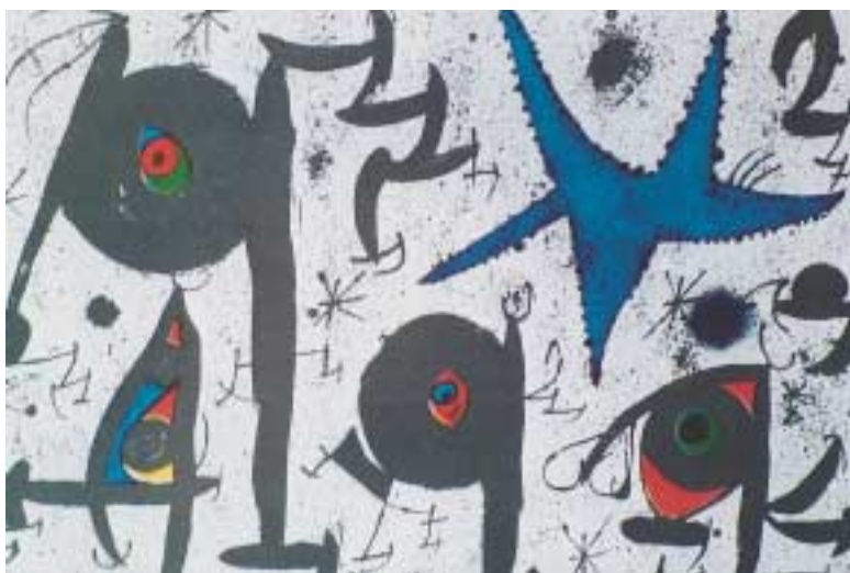
«Μνήμη Χουάν Πρατς», Μιρό Χ., 1971.