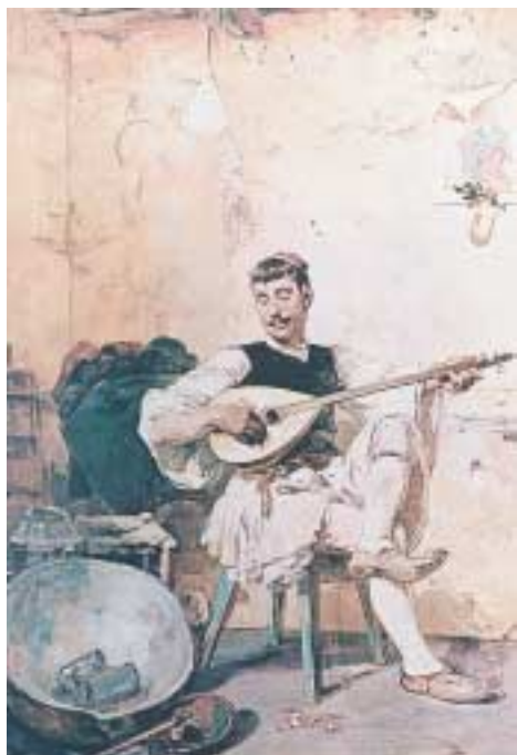
«Ο γαλατάς», Λύτρας. Ν, 1885.