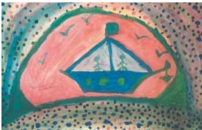
Μεικτή τεχνική: «Πουαντιγισμός – ζωγραφική με βαμβάκι και μπατονέτες.»

«Πιο πολύ απ' όλα μου αρέσει να ανακατεύω το χρώμα με το ρολό.»