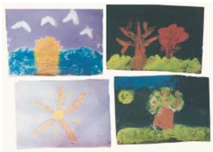
Ζωγραφική με σαπούνι και τέμπρα σε χαρτόνι κανσόν.

Μια παραλλαγή αυτής της τεχνικής, που δίνει ανάγλυφες ζωγραφιές, είναι η ζωγραφική με σαπούνι – σκόνη, αραιωμένο με υδρόχρωμα. Αναμειγνύουμε σαπούνι – σκόνη ή νιφάδες με αρκετά αραιωμένο υδρόχρωμα. Όταν σχηματιστεί ένας πολτός σε κρεμώδη μορφή, ζωγραφίζουμε σε χοντρό χαρτί ή χαρτόνι με πινέλο ή και με τα δάχτυλα. Οι ζωγραφιές μας, όταν στεγνώσουν, θα είναι ανάγλυφες και με πολλά ζωηρά χρώματα. Μπορούμε να ζωγραφίσουμε σε σκούρο χαρτόνι, μόνο με σαπούνι, χωρίς να έχουμε ρίξει υδρόχρωμα.