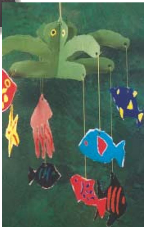
Αιωρούμενη κατασκευή από χαρτί κομμένο με το χέρι.