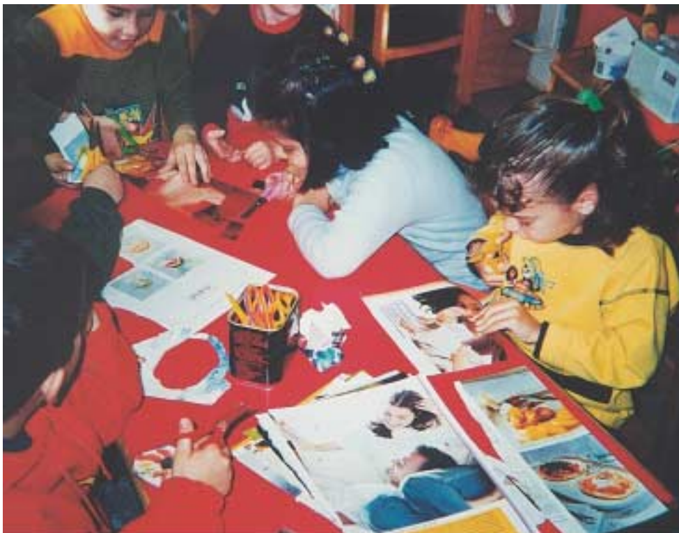
«Εμένα μου αρέσει αυτή η φωτογραφία και θα την κόψω.»

Αφού τα παιδιά μπορούν και κόβουν με ευκολία χαρτί και χαρτόνι, συνεχίζουμε με το κόσμιμο άλλων υλικών πιο απαιτητικών, όπως υφάσματα διαφόρων τύπων, σπάγγους λεπτούς, χονδρούς, κορδέλες, νήματα κτλ.