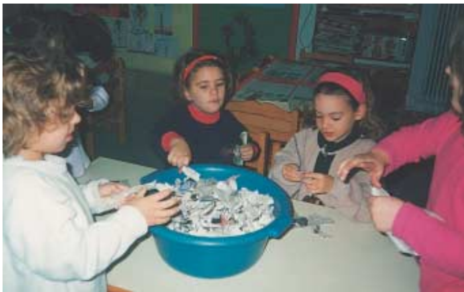
«Σκίζουμε χαρτιά για χαρτοπολτό».