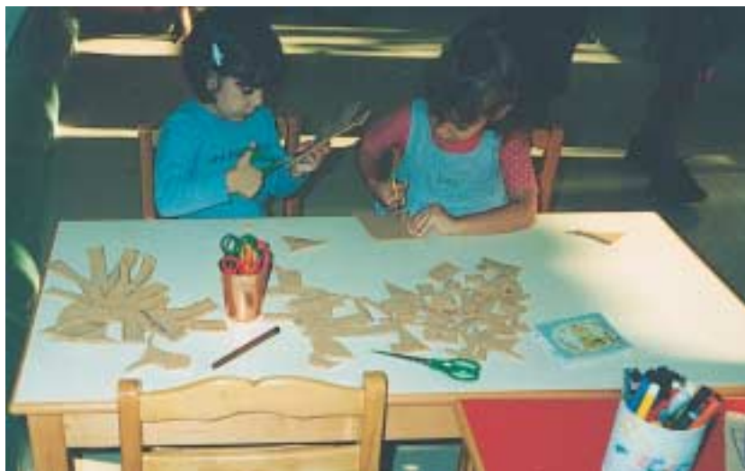
«Κοίτα, τώρα κόβουμε φελλό για να φτιάξουμε φελλόδεντρο.»