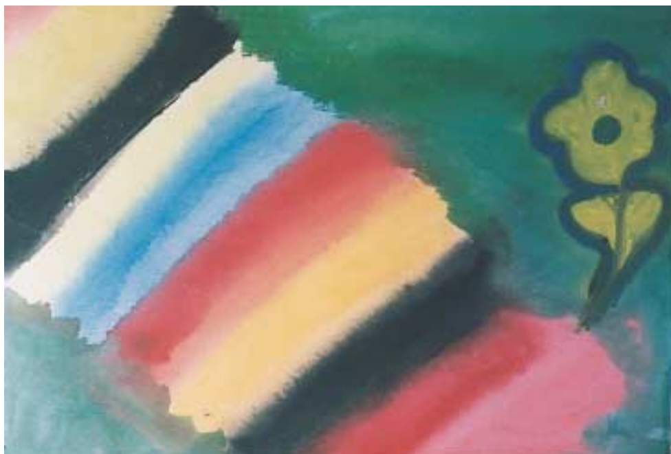
Σύνθεση με τέμπρες σε βρεγμένο χαρτί.

Εάν σε βαμμένο υγρό χαρτί, πετάξεις πιτσιλιές διαφορετικού χρώματος, τη μια πάνω στην άλλη, θα έχεις ένα πίνακα με τα πιο παράξενα λουλούδια. Ενώ, αν βάλεις δύο κηλίδες διαφορετικού χρώματος δίπλα – δίπλα σε βρεγμένο χαρτί, θα δεις τις κηλίδες να ενώνονται και να μπαίνει η μία μέσα στην άλλη, καθώς το χρώμα διαχέεται στο χαρτί.