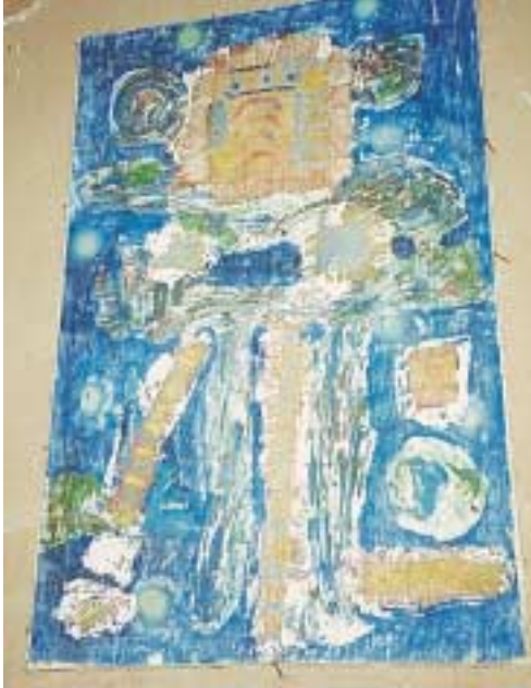
Έργο άγνωστου Μαροκινού ζωγράφου.