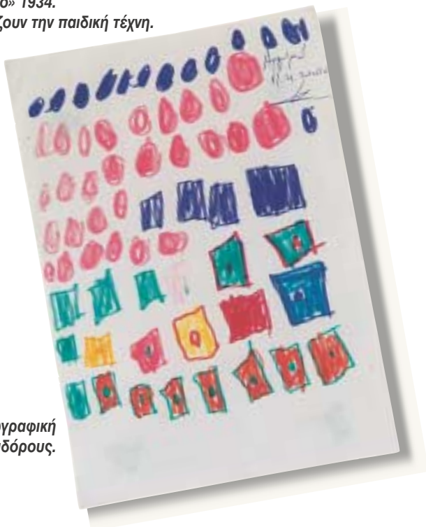
Παιδική ζωγραφική με μαρκαδόρους.