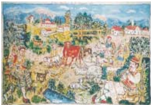
«Ποιμένες της Χειμάρας», Θεόφιλος, Χ., 1933.