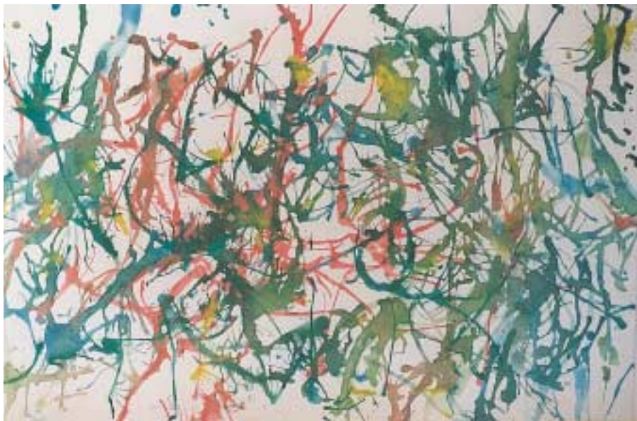
Μείξεις χρωμάτων φυσώντας μέσα από καλαμάκι.