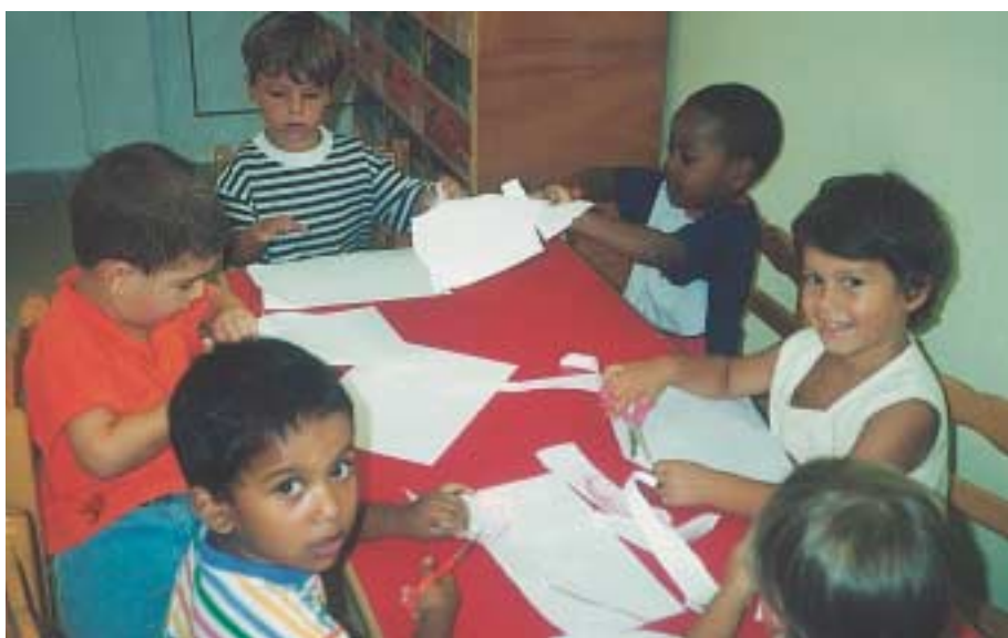
«Κόβουμε με ψαλίδι».