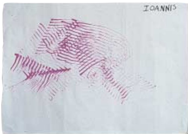
Ζωγραφική με τέμπερα και χτένι.