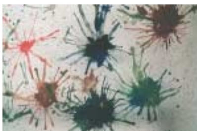
«Κοίτα πως ανοίγουν τα χρώματα με το καλαμάκι.»