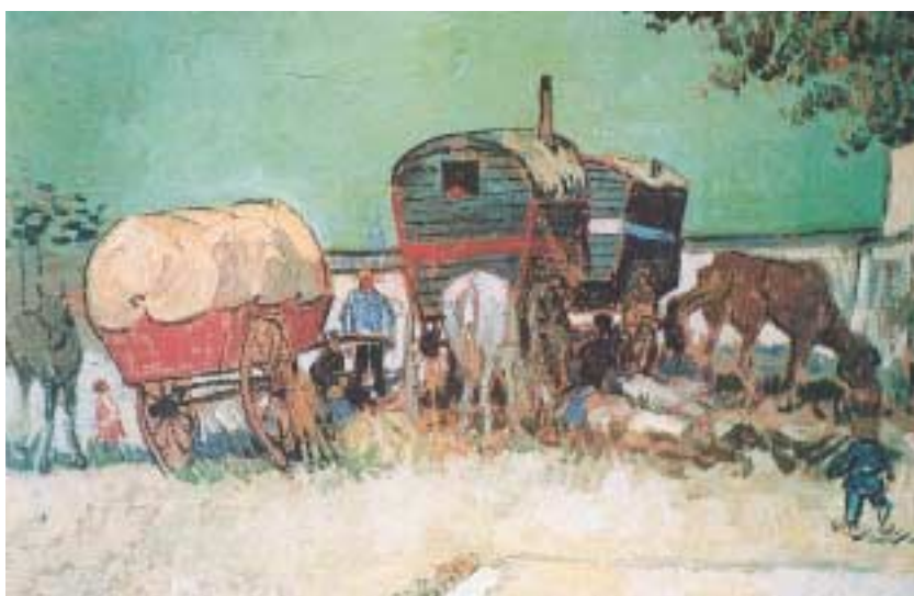
«Τσιγγάνικος Καταυλισμός», Βαν Γκογκ, 1888.