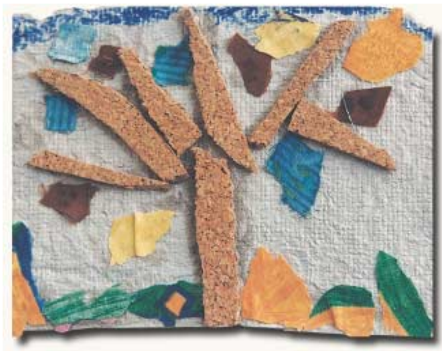
«Έτοιμο το φελλόδεντρο.»