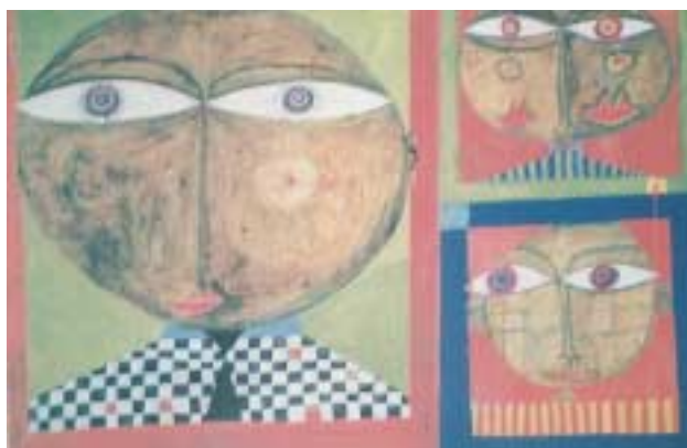
Μέρος από το έργο «99 κεφάλια», Χούντερβάσερ Φ., 1952.