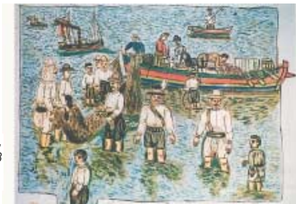
«Γρίπος της Μυτιλήνης», Θεόφιλος, Χ., 1928