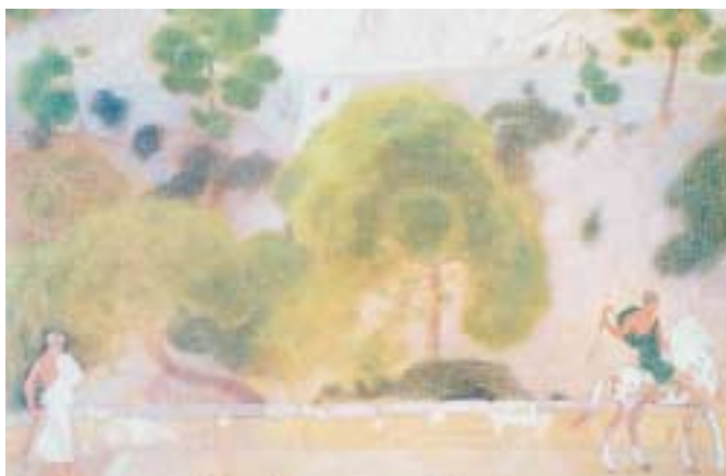
«Η πλαγιά», Παρθένης Κ.