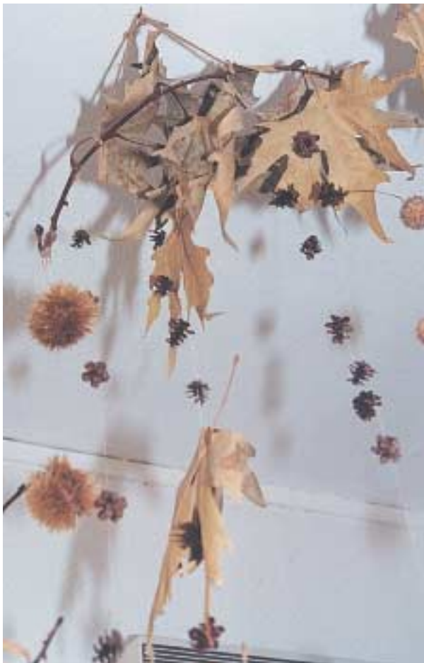
Αιωρούμενη κατασκευή από φύλλα και καρπούς