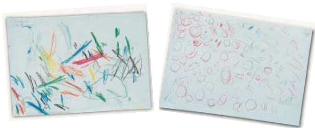
Ζωγραφική παιδιού 2,5 χρόνων.

Πολύ συχνά οι γονείς και οι παιδαγωγοί υποτιμούν αυτήν την περίοδο της παιδικής ζωγραφικής και ασκούν πίεση στα παιδιά κάνοντας αρνητικές κριτικές για τα έργα τους. Η αντιμετώπιση αυτή όμως είναι λανθασμένη, το παιδί πρέπει να ενθαρρύνεται στο να εκφράζεται μέσω του σχεδίου, αλλά και να ασκεί ταυτόχρονα την κίνησή του. Στις δυτικές κοινωνίες δε δίνεται μεγάλη σημασία στην κίνηση και στην εκτόνωση της ενέργειας μέσω αυτής, έτσι λοιπόν αυτή η θεώρηση περνάει και μέσα στην εκτίμηση του παιδικού σχεδίου.