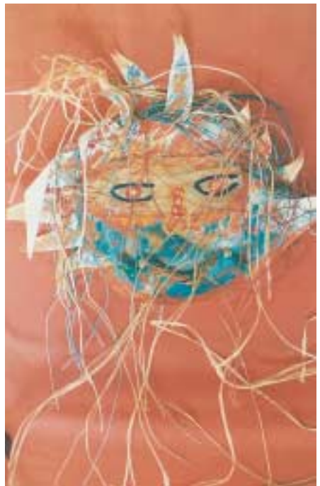
Ελεύθερη κατασκευή με κολάζ και ζωγραφική.