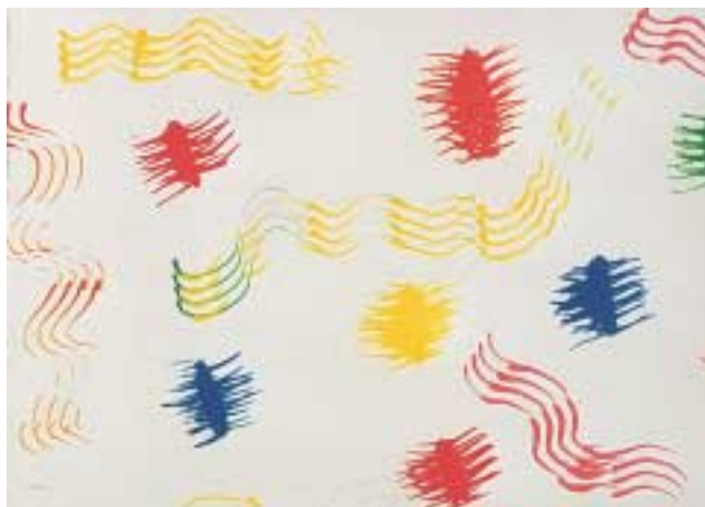
Ζωγραφική με τέμπερα και πλαστικό πηρούνι.