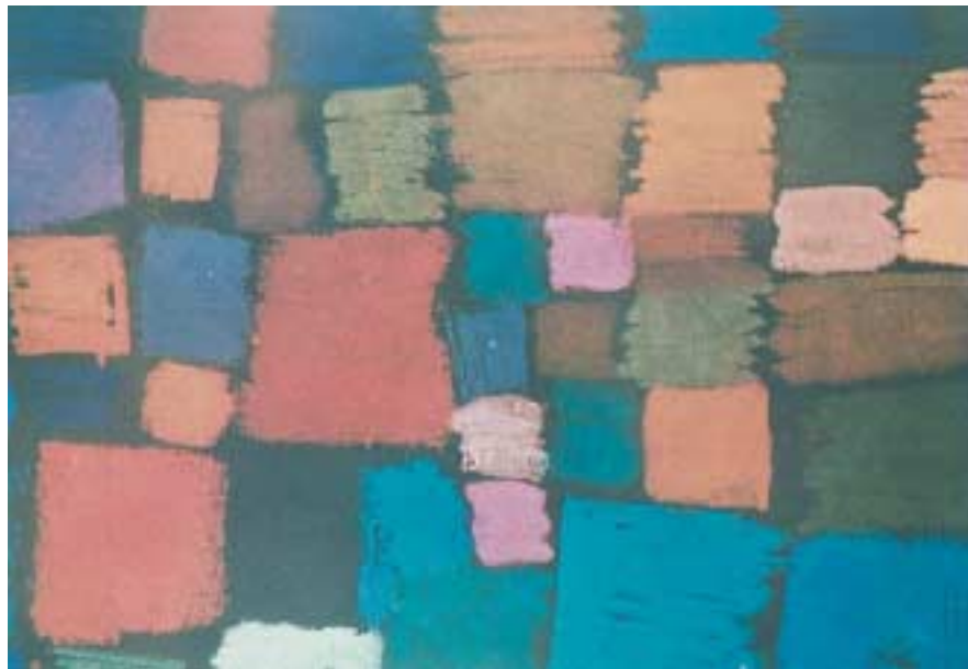
P. Klee «Ανθισμένο» 1934. Τα έργα του θυμίζουν την παιδική τέχνη.