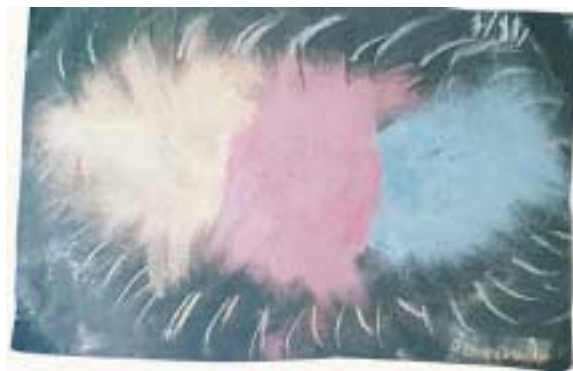
Ζωγραφική με παστέλ (κιμωλίες) απλωμένα με δάκτυλα σε βρεγμένο χαρτόνι κανσόν.