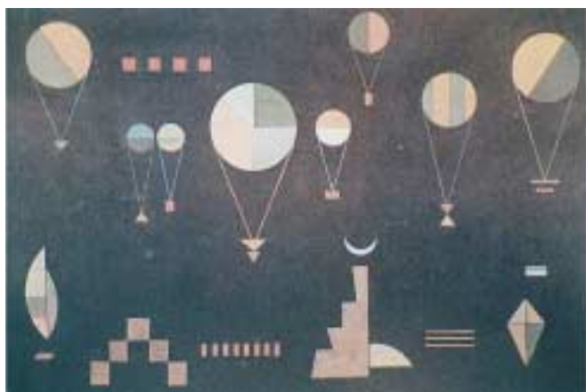
«Επίπεδο βαθύ», Καντίνσκι Β., 1930.