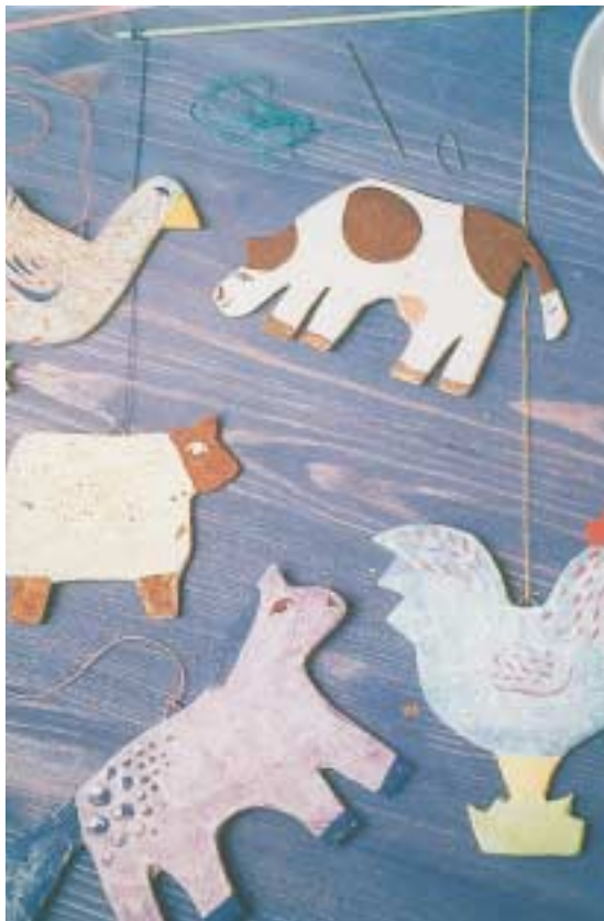
Αιωρούμενη κατασκευή από χοντρό χαρτόνι.

Αυτά μπορεί να είναι: ένα σκουπόξυλο, μια ξύλινη βέργα, μία ή περισσότερες κρεμάστρες, ένα στεφάνι από φελιζόλ τυλιγμένο σε γκοφρέ χαρτί ή πλεγμένο από κλαδιά, σύρμα ή άλλο εύκαμπτο υλικό. Από τις ωραιότερες βάσεις μπορεί να είναι ένα κλαδί δέντρου, που έχει ενδιαφέρον σχήμα, έτσι ώστε να δίνει τη δυνατότητα να κρεμάσουμε τα αντικείμενα από διαφορετικά επίπεδα. Ακόμη, μικρότερες βάσεις, από τις οποίες μπορούμε να κρεμάσουμε ελαφριά αντικείμενα, μπορεί να γίνουν από καλαμάκια πλαστικά, καλαμάκια για σουβλάκια, μικρά κλαδάκια δέντρων κτλ.