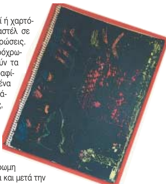
Τεχνική Scruffito με λαδοπαστέλ.