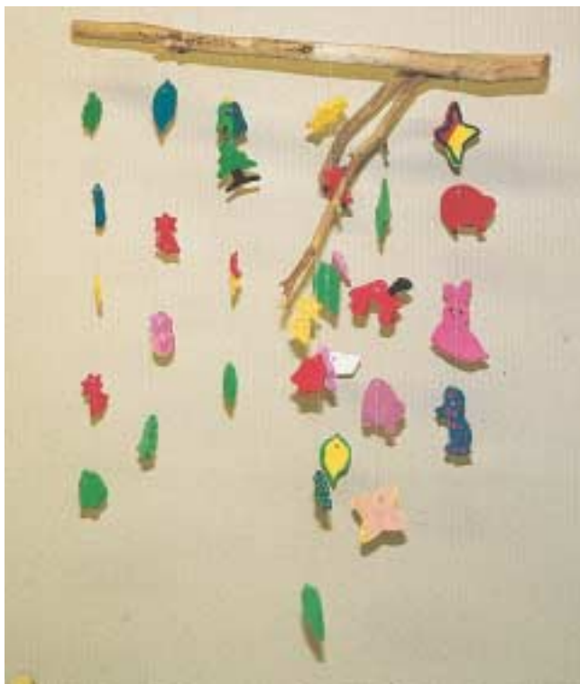
Αιωρούμενη κατασκευή από στοιχεία καμωμένα από πηλό.

Ξεκινάμε από τη βάση στήριξης που αποφασίσαμε ότι είναι η κατάλληλη για την περίπτωση. Αφού την ετοιμάσουμε, την κρεμάμε σε ένα οριζόντιο ξύλο που στηρίζεται σε δύο καρέκλες, με τον ίδιο τρόπο που αργότερα θα κρεμαστεί από το ταβάνι. Στη συνέχεια κρεμάμε ένα – ένα τα αντικείμενα προσπαθώντας να πετύχουμε την ισορροπία της κατασκευής. Αν τα παιδιά είναι μικρά, η διαδικασία γίνεται από τον/την παιδαγωγό, αν είναι μεγάλα και θέλουν να συμμετέχουν, τότε παίρνουν από ένα αντικείμενο και το κρεμούν, όπου νομίζουν. Στην αρχή το mobile δεν ισορροπεί, σιγά – σιγά προσθέτοντας και τα άλλα αντικείμενα σε διάφορα σημεία πετυχαίνουμε την ισορροπία. Στο τέλος, το κρεμάμε από το ταβάνι και ελέγχουμε πάλι την ισορροπία. Η εξασφάλιση της ισορροπίας είναι δύσκολη δουλειά ακόμη και για τον/την παι-