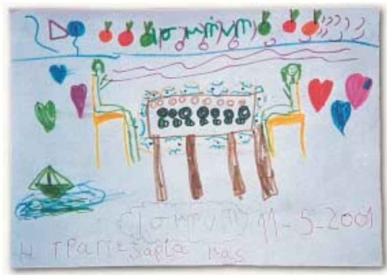
Φωτεινή, χαρούμενη παιδική ζωγραφιά.

Το ιχνογράφημα θεωρείται σήμερα ένα από τα σημαντικότερα μέσα που χρησιμοποιεί το παιδί για να εκφραστεί. Μέσω λοιπόν του παιδικού σχεδίου, μπορούμε να πάρουμε πολλές πληροφορίες για τη νοητική του ανάπτυξη, τη συναισθηματική του κατάσταση, την κινητικότητα του και, γενικά, για την οργάνωση της προσωπικότητας του παιδιού.