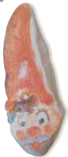
Ζωγραφική σε βότσαλα με ερέθισμα τη μορφή.

Είναι πολύ ενδιαφέρον να δούμε τα αποτελέσματα αυτών των τεχνικών ζωγραφίζοντας σε διαφορετικά υλικά, γιατί έτσι θα μαθαίνουν τα παιδιά να διακρίνουν και τις ιδιότητες των υλικών (απορροφητικό, μη απορροφητικό κτλ.).