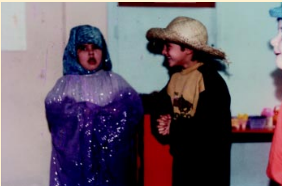
Παιχνίδι ρόλων σε ζευγάρια.