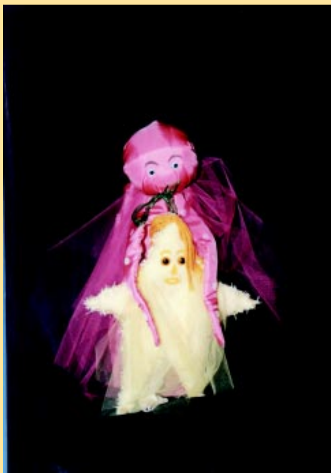
το κοράλι και ο αστερίας μιλάνε για το βυθό της θάλασσας.