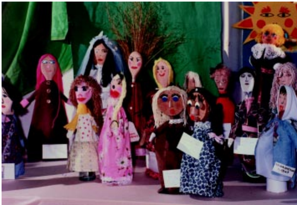
Ο κόσμος της κούκλας. Έκθεση κούκλας των φοιτητριών του Πανεπιστημίου της Αθήνας.