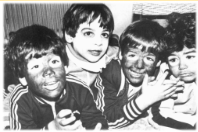
Παρακολουθούμε την άλλη ομάδα.