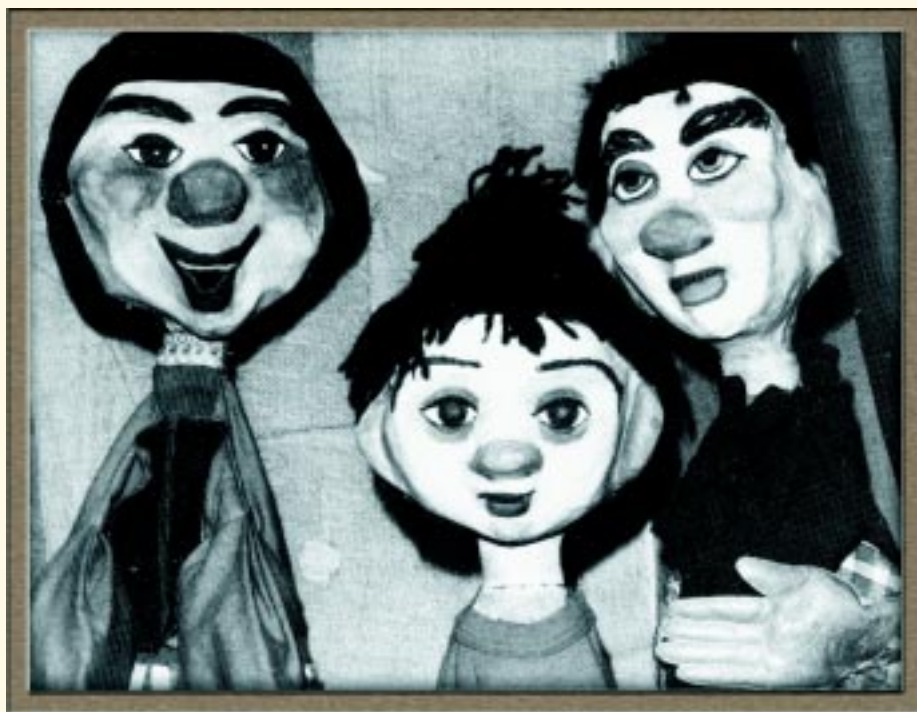
Η παρέα του Μπάρμπα-Μυτούση. Κουκλοθέατρο Αθηνών. Κούκλες της Ελένης Θεοχάρη-Περράκη.