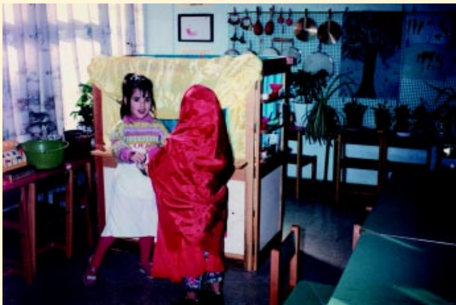
Η κοκκινοσκουφίτσα αγοράζει μια τούρτα για τη γιαγιά της και ένα γλυφιτζούρι για το λύκο...