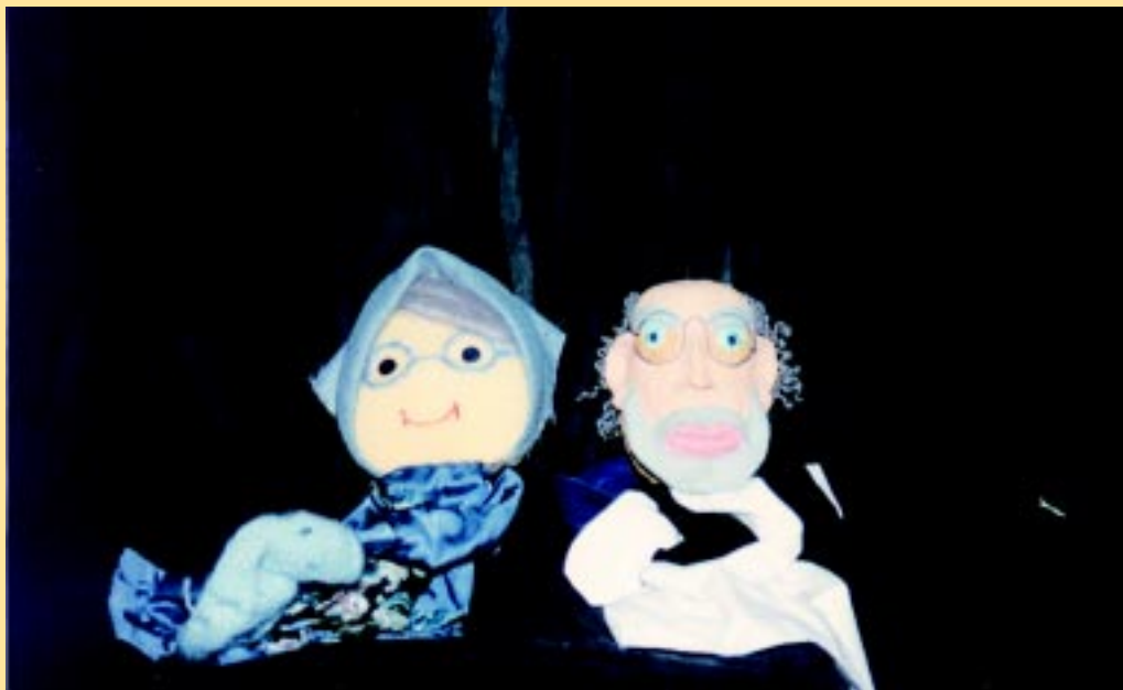
Η γιαγιά και ο παππούς