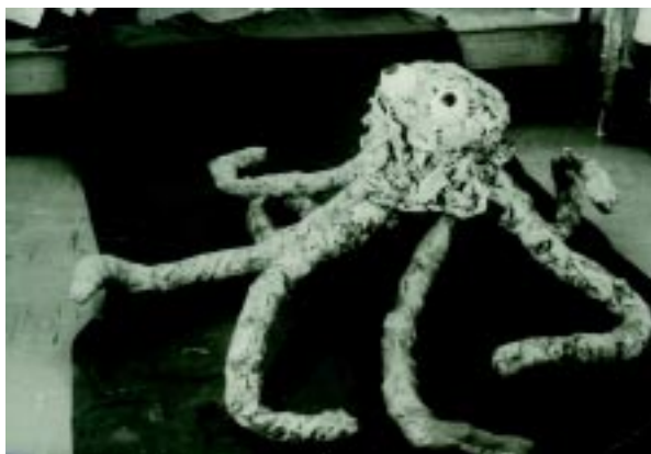
Ένα χταπόδι σε εχολείο χορού (κατασκευή από εφημερίδες και καλόν)

Κάθε παιδί κατασκευάζει με απλό τρόπο διάφορες φιγούρες που παριστάνουν πρόσωπα ή αντικείμενα. Οι κατασκευές αυτές ακόμα και οι πιο απλές απαιτούν τη συνεργασία του δασκάλου.