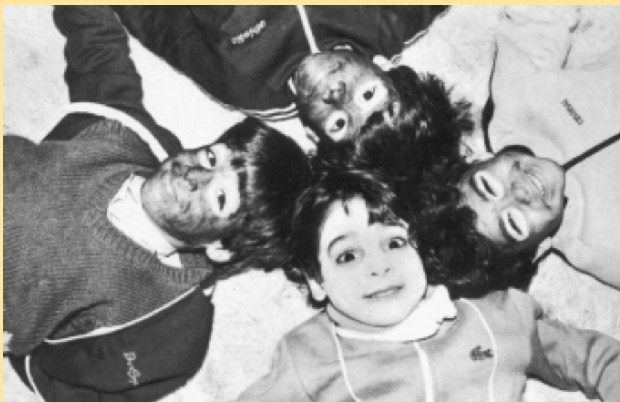
Γινόμαστε ένα αστέρι.