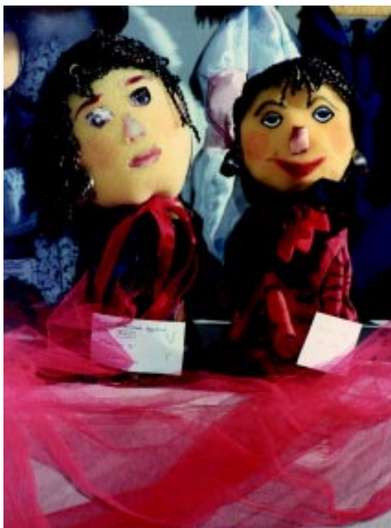
Οι δίδυμες αδελφές (κούκλες από εφονγγάρι)

Κάθε παιδί κατασκευάζει την κούκλα του σύμφωνα με τα ερεθίσματα και τις οδηγίες που του παρέχει ο παιδαγωγός. Η πρόταση του παιδαγωγού καλό είναι να κινητοποιεί και να ελευθερώνει τη φαντασία του παιδιού, ώστε η κατασκευή του να είναι απλή, πρωτότυπη και προσωπική. Είναι απαραίτητο η κούκλα να κινείται εύκολα και να είναι ελαφριά, ώστε ένα παιδί να διευκολύνεται στο χειρισμό της.