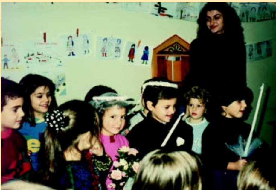
Ο γάμος: Προσεφιλές δέμα στα παιδιά της προσχολικής ηλικίας.