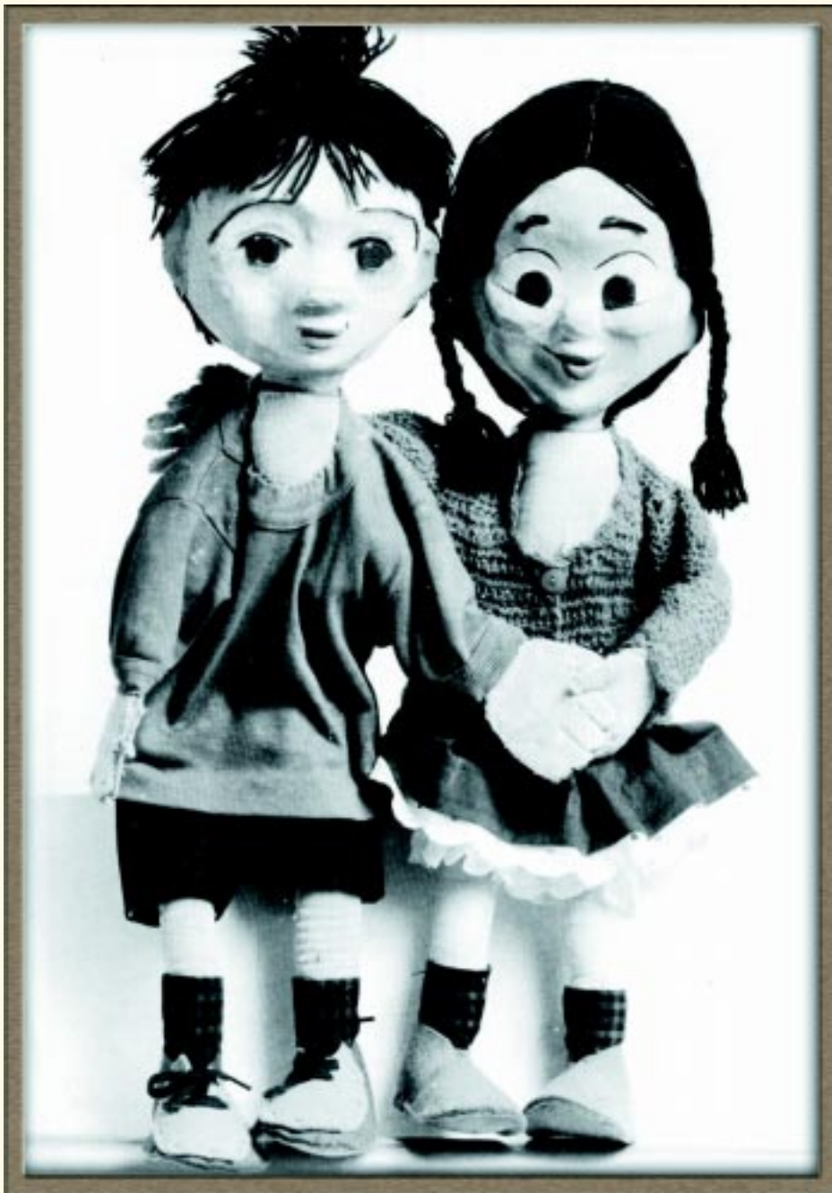
Από το κουκλοθέατρο Αθηνών, ο "Μπαρμπα-Μυτούσης". Κούκλος της Ελένης Θεοκάρη-Περράκη.